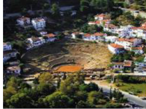
2014 (Anonim, 2014a)