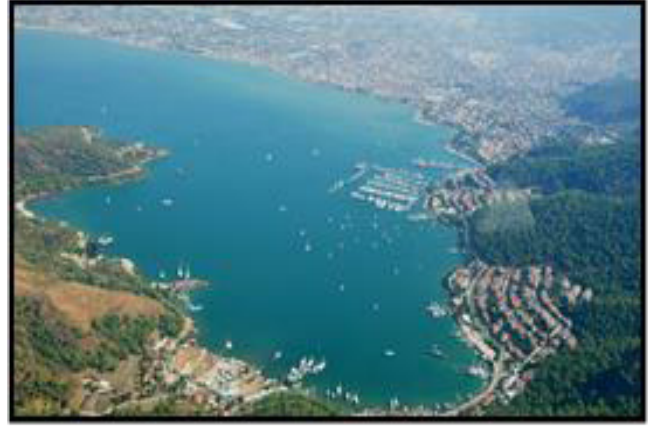
2010 (Can, 2010)