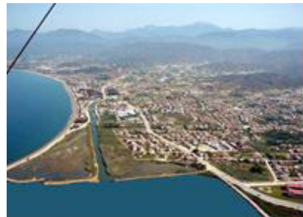
2014 (Anonim, 2014c)