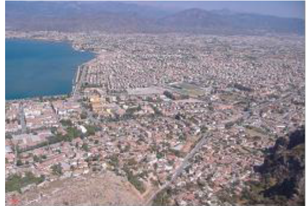
2010 (Can, 2010)