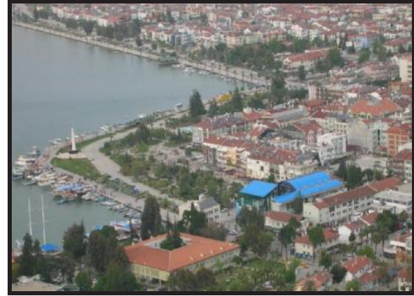
2014 (Anonim, 2014b)