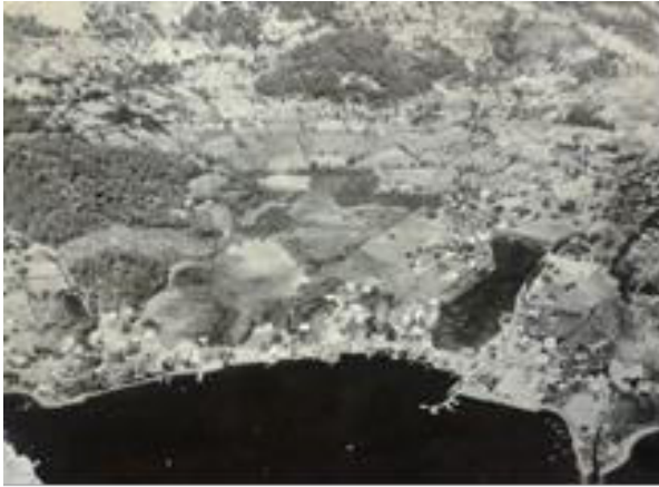
1930 (Anonim, 2014d)

Göcek’in etrafında dik Toros Dağları’nın bulunmasından dolayı sınırlı bir araziye sahiptir. Coğrafi konumunun getirdiği avantajla sakin ve korunaklı bir liman işlevi gören Göcek Körfezinde birçok koy vardır. Bu özelliği ile Göcek, özellikle yat turizmi açısından uluslararası alan-da da ilgi çeken bir turizm beldesi olarak tanınmaktadır (Top ve ark., 2013). Göcek’te de yapılaşma faaliyetleri Fethiye’de olduğu gibi ova tabanından başlamıştır. Ova tabanındaki çoğu tarım arazisi yerleşime açılmıştır. Günümüzde ise ova tabanının neredeyse tamamen dolmasından dolayı yapılaşma orman alanlarına doğru kaymaktadır (Şekil 7).