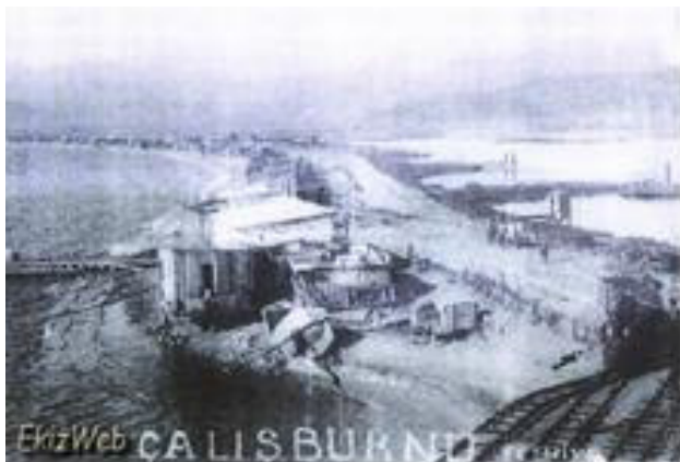
1940 (Fethiye Belediyesi arşivi)

bağlamda, özellikle Çalış Plajı ve civarında yabancılara önemli sayıda konut kiralanmıştır (Avcı ve ark., 2008). Çalış Bölgesi bu süreçte kentleşme hareketlerinden en çok etkilenen yerlerden biri olmuştur. Günümüzde de turizm amaçlı değerlendirilen bölgede eski dönemde sulak-bataklık olan alanlar tamamen yapılaşmaya açılmıştır (Şekil 6).