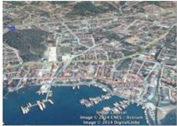
2014 (Anonim, 2014e)