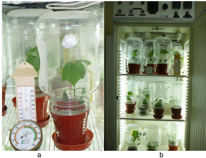
Şekil 1. Parazitoit deneme ünitesi (a) ve denemelerin yürütöldüğü iklim dolabı (b)