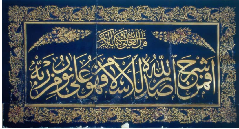
Resim 25: Zamanında Bâlâ Süleyman Ağa Camii'nde Asılı Olan Celf Sülüs Zerendûd Levha