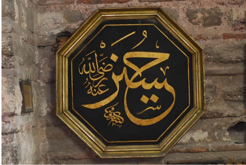
Resim 10: Molla Fenari İsa Camii'nde Bir Ara Yerlerinden İndirilen Cami Takımı Levhalarından Biri