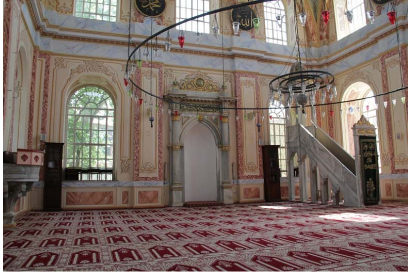
Resim 16: Altunizâde Camii'nin Levhalardan Arındırılmış Hâli (Haziran 2011)