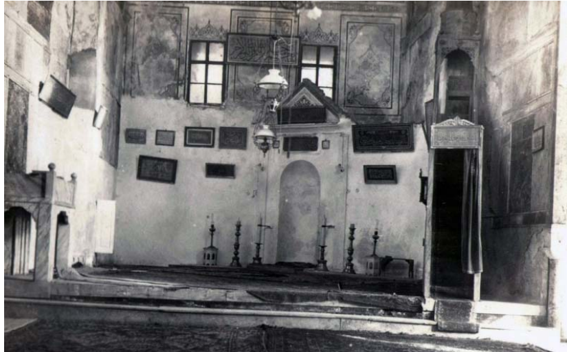
Resim 30: Kalenderhane Camii İçinin 1939 Yılındaki Görünümü