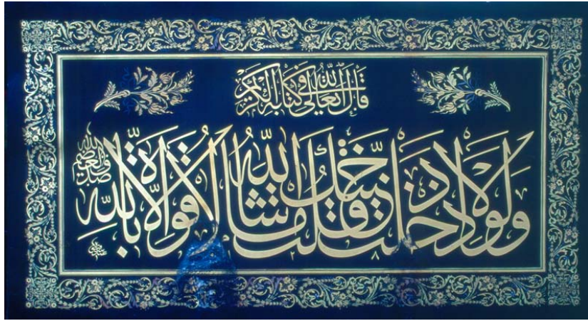
Resim 24: Zamanında Bâlâ Süleyman Ağa Camii'nde Asılı Olan Celî Sülüs Zerendûd Levha