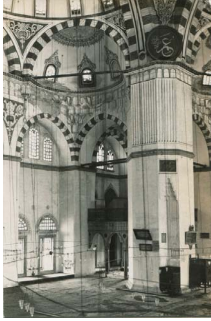
Resim 31: Şehzâde Mehmed Camii İçerisinde Levhaların Asılı Olduğu Dönemden Bir Görünüm