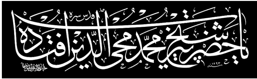
Resim 28: Çarşambalı Mehmed Ârif Bey'in Aziz Mahmud Hüdâyî Camii'nde Bulunan ve Üstünden Geçilerek Bozulan Yazısı (Kalem Güzeli'nden)