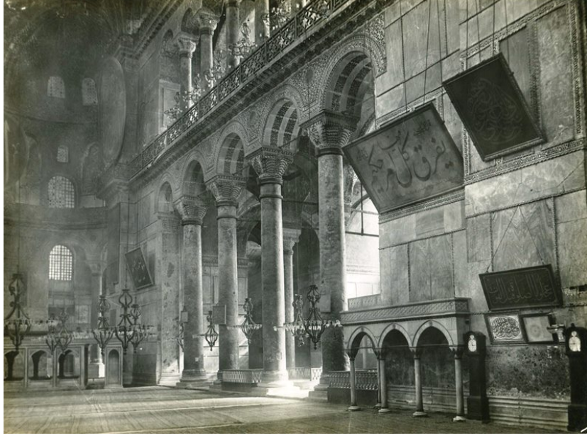
Resim 1: Ayasofya Camii İçerisinden Bir Görünüm