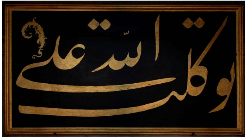
Resim 20: Nuruosmaniye Camii'nde Sanat Eseri Olmaktan Çıkarılan Levha