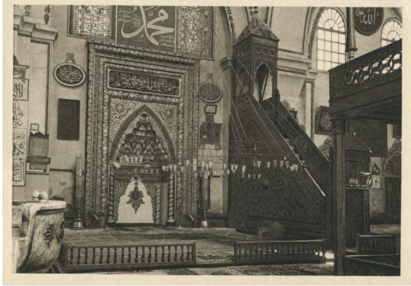
Resim 2: Bursa Ulucami Mihrabı'nın Levha ve Yazılarla Dolu Eski Hâli