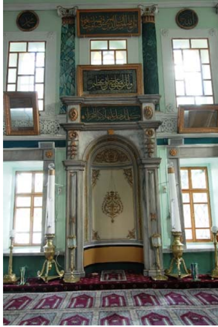
Resim 8: Emirgan Camii'nin içinde çalınan yazıların boş çerçeveleri görülmektedir.