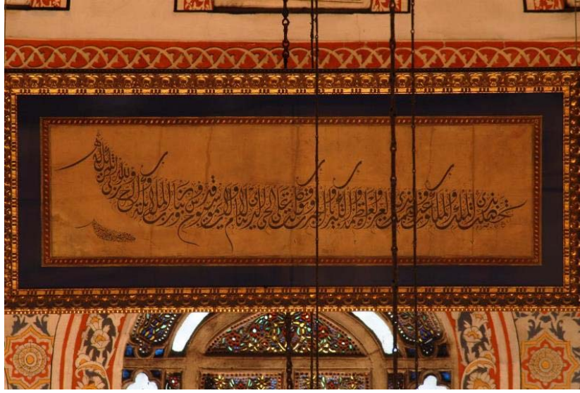
Resim 27: Kılıç Ali Paşa Camii'nden çalınan ve daha sonra bulunan Şefik Bey imzalı celî dîvânî levha gözün zor görebileceği yüksekliğe asılmıştır.