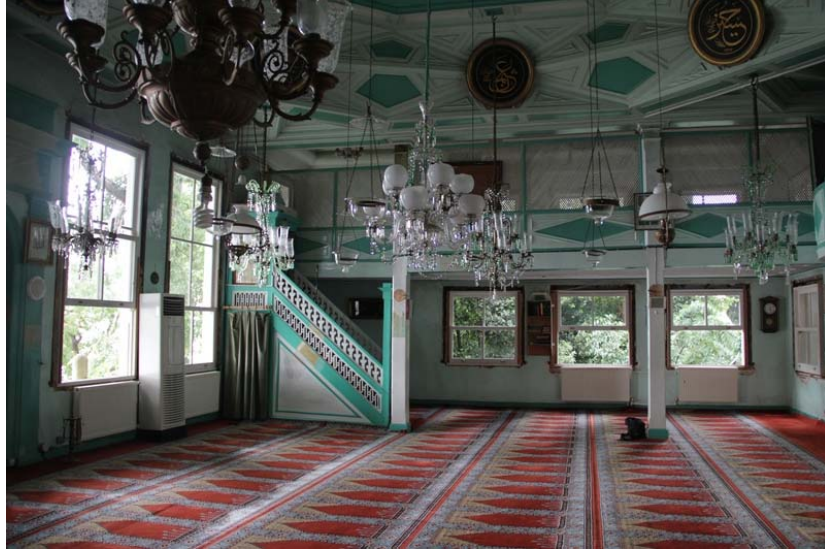
Resim 26: Yahya Efendi Mescidi'nin Levhalardan Arındırılmış Hâli (Haziran 2011)