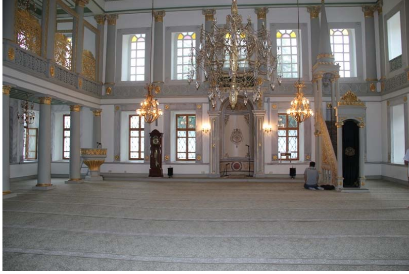
Resim 9: Emirgân Camii'nde hiç hüsn-i hat levhası bırakılmadı. Cami takımı yazıları bile müzeye kaldırıldı. (Haziran 2011)