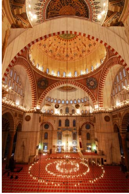
Resim 3: Süleymaniye Camii İçerisindeki Yazıların Görünümü