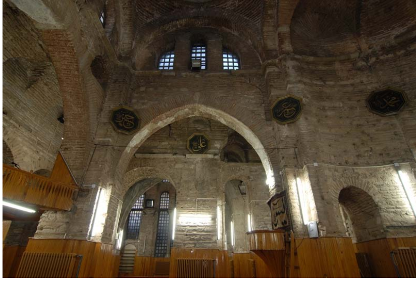
Resim 11: Molla Fenâri İsa Camii'nde Yerine Asılan Cami Takımı Levhaları