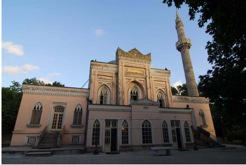
Resim 12: Yıldız Hamidiye Camii