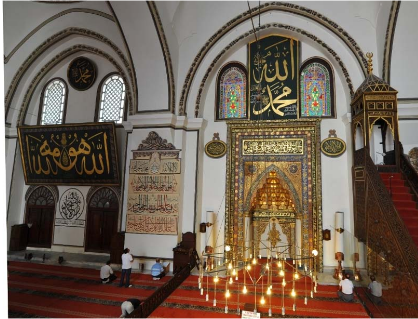
Resim 4: Ulucami Mihrabı ve Çeşitli Yazılar