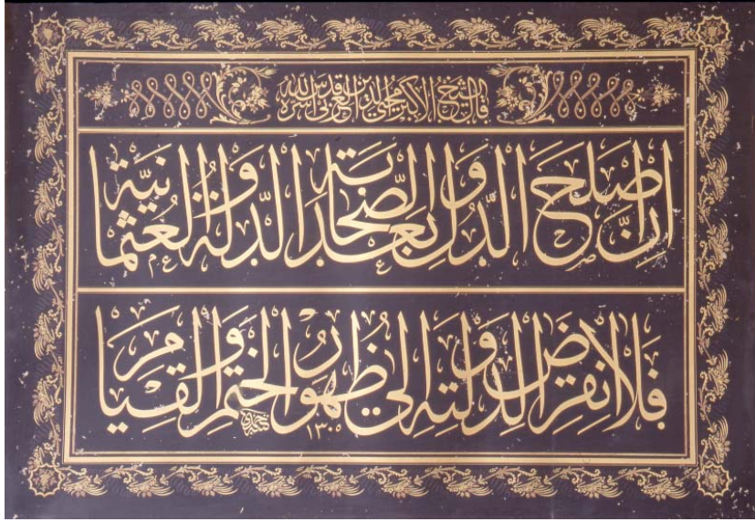
Resim 14: Zamanında Yıldız Hamidiye Camii'nde Aslı Olan Muhsinzâde İmzalı, İbn Arabî'ye İzafe Edilen Söz