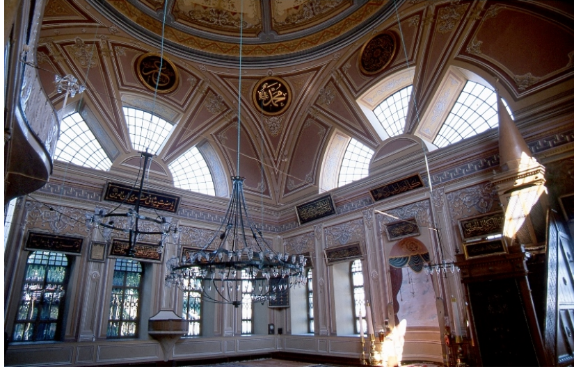
Resim 5: Cihangir Camii'nin Levhalarla Dolu Olduğu Zamanki Hâli (Temmuz 2000)