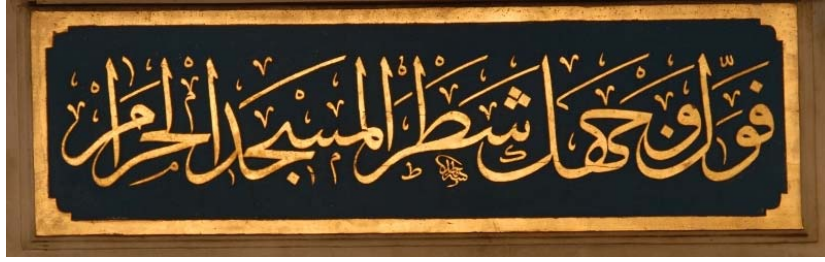
Resim 7: Arab Camii Mihrab Âyeti, Mâcid [Ayrall] İmzalı