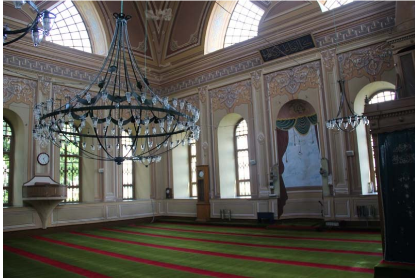
Resim 6: Cihangir Camii'nin Levhalardan Arınmış Hâli (Haziran 2011)