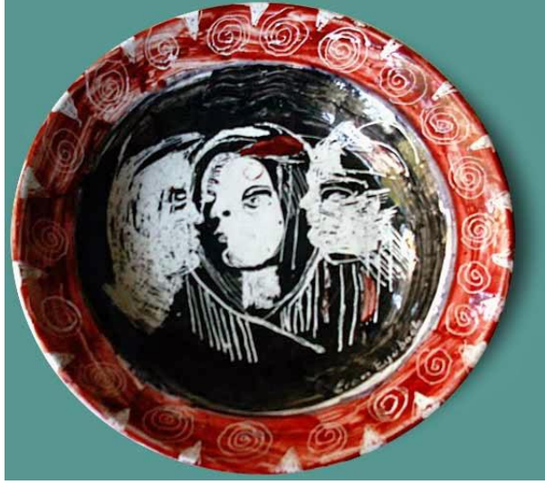
Resim 10: Seramik Tabak