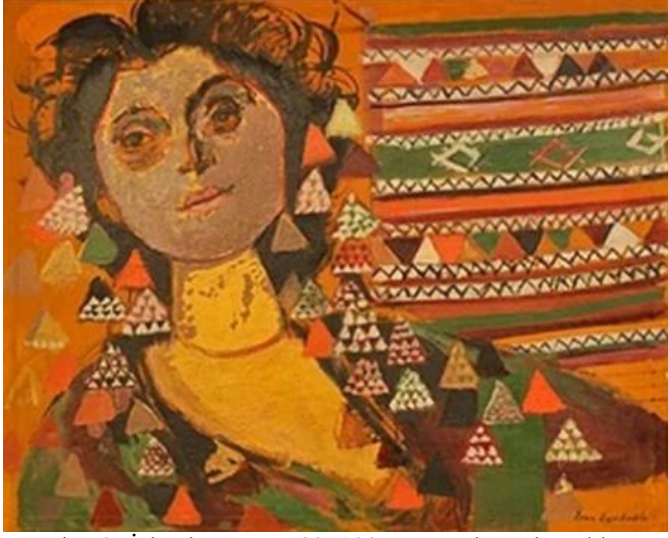
Resim 6: İsimsiz Portre, 82x100cm Tuval üzeri yağlıboya