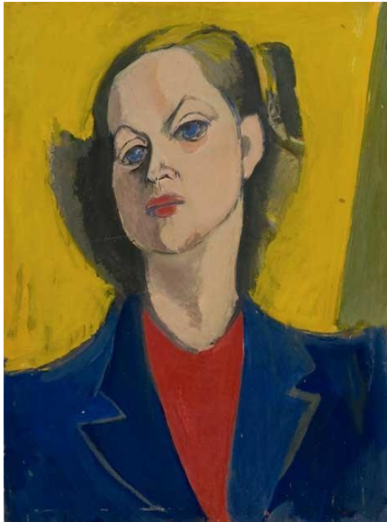
Resim 5: Portre 65x49cm. 1952