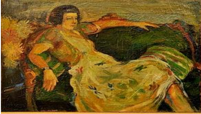
Resim 2: Kanepede kadın 1947, Tuval üzeri yağlıboya, Kaynak: www.turel-art.com