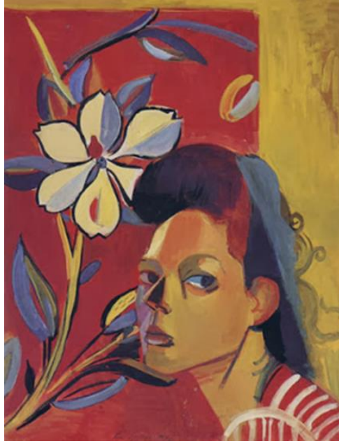
Resim 4: Resim 3: Oto Portre, 1948. Kontrplak üzeri Yağlıboya