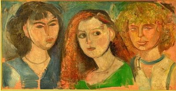
Resim 3: Üç güzeller, 55x100cm, tuval üzerine yağlıboya, tahminen 1947