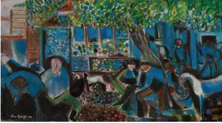
Resim 9: Pazar yeri 1983, Tuval Üzeri Yağlıboya