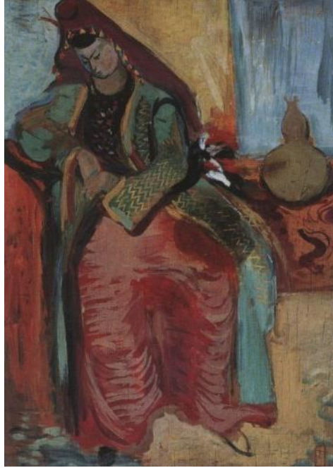
Resim 8: Bursalı Ağlayan Gelin http://mithatsarcan.blogspot.com