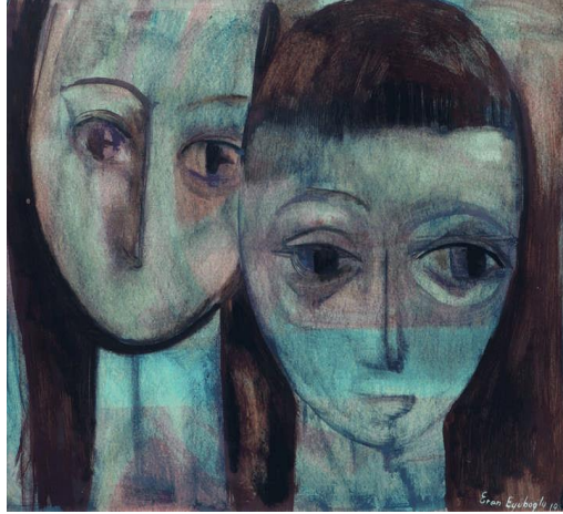
Resim 7: İki kadın 1961, Kağıt üzeri yağlıboya