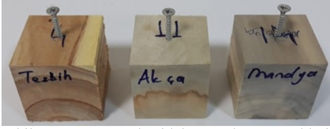
Şekil 1. Teğet yüzeyde vidalanmış deney örnekleri