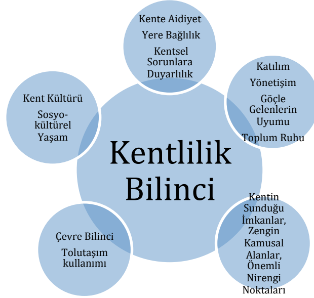
Şekil 2 Kentlilik bilincini oluşturan bileşenler