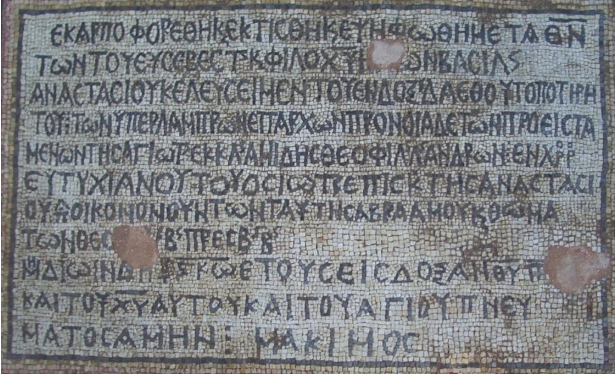
Resim 2: Zemin döşemesi olarak kullanılmış mozaik üzerindeki yazıt (Mardin Müzesi Arşivi)