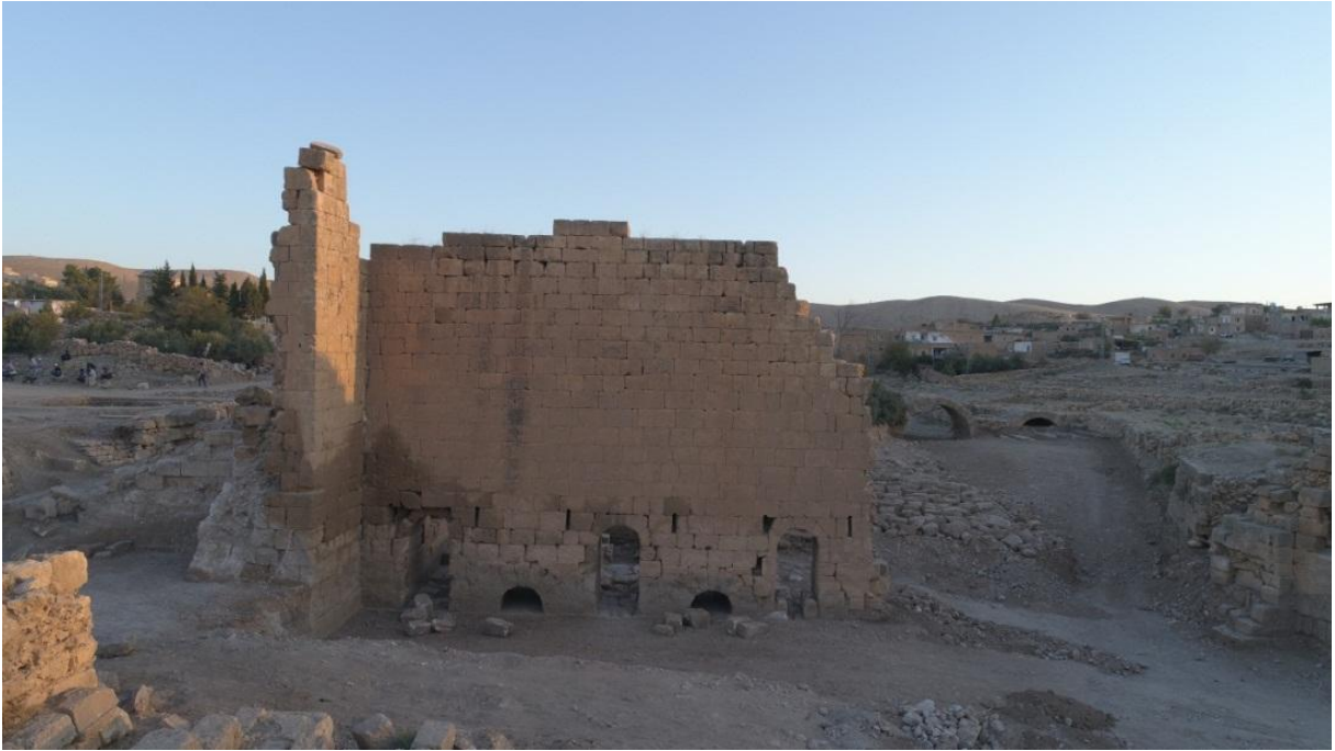
Resim 3: Dara Güney Sur genel bir bakış