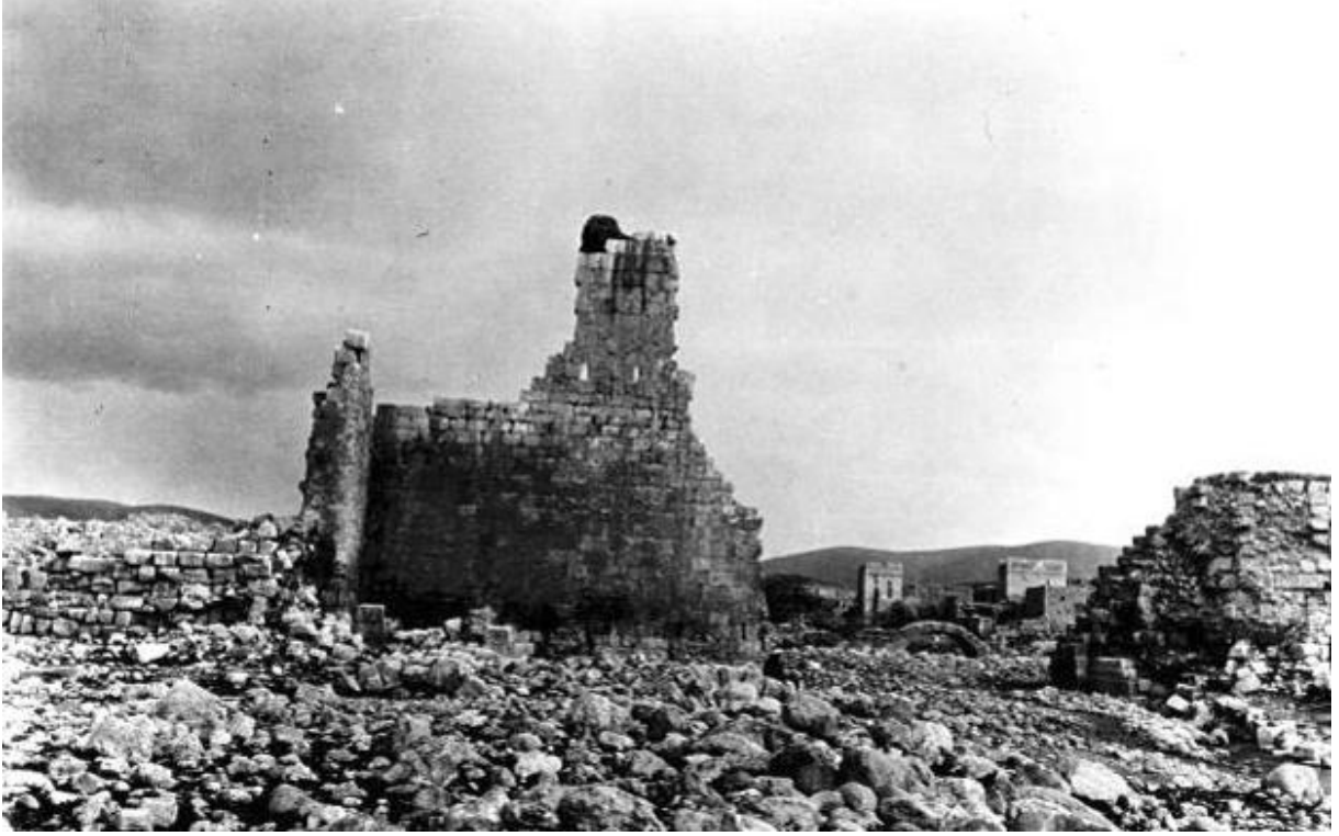
Resim 4: Olası I. Iustinianus Dönemi (527-565) eklemesi: günümüze gelmemiş olan sur üstündeki mazgallar ve seyirdim yerinin 20. yüzyıl başları görünümü