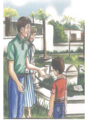
Resim 2: Namık Kemal'in kabrini ziyaret

Üçüncü çalışma olan İstanbul’da isimli kitapta ise 14 çizim kullanılmıştır. Bunlardan 2’si yolculuğun geçtiği aracın içini, 1’i İstanbul boğazı ile Boğaz Köprüsü’nü, 2’si Gülhane Parkı’nı, 2’si Topkapı Sarayı’nı, 2’si Arkeoloji Müzesi’ni, 1’i Yerebatan Sarnıcı’nı, 1’i Ayasofya Müzesi’ni, 1’i Sultanahmet Camii’ni, 1’1 Alman Çeşmesi’ni, 1’i de Sahaflar Çarşısı’nı içindeki ziyaretçilerle