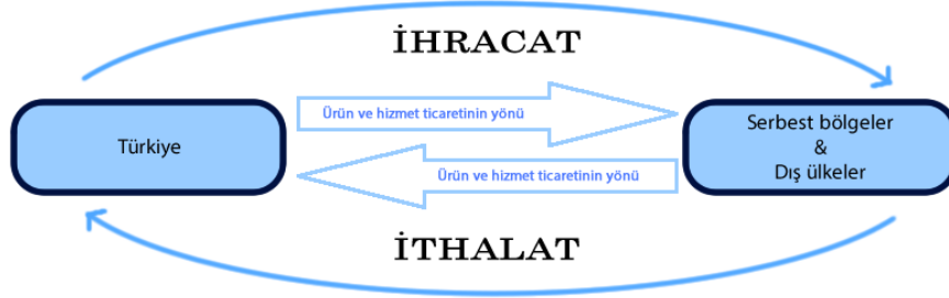
Şekil 1. İthalat ve ihracat

olarak gerçekleştirdikleri mal ve hizmet ticareti şeklinde ifade etmek mümkündür. Dış ticaretin temelde ihracat ve ithalat şeklinde olmak üzere iki bileşeni bulunmaktadır. İhracat kavramı ile bir mal ya da hizmetin daha önceden belirlenmiş kurallara uygun bir şekilde gümrük işlemleri de gerçekleştirilerek bir bedel karşılığında bir ülkeden serbest bölgelere ya da yabancı ülkelere satışı iken, ithalat ise, ihracatın tam tersi bir süreç izlenerek mal ya da hizmetlerin bir bedel karşılığında yabancı ülkelere ya da serbest bölgelerden satın alınarak ülkeye girişinin sağlanmasıdır (Yılmaz ve Özken, 2012). Genellikle ihraç edilen mallar çeşitli nedenlerle (iklim koşulları, doğal kaynaklara sahiplik) ülkede bolca üretilen ve ihtiyaç fazlası olan ürünlerden oluşurken, ithal edilen mallar, ülkede üretimi gerçekleştirilemeyen ya da yüksek maliyetle üretimi gerçekleştirilebilen mallardır.