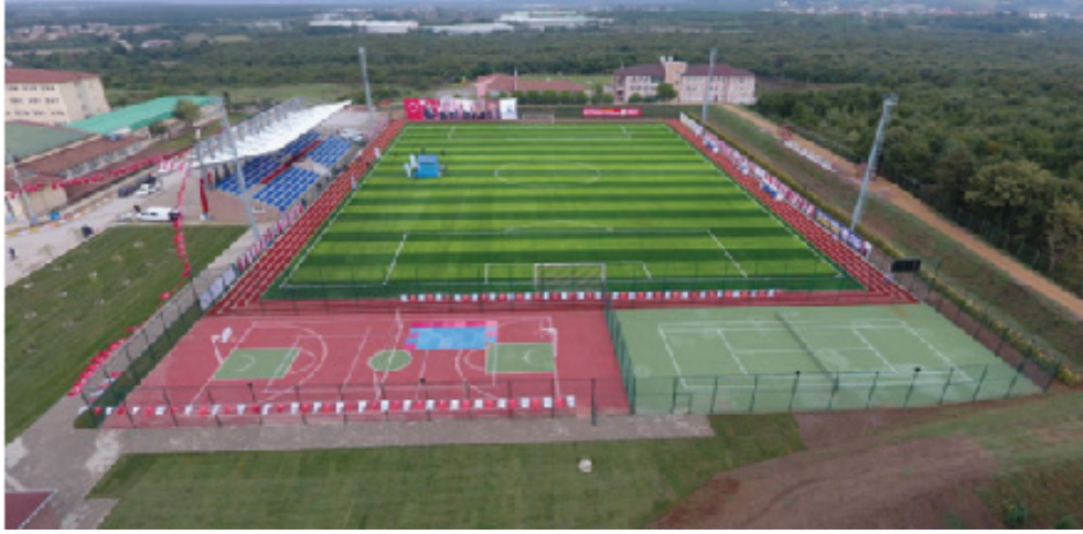
Foto 6. Spor Tesisleri - Kartepe

Kartepe bölgesinin coğrafi konumu, özellikleri ve özellikle spor turizmine yönelik birçok etkinliği bünyesinde barındırması ile beraber spor temalı ilçe profili oluşturmaktadır. Spor temalı ilçe adlandırması tarafımızdan ortaya atılan bir kavram olup bu çalışma spor temalı ilçe olmak için hangi kriterleri veya süreçleri yerine getirmek üzere bir tartışma başlatması açısından bu çalışmayı önemli kılmaktadır. Spor temalı ilçe planlamasına yönelik yapılacak stratejik planlama ve sonrası uygulamaya geçirmek üzere yapılması gerekenler sadece bu çalışma kapsamında ortaya konulan spor etkinlikleri ve spor tesisleri değildir. Daha farklı bir çalışma ile ilçenin sporcu, antrenör, hakem sayıları ve bugüne kadarki düzenlediği ulusal ve uluslararası organizasyonlar olmak üzere daha bir çok verinin ortaya konulduğu hatta rekreatif, kültürel ve sosyal anlamda ilçe düzeyinde gerçekleştirilen farklı etkinlik ve yatırımların da yer aldığı verilerin elde edilmesine yönelik çalışmaların yapılmasıdır.