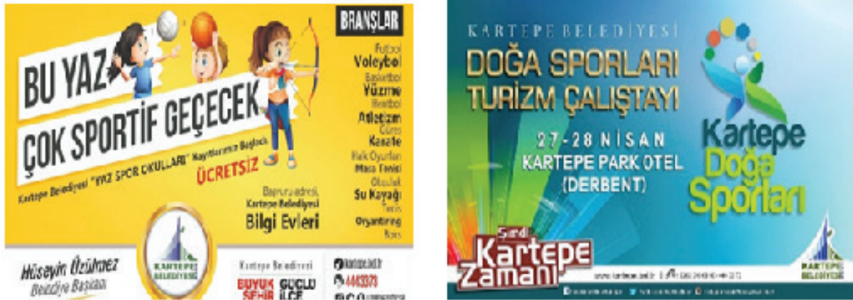
Foto 2. Etkinlik Görselleri

Kartepeler Belediyesinin spor alanına yönelik düzenlediği organizasyonların yanında spor eğitimine yönelik spor okulları ve Kocaeli Üniversitesi işbirliğinde düzenlediği Doğa Sporları Çalıştayı spor temalı ilçe için katkı sağlayan çalışmalardır.