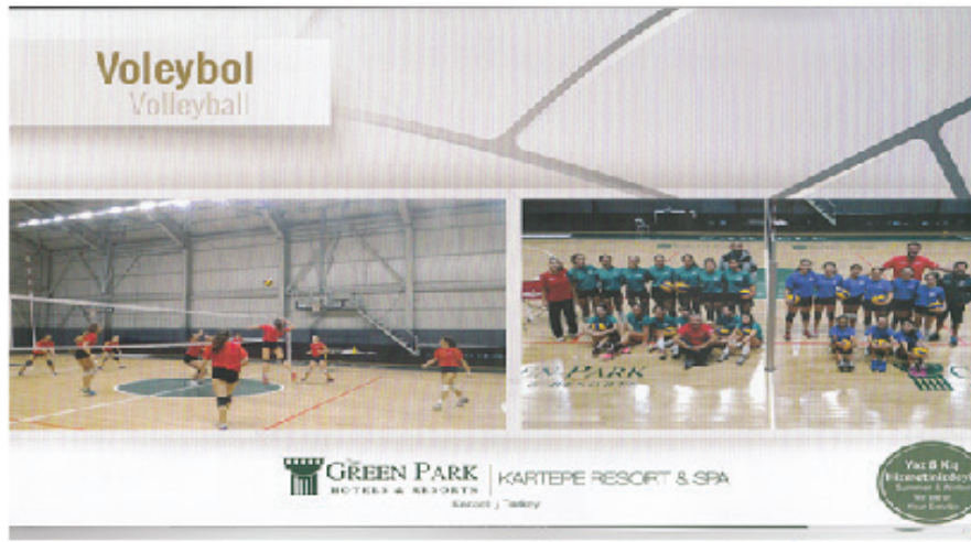
Foto 4. Özel İşletme Spor Hizmetleri

Kartepe İlçesinden bazı örnek spor etkinlikleri ve özel sektör tarafından sunulan hizmetlerin yanında Kartepe ilçesinde yer alan spor temalı ilçe planlamasına katkı sağlayacak olan diğer bir yön de spor tesisleridir. Kartepe ilçesinden birkaç örnek spor tesisi aşağıda sunulmuştur.