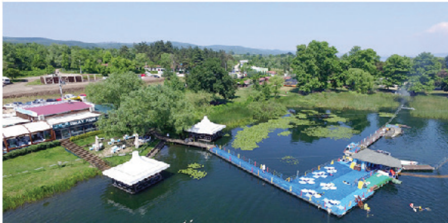
Foto 5. Su Kayağı Tesisleri - Kartepe

Kartepe İlçesinden bazı örnek spor etkinlikleri ve özel sektör tarafından sunulan hizmetlerin yanında Kartepe ilçesinde yer alan spor temalı ilçe planlamasına katkı sağlayacak olan diğer bir yön de spor tesisleridir. Kartepe ilçesinden birkaç örnek spor tesisi aşağıda sunulmuştur.