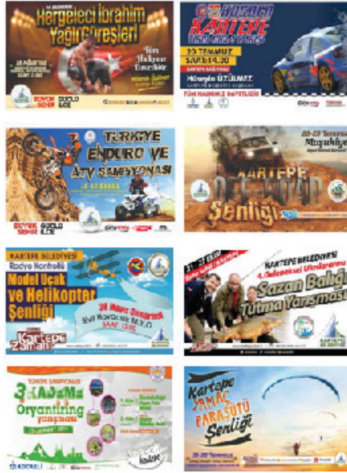
Foto 1. Etkinlik Görselleri

Kartepeler Belediyesinin spor alanına yönelik düzenlediği organizasyonların yanında spor eğitimine yönelik spor okulları ve Kocaeli Üniversitesi işbirliğinde düzenlediği Doğa Sporları Çalıştayı spor temalı ilçe için katkı sağlayan çalışmalardır.