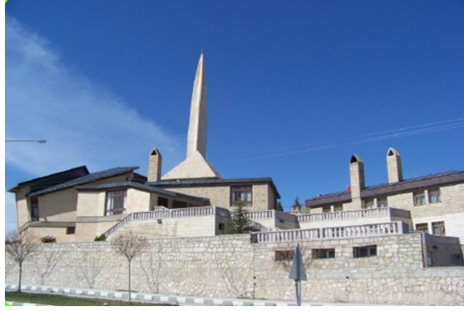
Resim 8: Abdurrahman-ı Erzincanî Camii