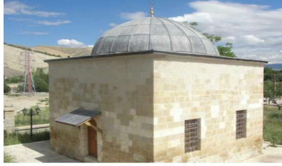
Resim 1: Sadrazam Mehmed Paşa Kütüphanesi'nin restore edilmiş hali

H. 1192/ m. 1778 tarihinde inşa edilen ve hala ayakta olan kütüphane binasının kuzeye bakan duvarı üzerinde dört satırlık bir kitabe bulunmaktadır. Kitabenin son satırı ebce hesabı ile yapılaş tarihini göstermektedir (Akgündüz, Öztürk ve Baş, 2002: 487). Bu kitabede, Mermer üzerine, kabartma bir baklava motifle birbirinden ayrılmış iki friz halinde şu ifade yer almaktadır (Soysal, 1999: 218).