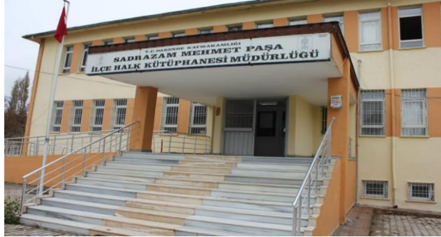
Resim 2: 1990 yılında yapılan Sadrazam Mehmet Paşa Kütüphanesi

Es-Seyyid Osman Hulûsi Efendi, zamanın Kültür ve Turizm Bakanı Sayın Mükerrerem Taşcıoğlu'ndan aldığı vaat üzerine, ata yadigârı yerin aslına rücu etmesi ve etrafındaki tarihi eserlerin korunmasına dikkat ederek kütüphane ve kültür sitesi yaptırmak şartıyla, Kültür ve Turizm Bakanlığına bağışlanmıştır. Bakanlık bunun üzerine 1990 yılında eski tarihi kütüphanenin hemen yanına yeni ve modern bir kütüphane binası yaptırmıştır (Gülseren, 1994: 27). Kütüphane de 2310 adet kayıtlı kitap, 102 adet süreli yayın mevcuttur.