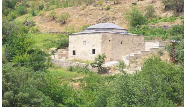
Resim 3: Hâfız Mustafa Paşa Kütüphanesi'nin restore edilmiş hali