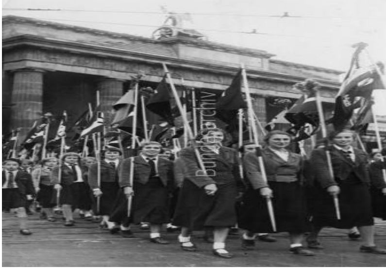
Resim 3: Bund Deutscher Mädel örgütüne mesup kızların “Gençlik Günü” kutlamalarında Berlin Brandenburg Kapısı’ndan şehre girişi, 1934.

Hitler, entelektüel açıdan çocuk ile erkek arasında bir yere konumlandığı kadını, toplumsal rolü bakımından kocasının yanında yer alan bir eş, anne ve yoldaş olarak görmekteydi. Ona göre kadınlar, hemşirelik ya da eğitimcilik gibi kadın doğasına uygun mesleklere yönelmeliydi; erkeğin görevi “büyük dünyada” onu bekleyen “zorlukları”, “güçlü ve kararlı” bir şekilde aşım tüm “gücünü” devleti ve ulusu için kullanmaktı; kadının görevi ise kendi “küçük dünyasında”, tüm zihinsel ve ruhsal gücünü kocası, çocukları ve evi için seferber etmektir (Domarus, 1973: 450-451). Kadınlara daha fazla hak ve özgürlük talep eden yaklaşımları bir “Yahudi” icadı 11 olarak değerlendiren Hitler, 8 Eylül 1934 tarihinde Nürnberg’de düzenlenen parti mitingindeki konuşmasında kendisini dinleyen kadınlardan nasıl bir beklenti içerisinde olduğunu şu sözlerle bildirmişti: