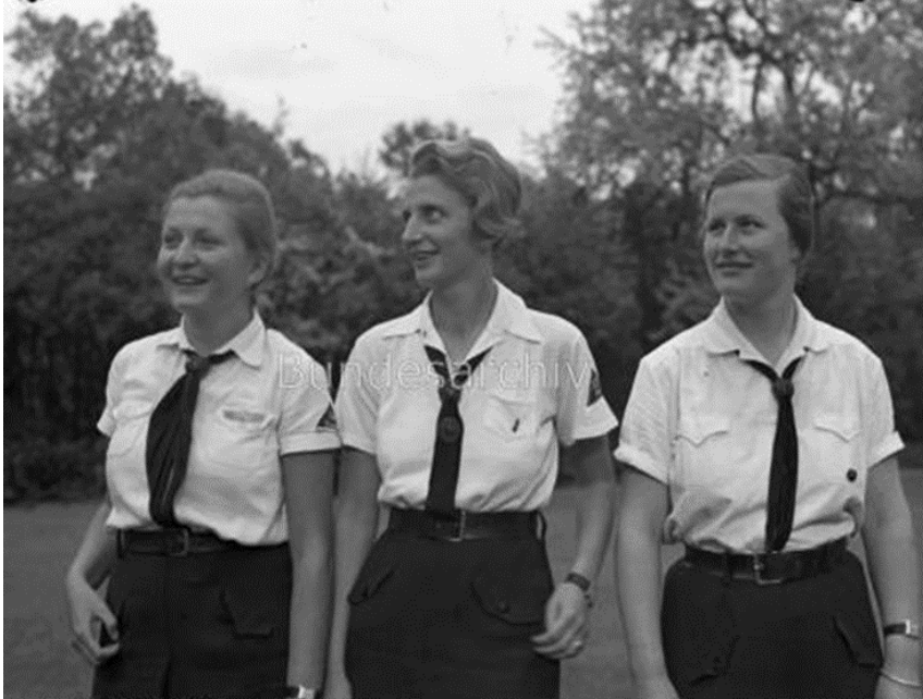
Resim 2: Potsdam Bund Deutscher Mädel örgütündeki kızlara ait bir kare, Mayıs 1935.