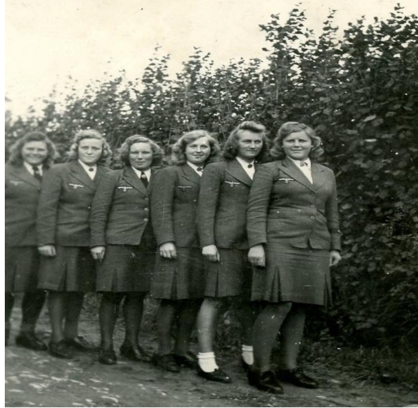
Resim 15: Blitzmädel gurbunu resmeden 1943 yılına ait bir fotoğraf.