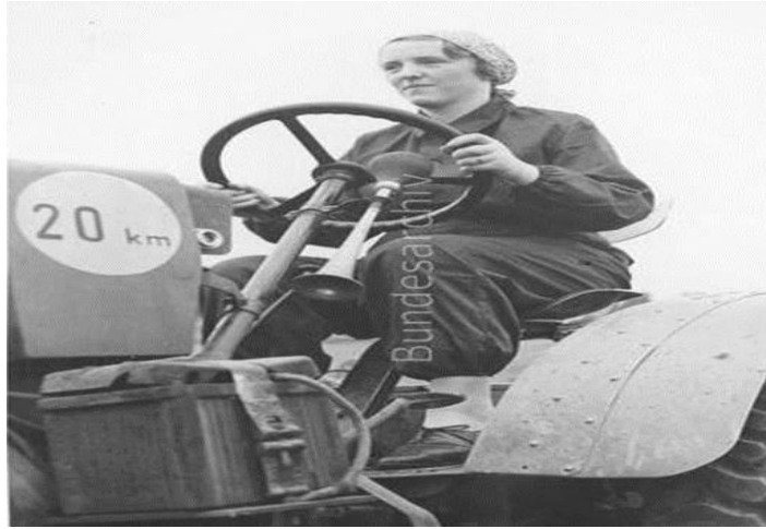
Resim7: Kadınlar için yeni meslek gruplarından olan traktör-sürücülüğü, 13 Eylül 1939 (Bundesarchiv, Bild 183-E10780).

Yukarıda belirtildiği üzere 1920'li yıllardaki ekonomik buhran, kadın istihdamının artmasına neden olmuştu fakat evli kadınların evleri dışında bir işte çalışmaları toplum tarafından hoş karşılanılmamaktaydı (Steinbacher, 2008: 106). Bu sebeple Nasyonal-sosyalistlerin, daha fazla erkeği istihdam etmek için kadınları emek piyasasından uzak tutma politikası, toplum tarafından kabul görmekteydi. Ancak zamanla ideolojik tasarım ile ekonomik gerçeklik arasındaki makas iyice açıldı ve ekonomi alanındaki kalkınmayla iş hayatında yer alan kadınların sayısı da arttı. Nitekim 1932 yılı verilerine göre Almanya'da çalışan kadın sayısı 4,6 milyon iken 1933 yılında bu rakam 4,7 milyona; 1934 yılında ise 5,5 milyona ulaşmıştır. Özellikle 1938'de başlayan Silahlanma Konjonktürü (Rüstungskonjonktur) ile birlikte işgücüne duyulan ihtiyaç artmıştır. 20 Devlet bu ihtiyacı karşılayabilmek için 1938 yılındaki Dört Yıllık Kalkınma Planı çerçevesinde kadınlara bir yıl mecburi çalışma zorunluluğu getirdi (Bauer, 2008: 280-281). Bu uygulamaya göre 25 yaşın altındaki bekâr kadınlar, bir yıl boyunca iş bulma kurumunun belirlediği tarım veya hizmet sektöründe çalışmalıydılar. Bu gelişme, aynı zamanda kadınların iş hayatından ayrılmalarını ve ailelerine yönelmelerini kolaylaştıracak yasal düzenlemeleri de boşa çıkarmaktaydı (Thamer, 2002: 261-262).