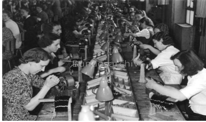
Resim 11: Silah fabrikasında şarjör dolduran kadınlar, 1940 yılı.