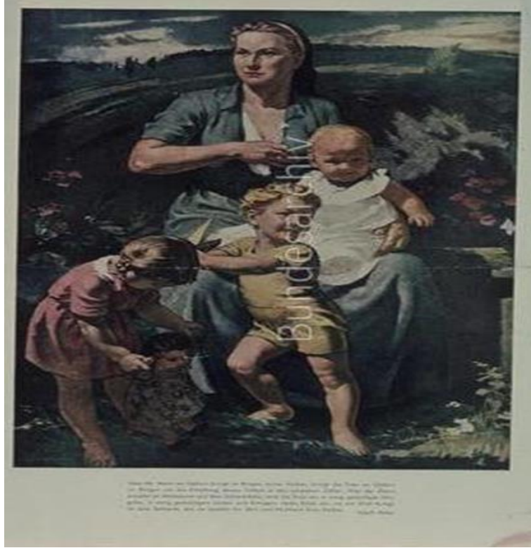
Resim 1: NSDAP'nin bastırıldığı ve altına Hitler'in anneliği öven sözlerini kaydettiği, Nazi ideolojisinin kadın profilini resmeden bir afiş, 1934 yılı.