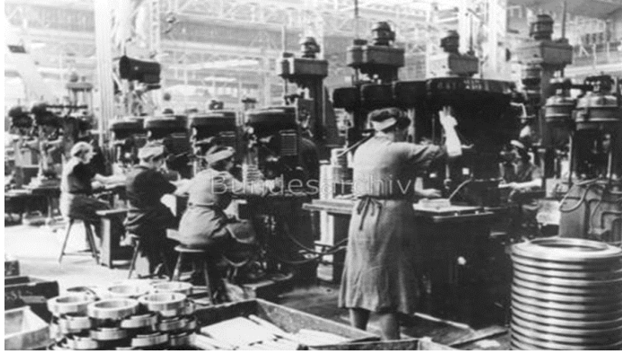
Resim 9: Tank üretiminde çelik matkaplarla çalışan Alman kadın işçileri, 24 Ekim 1942.

bir at ile bir beygir arasında farka dikkat çekerek cins bir atın pulluğa koşulmaması gerektiğini belirten Hermann Göring de Hitler'e destek vermiştir.