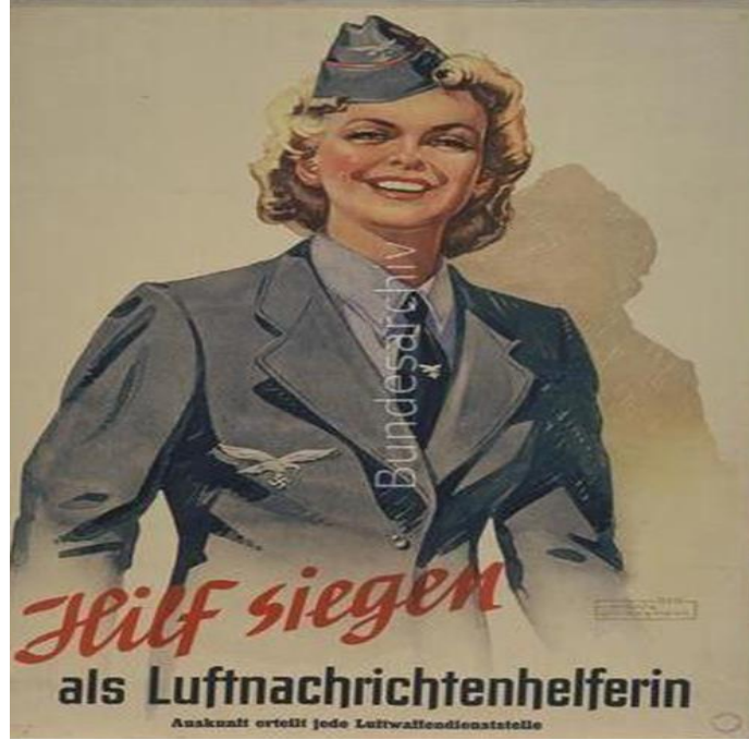
Resim 13: Hitler yönetiminin Hava Kuvvetleri'ne kadın yardımcı istihdam edebilmek için bastırıldığı 1943 yılına ait bir afiş.