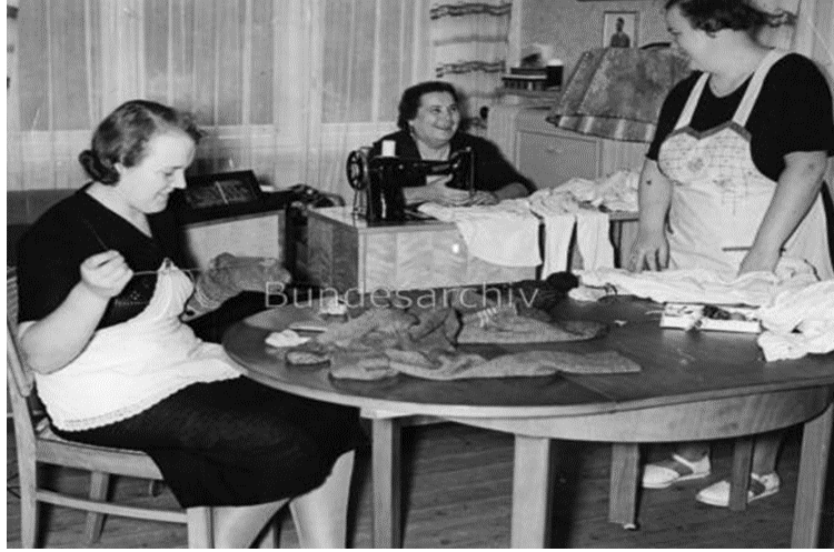
Resim 8: Askerlerin çamaşırlarını temizleyip tamir eden Grunewald Bölgesi Frauenschaft derneğine mensup kadınlar, 10 Kasım 1939.

Savaşla birlikte çalışan kadınların sayısında büyük düşüşler yaşanarak 1942 yılındaki sayı, savaş öncesi seviyesine düştü. Bunun nedeni, savaşan askerlerin ailelerine devlet tarafından destek verilmesi, özellikle savaş esirlerinin ve Alman işgali altındaki ülkelerden getirilen sivillerin çalıştırılmasıydı (Thamer, 2002: 262). Fakat sayıları milyonlara varan bu yabancı işçilere rağmen Almanya iş gücü sıkıntısı yaşamaktaydı (Steinbacher, 2008: 112). 21 Savaşın şiddetlenmesi ile birlikte bu politikadan vazgeçen Nazi hükümeti, kadınların devletleri için seferber olmalarını kararlaştırdı. 22 Silahlanma Bakanı Albert Speer gibi Nazi rejiminin üst yetkilileri 1943 yılına kadar işçi ihtiyacını gidermek için 5,5 milyon “işsiz” kadının daha seferber edilmesini talep etti (Siegel, 1989: 170). Ancak Hitler, savaşın aile kurumunu daha çok müşkül duruma düşürmesini, halkın direncinin zayıflamasını ve ikinci bir Kasım devrimi tehlikesini önlemek adına bu talebi geri çevirdi. Çünkü Hitler, I. Dünya Savaşı’ndan edindiği tecrübeye binaen kadınların iş yükünün artmasının halkta savaş yorgunluğuna sebep olduğunu biliyordu (Winkler, 1977: 118; Gersdorff, 1969: 358-360; Stephenson, 1981: 555-571). Kaldı ki kadınların savaşa bu şekilde angaje edilmelerinin aynı zamanda kendi meşruiyetini de tehlikeye atacağından korkmaktaydı (Kuczynski, 1965: 253-255; Schupetta, 1981: 292-317). Cins