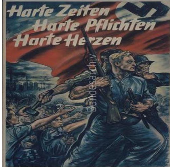
Resim 14: Hitler yönetiminin kadınları iş hayatında mobilize etmek için bastırıldığı “Çetin Zamanlar, Çetin Görevler, Çetin Kalpler” başlıklı 1943 yılına ait bir afiş.