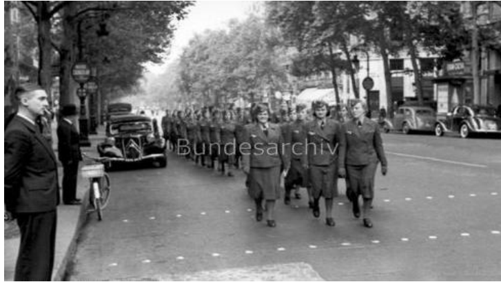
Resim 12: Fransa'nın işgaliyle birlikte Alman askerlerine destek olmaları için gönderilen kadın istihbarat asistanlarının Paris sokaklarından geçişi, Ağustos 1940.

Nazi hükümeti, her ne kadar kadınları fiili savaştan uzak tutmaya çalışsa da savaşın uzamasıyla kadınların gücünden de istifade etmek zorunda kalmıştır. 1941 yazında Alman ordusunun Sovyetler Birliği'ne saldırmasıyla birlikte cephedeki Alman askerlerine yardım etmeleri için seferber edilen kadınlar, ilk etapta mermi taşımak, siper için hendek kazmak gibi işlerde kullanılmıştır. Bilhassa Temmuz 1943'ten sonra savaşın şiddetlenmesiyle birlikte ateşli silahlar eğitimine tabi tutulan kadınların uçaksavar kullanmalarına bile izin verilmiş; Temmuz 1944'te çıkarılan Mutlak Savaşla İlgili Kararname ( Erläss über den totalen Kriegseinsatz ) ile birlikte de 100 bin kadın, hava