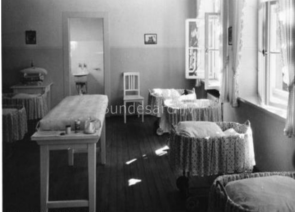
Resim 5: Lebensborn kurumundaki yeni doğan ünitesine ait bir kare,1936 yılı.