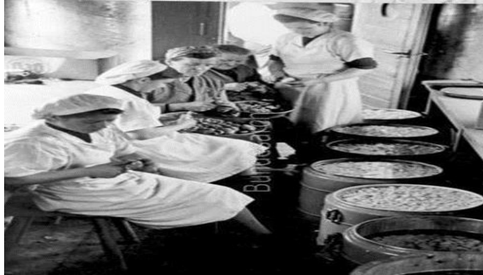
Resim 10: Askerlere hazırlanan kumanya için patates doğrayan kadınlar, Kasım 1945.

Göring, “kültürün taşıyıcı” olarak ilan ettiği ve “yüksek derece kaliteli kültürel ve genetik materyal” taşıyan Alman kadınlarının “aptal ve sıradan kadınların arsızca konuşmalarından” uzak tutulması gerektiğini savunuyordu. Göring’in sosyal-Darwinist bir jargonla ifade ettiği bu bakış açısı, emekçi kadınlara dışlayan elitist bir tutumun dışavurumuydu ve “işçinin onurunu” gözeten ya da toplumsal sınıfları ortadan kaldırarak bütünlükçü bir toplum oluşturmayı hedefleyen Nazi ideolojisinin tutarsızlığının da bir göstergesiydi (Wendt, 2000: 66-67). Böylece zaten çalışmakta olan alt sınıfa mensup kadınlara rağmen burjuvaya sınıfına ait kadınların çalışmasına engel olundu (Thamer, 2002: 261).