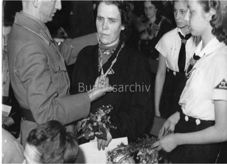
Resim 4: Alman Annesinin Onur Haçı adlı ödül töreninden bir kare, 17 Mayıs 1943.

Propaganda Bakanı Goebbels’in şu sözleri de yine aynı mantalitenin ürünüydü: “Kadınlar için en öncelikli, en iyi ve uygun yer, aile içindeki yeridir ve yapacağı en mükemmel iş de ulusuna çocuk hediye etmektir” (Wienecke-Janzen 2008, 50). Kısacası Nasyonal-sosyalist dünya görüşüne göre Alman kadını, halk bilincine sahip; ırkına, ulusuna ve rejimine koşulsuzca bağlı olmalı ve ulusunun emrindeki bir nefer olarak “Cermen kanının koruyucusu” rolüne bürünmeliydi (Thamer, 2002: 260). Çünkü tarihsel süreç içerisinde Alman nüfusu azalmaktaydı; özellikle de Weimar dönemindeki ekonomik buhran, kadınların çalışma hayatında daha çok yer almalarına ve böylece doğum oranlarının düşmesine neden olmuştu. Bu gidişatı önlemek ve aile kurumunu teşvik etmek için fedakâr, müşfik ve diğergam anne kültürünü kesintisiz bir biçimde telkin eden Nazi devleti, Amerika’dan örnek alınan ve 1922 yılından itibaren de Almanya’da uygulanmaya başlanan Anneler Günü’nü araçsallaştırarak 1934 yılından itibaren düzenlenen şölenlerin ayrılmaz bir parçası haline getirmişti.