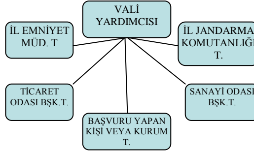
Şekil 3: Özel Güvenlik Komisyonu Şeması

Özel güvenlik hizmetini gerçekleştiren şirket veya kişilerin görevleri genel olarak yetkilerinden de anlaşılacağı üzere önleyici görevlerdir. Bu önleyici görevleri yerine getirirken görev sürelerinde ve alanları içerisinde gerçekleşen suç ve suç unsurları ile karşılaştıkları takdirde, yapmaları gereken görev ve süresi genel kolluk görevlilerinin gelmesi ile son bulacaktır. Bu hususlar ÖGHDK'un 9. maddesinde ve ÖGHDKUIY madde 16'da düzenlenmiştir. Özel güvenlik görevlisi zor kullanma ve yakalama yetkilerinin kullanılmasını gerektiren olayları en seri vasıta ile yetkili genel kolluğa bildirmelidir. Yakalanan kişi ve zapt edilen eşya genel kolluğa teslim edilmeli ve genel kolluğun olaya el koymasından itibaren araştırma ve delil toplama faaliyetine genel kolluğun talebi halinde yardımcı olunmalıdır.