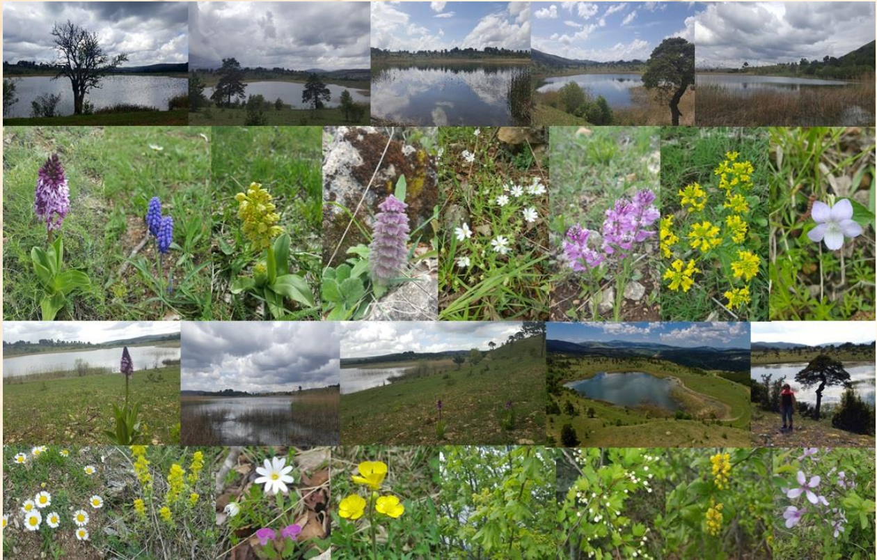
Şekil 3. Çiğ Gölü Sulak Alanı ve çevresinin genel görünümü

Çiğ Gölü deniz seviyesinden 1562 m yükseltide bulunmaktadır. Suyu tatlı olan gölün yüzeyden bir geleğeni ve gideğeni yoktur (Şekil 3). Sığ göl özelliği taşıyan gölün maksimum derinliği 7 m civarındadır. Kıyı bölgesi yoğun su bitkileri ile çevrili olan gölün sulak alanında en yoğun hidrofit topluluğunu kamışlar ( Phragmites australis (Cav.) Steud.) oluşturur. Schoenoplectus lacustris (L.) Palla, Persicaria amphibia (L.) Delarbre, (Syn. Polygonum amphibium (L.)) gibi submers su bitkileri de göl kıyısında yaygındır. Gölde balık olarak Cyprinus carpio L. (sazan) yaşamaktadır. Çiğ Gölü sulak alanının doğu yamaçları Doğu Karadeniz göknarı ( Abies nordmanniana Stev.) ve doğu kayını ( Fagus orientalis Lipsky.) karışık ormanları ile çevrilidir. Göl Orta Karadeniz kuş göç yolu üzerinde bulunduğundan birçok göçmen kuşa ev sahipliği yapmaktadır. Sucul flora ve fauna için göl ve sulak alan çok önemli bir habitat oluştururken, yaban hayvanları da su ihtiyaçlarını gölden gidermektedir (Karakaya, 2018). Gölün çevresi de bitki biyoçeşitliliği açısından oldukça zengindir (Şekil 3).