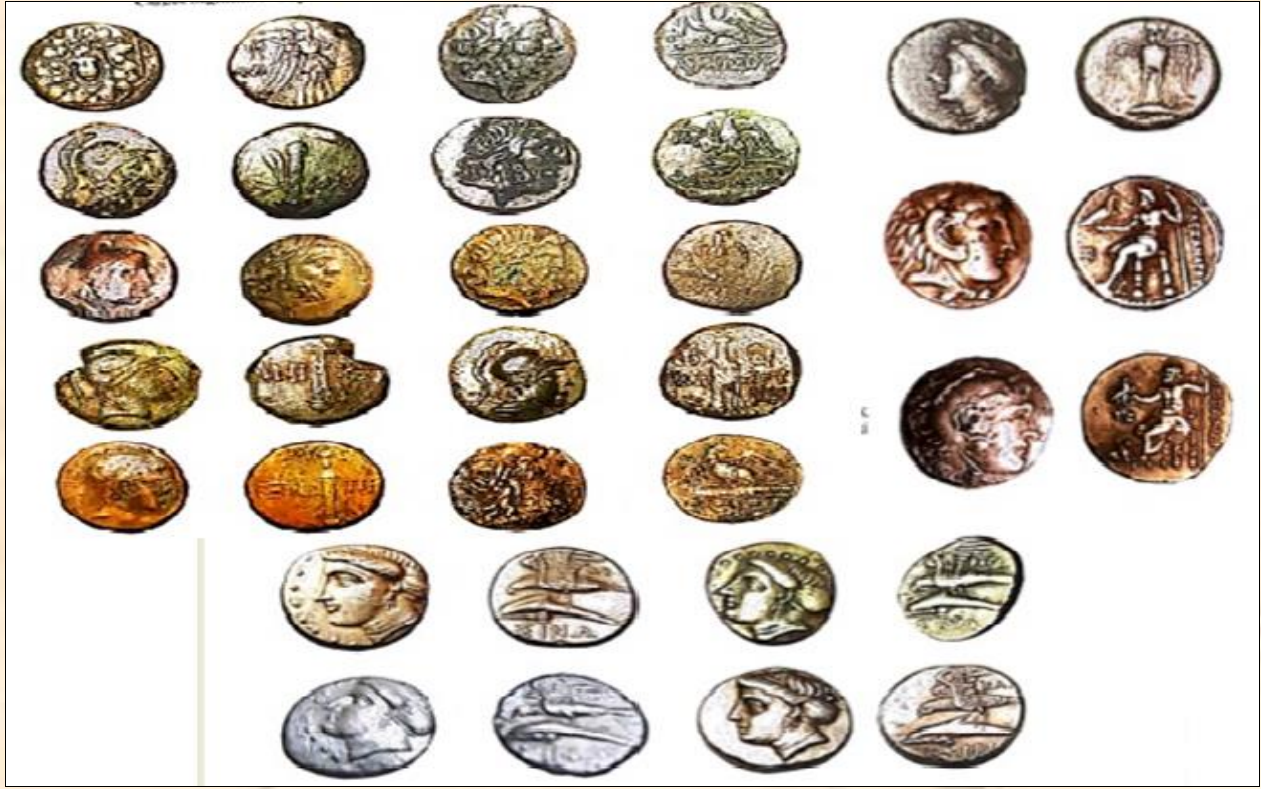
Şekil 1. Çiğ Gölü'nde bulunan bazı sikke örnekleri (Karaduman, 2015).