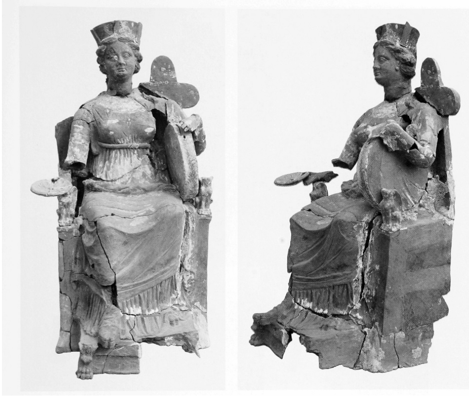
Resim 2. Kybele (Romano 1995, Plate 15).

başta gelen kentlerle yarışır durumdadır ve Rhodos, Massalia ve antik Karthago tarzında düzenlenmiştir" (Strabon XII: 8).