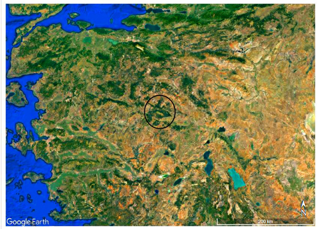
Harita 1. Batı Anadolu ve Murat Dağı (Google Earth kullanılarak oluşturuldu).

Murat Dağı, Ege bölgesinin İçbatı Anadolu bölümünde, Kütahya ile Uşak illeri arasında bulunmaktadır. Dağın kuzeyinde Kütahya ilinin Gediz ve Altıntaş ilçeleri yer almakta, güneyinde ise Uşak ili ve Banaz ilçesi bulunmaktadır. Dağın yüksekliği 2309 metredir. Bu yüksekliği ile Ege bölgesinin en yüksek dağları arasındadır. Murat Dağı kuzeybatı- güneydoğu uzantılı olup üzerinde Kartaltepe (2309 m.), Kırkpınar tepe (2218 m.), Tınaz tepe (2097 m.), Çatmalı Mezar tepe (1990 m.), Kazık Batmaz tepe (1857 m.) gibi tepeler yer almaktadır (Özav 1995: 61). Genel olarak dağın yapısı şist, kalker ve serpantinden oluşan paleozoik araziden oluşmaktadır (Yalçınlar 1955: 58-59). Oldukça engebeli bir yapıda olan bu dağın üzerinde yaylalar da bulunmaktadır (Harita 1-2).