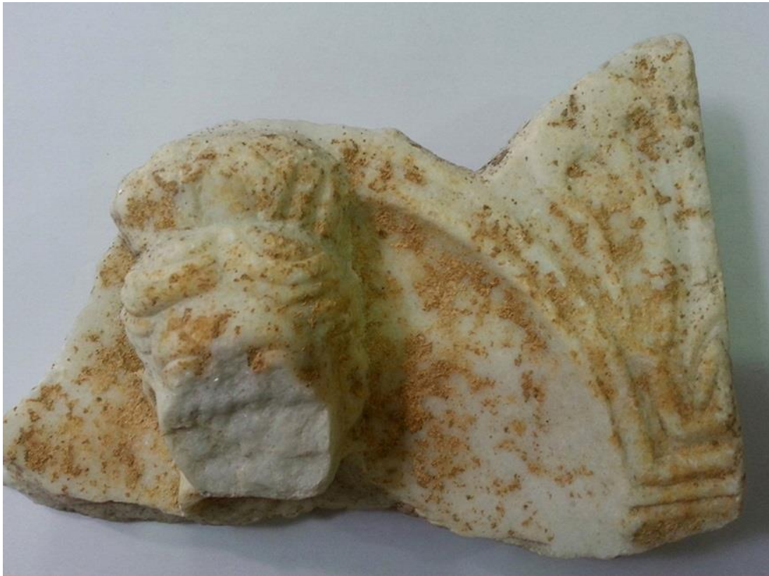
Resim 1. Tanrıça steli (Oy 2017a).