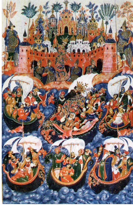
Resim 14. İ.İ. Golikov, Çar Saltan'ın Filosu, 1933, Paleh Devlet Sanat Müzesi