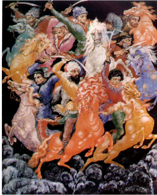
Resim 17. İ.İ. Golikov, Partizanlar, 1935, Paleh Devlet Sanat Müzesi, Levha üzerine vernikli minyatür