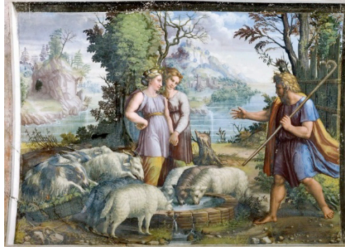
Resim 6. Raffaello, Yakup ve Rahel'in Buluşması, 1519, Vatikan Müzesi