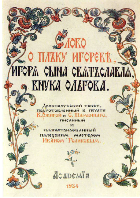
Resim 16. İ.İ. Golikov, İgor Destanı, 1934, Tretyakov Galerisi