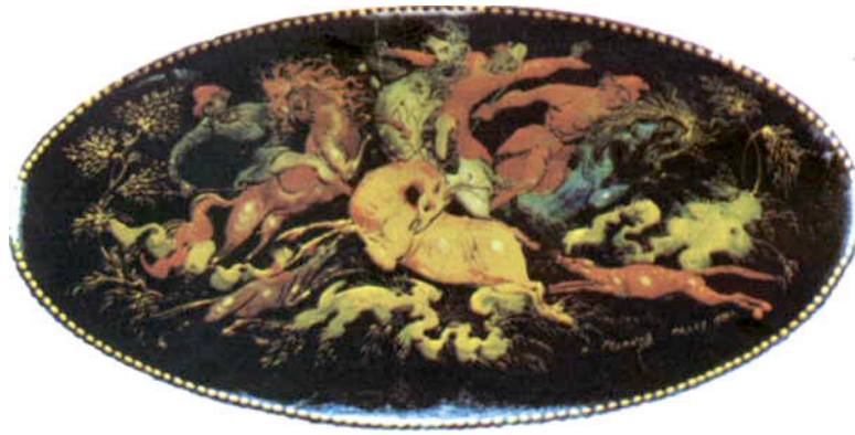
Resim 10. İ.İ. Golikov, Geyik Avı, 1924, y.y., Broş üzerine vernikli minyatür