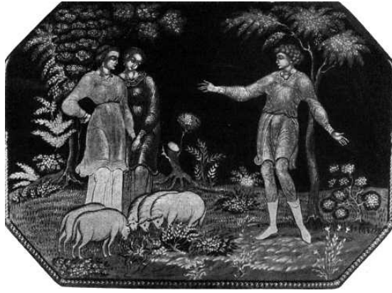
Resim 7. İ.İ. Golikov, Buluşma, 1924, Rus Devlet Müzesi, Kutu üzerine vernikli minyatür