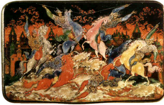
Resim 9. İ.İ. Golikov, Savaş, 1924, Paleh Devlet Sanat Müzesi, Sigara kutusu üzerine vernikli minyatür