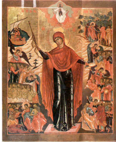
Resim 2. Acı Çekenlerin Tesellisi, 18.yüzyılın sonu, Paleh Devlet Sanat Müzesi