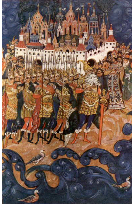
Resim 13. İ.İ. Golikov, Otuz Üç Bahadır, 1933, Paleh Devlet Sanat Müzesi