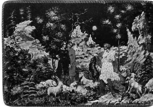
Resim 8. İ.İ. Golikov, Buluşma, 1926, Rus Devlet Müzesi, Kutu üzerine vernikli minyatür