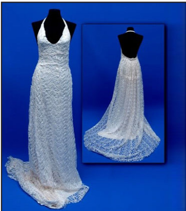
Resim 13. Özgü'nün gelinlik tasarımı

Yine aynı alt tema ile tasarımını ilişkilendiren öğrencilerden Nurgül, “Osmanlı zamanında kabarık gelinlik kullanılmıştı. Kollar da kabarık idi. Renk beyaz değildi. Osmanlı kültüründeki kıyafetlerden esinlenerek gelinliğin eteğini ve omuzlardaki kol kalıbını kabarttım” demektedir (Resim 12).