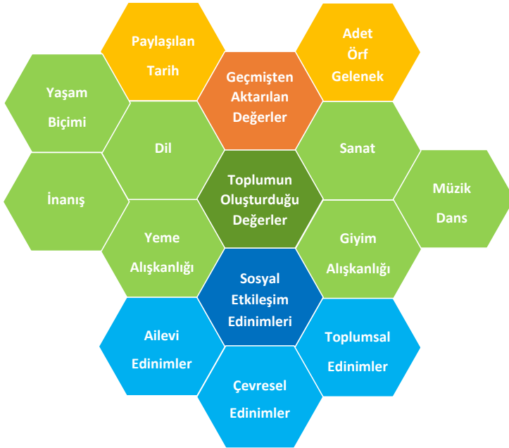
Şekil 1. Öğrencilerin kültür kavramına ilişkin görüşleri

Öğrencilerin kültür kavramını algılama biçimlerini anlamak amacı ile ‘Kültür kavramı sizin için ne ifade etmektedir?’ sorusu ile görüşlerini belirtmeleri istenmiştir. Öğrencilerin kültür kavramına ilişkin görüşleri Şekil 1’de gösterilmiştir. Şekil üzerinde üç ana tema şeklin ortasındaki koyu renkli beşgenler ile vurgulanmış ve bu ana temaları besleyen ve birbiri ile ilişkili olan alt temalar ise ana temaların açık tonu olan renklerle vurgulanmıştır. Kültür algısına ilişkin temaların kesin ayrımlar ile temalaştırılması yerine birbiri ile ilişkili bir biçimde temalaştırılması kavramsal kültür algısının daha iyi anlaşılması amacıyla hizmet etmektedir.