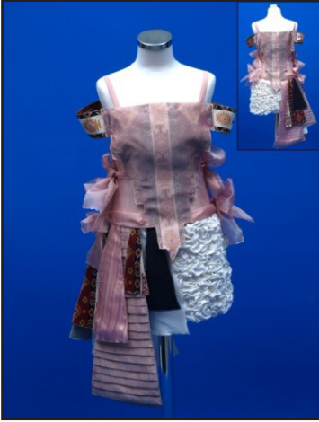
Resim 9. Vasfiye'nin gelinlik tasarımı

Kullandığım göçebe kültürüne ait kültürel temanın giyim özelliklerini çıkış noktası olarak