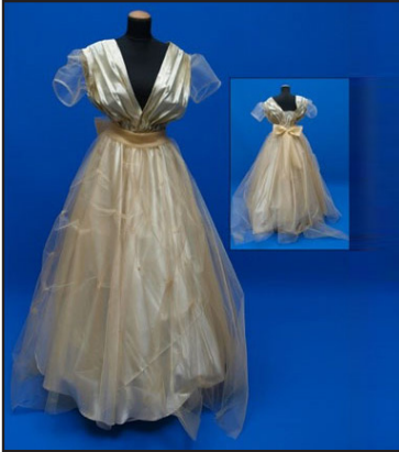
Resim 12. Nurgül'ün gelinlik tasarımı