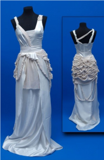
Resim 2. Jülide’nin gelinlik tasarımı

Şekil 3’te öğrencilerin kültürel algılarını tasarımlarına yansıtmaya biçimleri ana temasına dayalı alt temaları “Kültürel değerleri hatırlama”, “Kültürel değerleri yeniden yorumlama”, “Anadolu kültürüne dayalı yorumlama”, “Osmanlı kültürüne ait öğeleri yorumlama”, “Farklı kültürlerle dayalı yorumlama”, “Modern kültür öğelerini yorumlama”, “Kültürel farklılıkları organize ederek yorumlama” ve “Sosyo-kültürel yansımaları yorumlama” alt temaları ve alt temalara ilişkin boyutlar görülmektedir.