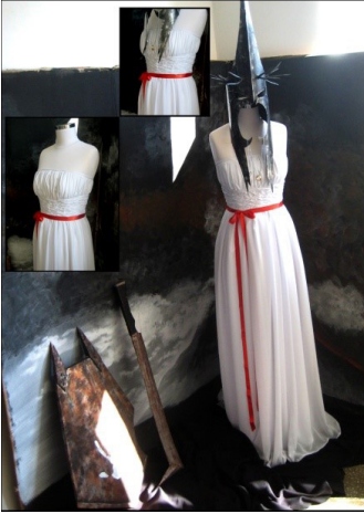
Resim 4. Jurata'nın gelinlik tasarımı

farkında olmadığım kültürel etkileri uyguladım. Kurgulamadığım tasarımları kurguladım. Bu tasarım, eski kültürel ve estetik değerleri tekrar inceleyip yeni çıkarımlar yapmamı sağladı (Resim 2).