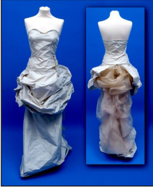
Resim 15. Elvin'in gelinlik tasarımı