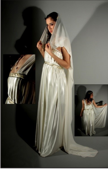
Resim 14. Özüm'ün gelinlik tasarımı