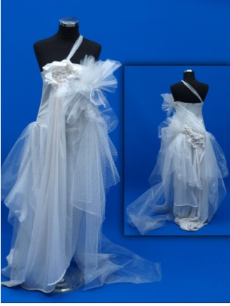
Resim 3. Ceren'in gelinlik tasarımı