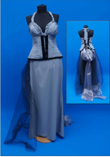
Resim 1. Görkem'in gelinlik tasarımı

aile ve çevresel etmenlerin önemine vurgu yapmaktadır.