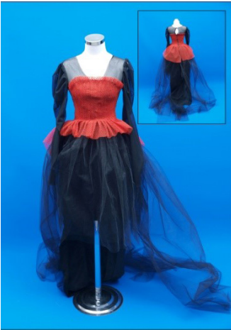
Resim 6. Aylin'in gelinlik tasarımı

kullanmaya karar verdim ve bu şekilde oluşturduğum dokuyu öne çıkardım. Tasarım sürecinde kültürün kaynak olarak kullanılması yeni fikirler vermekte ve ilham kaynağı olarak kullanılmaktadır. Kültürden bir ayrıntıyı tasarımımıza uyarlamak oldukça ilginç bir deneyimdi. Çünkü bu yaklaşım tasarımınıza yeni bir bakış açısı kazandırmanızı ve daha yaratıcı olmanızı sağlıyor (Resim 5).