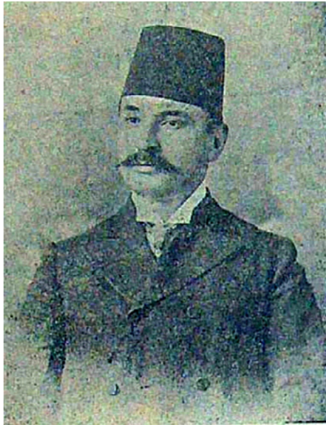
دوقتور ميلاسلى اسماعيل حقي بك

İsmail Hakkı, 1880’de Muđla’nın Milas ilçesinde doğmuştur. 1 Darülfünun Tıp Fakültesi Mülkiye kısmından 324 diploma numarası ile mezun olmuştur. 2 Belediye ve Hükümet Tabipliđi görevlerinin ardından sağlık hizmetlerinde çok önemli görevler üstlenmiştir. 3 Beyrut Vilayeti Sıhhiye Müfettişliđi, Şam Tıbbiye Mektebi Müdürlüğü, Hıfzıssıhha-i Umumi Müfettiş-i Umumiliđi, Sıhhiye Müdüriyet-i Umumiyesi Müfettiş-i Umumiliđi, Batı Anadolu Sağlık Müfettişliđi gibi görevleri yürüttüğüne ilişkin bilgilere Osmanlı Arşiv belgelerinde de rastlanmaktadır. 4-9