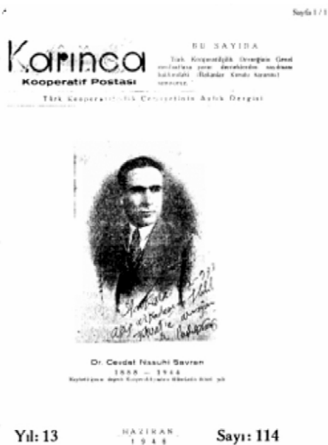
Resim 6. Karınca Dergisi