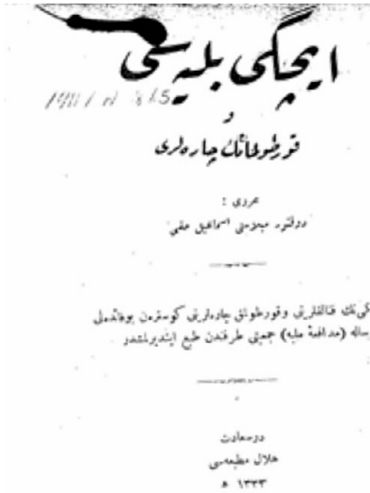
Resim 4. İçki Belası ve Kurtulmanın Çareleri

Oldukça kapsamlı yazılan risalede içkinin fizyolojik, patolojik ve sosyal etkilerine yer verilmiştir. İsmail Hakkı bu bilgileri somutlaştırmak için risalede beyin kalp, akciğer ve dışlere