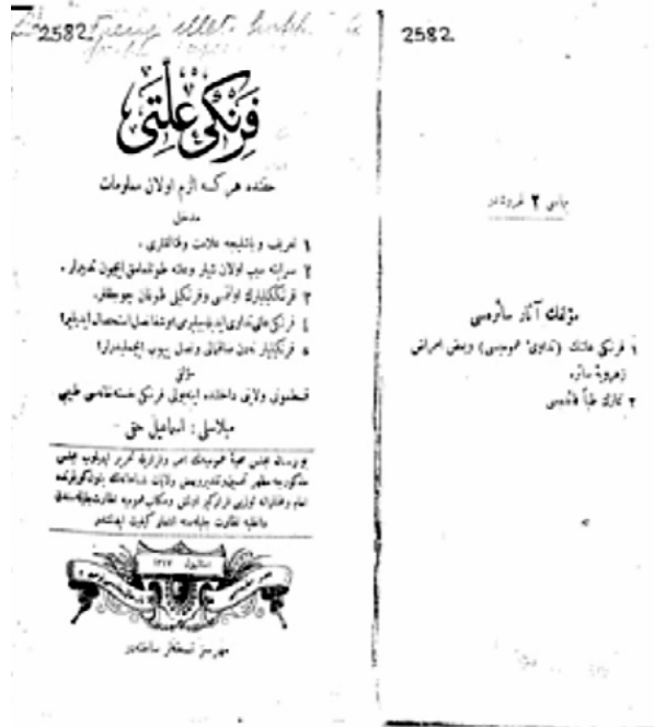
Resim 3. Frenji İletti Hakkında Elzem Olan Malumat