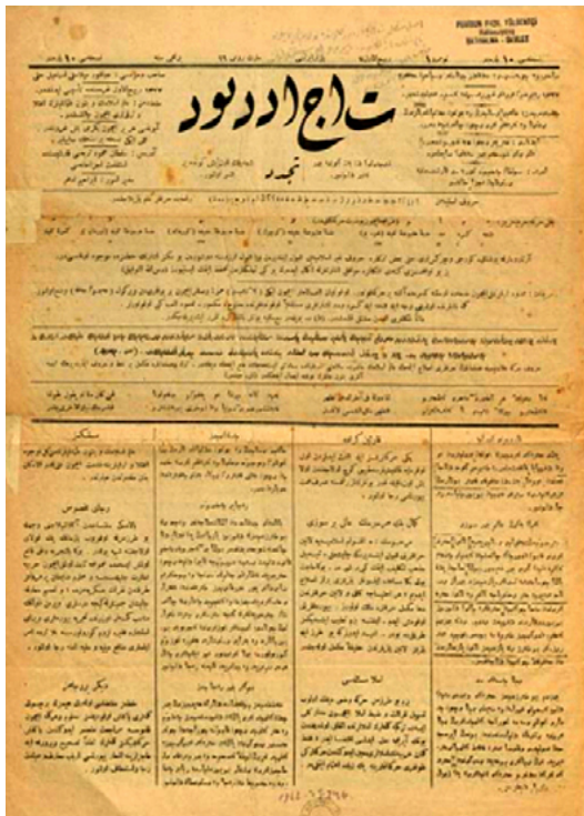
Resim 2. Teceddüt Gazetesi örneği

"Bu risale meclis Sıhhiyye-i Ummumiyyenin emri ve kararıyla tahrir edilüb Meclis-i Mezkûrca mazhar-ı tahsin ve takdir ve ba'zı vilayat-ı şahanenin bütün köylerinde imam ve muhtarane tüzüğü karar-gir olmuş ve mekteb-i ummumiyye nezaret-i celilesinden dahiliyye nazaret-i celilesine iş'ar-ı keyfiyyet idilmiştir."