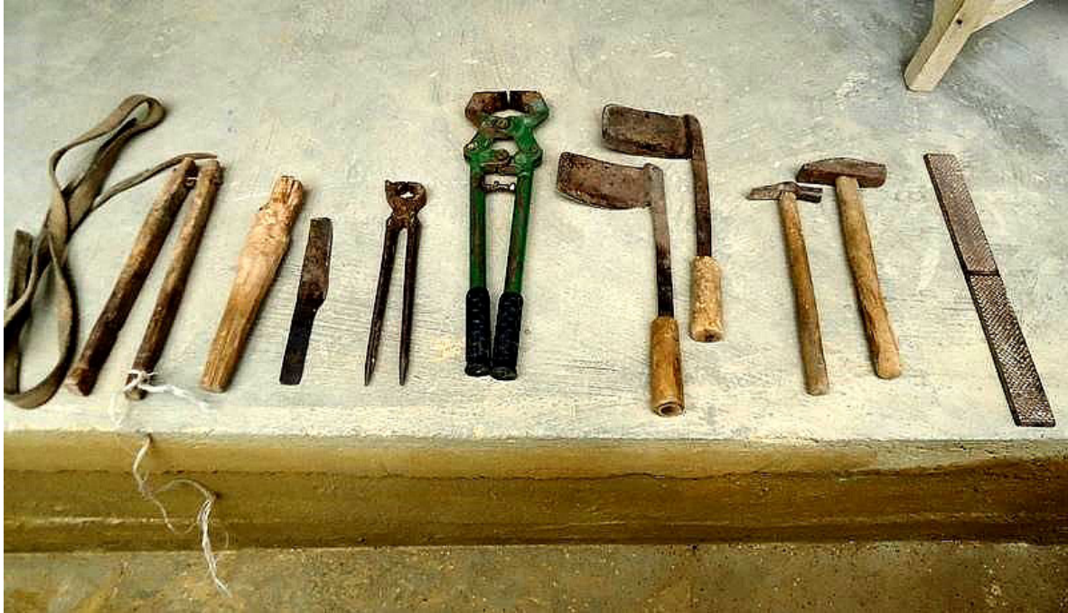
Resim 2. Soldan sağa: Ayak tutma ve bağlama ipi, Yavaşa, Tırnak kesme tokmağı, Tırnak kesme bıçağı, Çivi kerpeten, Tırnak kesme kerpeteni, Yonacıklar, Çekiçler, Tırnak törpüsü