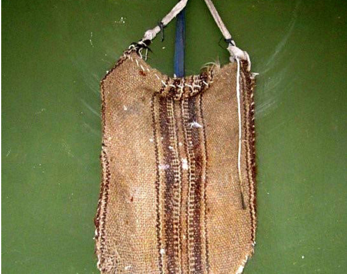
Resim 3. Inhalasyon tedavisinde kullanılan bez torba

“Soluğan”, “ince soluğan” olarak adlandırılır. Yaşlı atlarda ve koşum işlerinde kullanılan hayvanlarda görülür. Hayvanda derin solunum, inlemeli öksürük ve burundan iki taraflı mukus akıntısı vardır. At karnını döver, hırıltılı soluk alıp verir. (KK: 23, 183) Kaynatılmış buğday ya da arpa bir bez torbaya (Resim 3) konur ve atın kafasına bağlanmak suretiyle buharının solunması sağlanır. “Genzi” (üst solunum yolu) açılan hayvan iyileşir. (KK: 14, 181, 184-185)