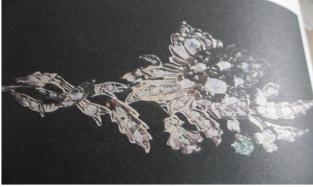
Çiçek şekilli mücevherlerle silmece kaplanmış bir hotoz iğnesi, İstanbul Beykoz’dan bir paşa kızına aittir.

Eski Osmanlı ‘baş hotozları’, çiçek şeklinde elmas iğnelerle süslenirdi. Osmanlı devrine ait çiçek takıları, genellikle sekiz ayar altındandır. Üzerleri elmas taşlarla süslenmiştir. Baş hareket ettikçe, hafif hafif titrerdi. Ayrıca, özel hazırlanan (yüksek taç gibi) ‘gelin hotozları’ vardı. Çiçek şekilli mücevherlerle silmece kaplanıp süslenirdi.