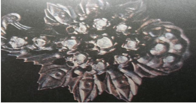
İncilerle ve mücevherlerle süslenmiş Ankara’ya ait gelin hotozu baş iğnesidir.