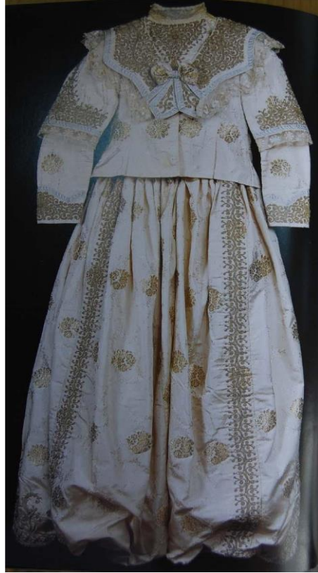
Şekil 2: Sarı Sim ve Kendinden Çiçek Desenli İpekli Kumaştan Yapılmış İki Parçalı Şalvarlı Gelinlik (Küçükerman, 1996: s.14)

İki parçadan oluşan altı belden lastikli şalvar gelinliktir. 19. Yüzyıl'a ait kemik rengi, yer yer sarı sim ve kendinden çiçek desenli ipekli kumaştan dikilmiştir. Üst ve şalvardan oluşmaktadır. Beden parçası, üstten yer yer sivri olarak dilimlenmiş geniş yakalı ve önden fiyonklu modelden oluşmaktadır. Yaka kenarları ve kol ağzlarında mavi ipek su taşı ile süslenmiştir. Göğsü kapatan jilenin üzerinde dik yaka bulunmaktadır. Beden vücuda oturtulmuştur. Arka açıklığı agrafarla kapanmaktadır. Uzun dar kolunun üzerine dirseğe kadar ve daha bol olan bir kol takılmıştır. Şalvarı, torba şalvar biçiminde bele uçkurlarla büzülerek oturtulmuştur. Paça ağzına işlemler yapılmıştır.