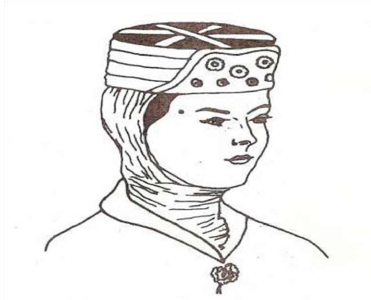
Şekil 5: XVII. Yüzyıl Kadın Başlığı Örnekleri (Sevüktekin, Onat, Eray, 1997:80)

XVI. Yüzyıla kadar baş süslemelerinin temel aracı festir. Kadın fesleri gümüş ve altınla işlenmiş ya da üzerine gümüş ve altın tepelikler takılarak süslenmiştir. Müslüman kadının günlük ev hayatında tepelikler ve inci elmasla bezenmiş, altın tellerle işlenmiş fesler kullanılmıştır. Saçlar; iki örgü örülen ve özel saç bağları ve ziynetlerle süslenmiş saçlar üzerine fes takılmış, sonra da krepler ve örtülerle süslemesi tamamlanmıştır. (Apak, Gündüz, ve Eray: 1997).