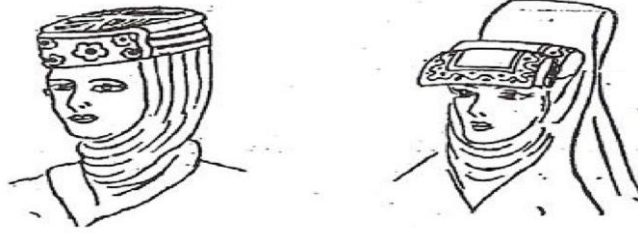
Şekil 6: XVI. Yüzyıl Kadın Başlıkları ( Kafadar, 1993: 258)

Osmanlı dönemi kadın başlıkları arasında en fazla dikkat çeken hotozlar, ev içinde kullanılan hotozlar sokağa çıkarken yaşmakla örtülerek bağlanmıştır. Ekonomik durumları iyi olan kadınlar çeşitli mücevherler kullanarak hotozlarını süslemişlerdir. Özel günlerde hotozların etrafı, zevk ve zenginlik derecesine göre çiçekler, değerli taşlar ve pırlantalı iğnelerle süslenerek, sırma ipekli çevrelerle (başörtüsü) olarak kullanılmıştır. (Apak: 1997) Mücevherler, kabak çiçekleri, mineli, incili iğneler hotozu başa oturtmada kullanılıyor, oyalalar ve dantellerle süslü hotozlar da kullanılmıştır” (Araz,1980).