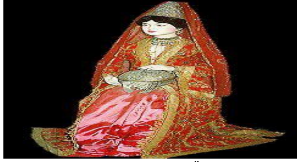
Şekil.10: 16.Yüzyıl Al Duvak Örneği