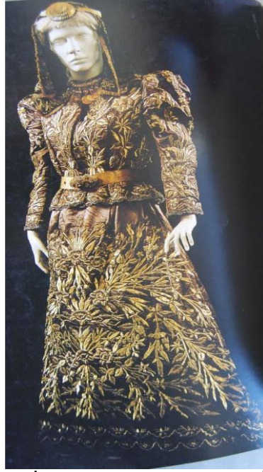
Şekil 3: 19. yüzyıl Sonunda İzmir’de Kullanılmış olan ‘İpek Atlas Gelin Kıyafeti’ (Küçükerman, 1996: 161)

açıklığında kullanılan üçgen şeklindeki ek parçalarla genişletilmiştir. Çok uzun olan entarilerin etekleri ön uçlarından beldeki kuşağa tutturularak kullanılmıştır. Entariler brokar gibi pahalı kumaşlardan yapılmış, üstleri değerli mücevherler, işlemeler ve değişik materyallerle süslenmiştir. (Apak, Gündüz ve Eray ,1997).