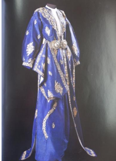
Şekil 1. Gelin Kıyafeti (Sadberk Hanım Müzesi 1989: s. 73)

15. yüzyılın başlarında üç etek ve dört etek denilen modeller gözde olmuştur. Üç etekler yanları yırtmaçlı, önü açık, belden birkaç adet düğmeli, boyu yere kadar entarilerdir. Üç etek 1875'lere kadar etkili olmuş ve kırsal kesimlerde 20. yüzyıla kadar kullanılmıştır. (Apak: 1997).