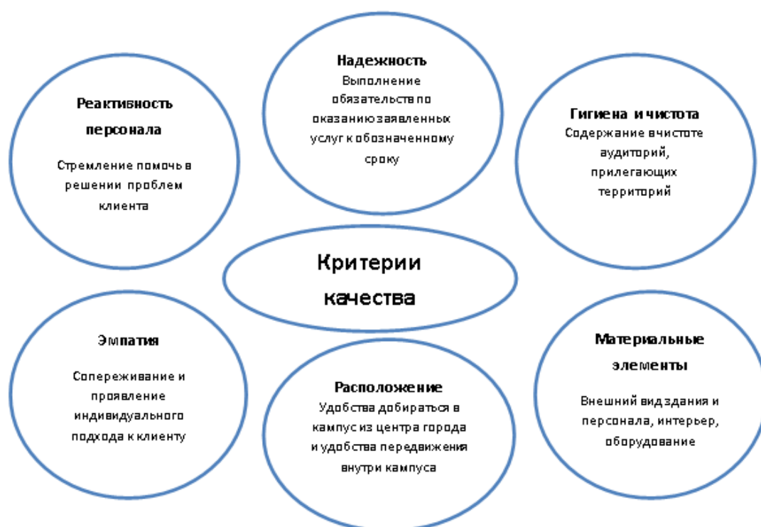
Рис. 3. Критерии оценки качества услуг