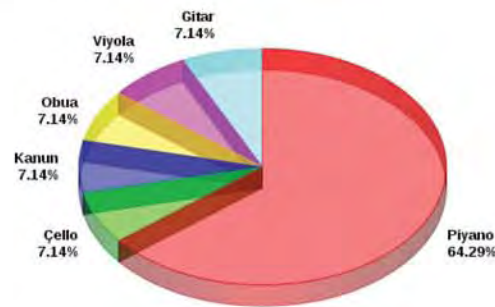
Şekil 2. Örneklem Grubundaki Piyano Öğretmenlerinin Alan Çalgılarına İlişkin Dağılımlar

Grafik 1’de piyano öğretmenlerinin %78,6 sı lisans , %14,3 ü yüksek lisans, %7,1 i ise Doktora mezunu olduğu görülmektedir. Bu duruma göre görev yapan piyano öğretmenleri, ağırlıklı lisans seviyesindedir.