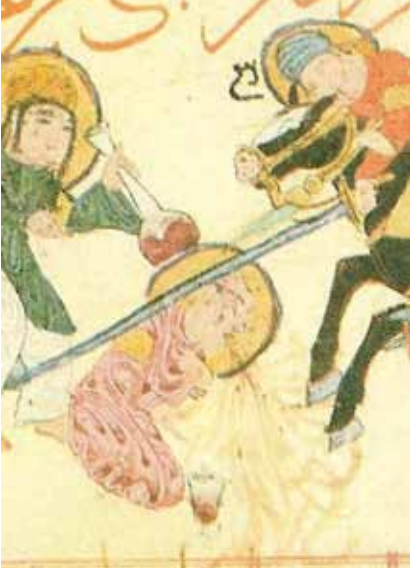
Resim 3: Varka ve Gülşah'tan savaş sahnesi ayrıntısı, TKSM, H.