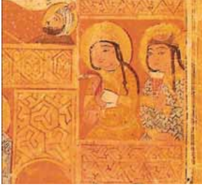
Resim 6: Kitabü'l-Tiryak 'tan ayrıntı, Viyana Milli Kütüphanesi.

“...Mecliste bulunanlar sarhoşluğun son haddine kadar şarap kadehlerini” (İbn Bibi I, 1996: 198) yudumlamışlardı. Düğünün ertesi günü davetlileri sarayın toplantı salonuna alan naibler, öğle yemeğinden sonra ; “...tas, kâse ve kadeh gibi içki aletlerini etrafta dolaştırmaya...” başlamışlar; ikinci sofranın kaldırılmasından sonra da “...kadehler tekrar dolaşmaya...” başlamış ve bu içkili eğlence bir hafta boyunca devam etmişti. (İbn Bibi I, 1996: 200).