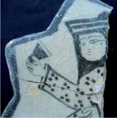
Resim 2: Kubad-Abad çinisinde kadeh tutan figür (Konya Karatay).