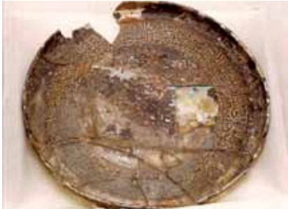
Resim 8: Kubad-Abad'dan cam tabak (Konya Karatay Müzesi'nden).

I. Alaeddin Keykubad (M.1219-1237) tahta geçtikten sonra, bu vesileyle Konya sarayında görkemli eğlenceler tertip edilmişti. İbn Bibi'nin bu ortamı anlatan bir şiirinde “Zöhre yıldızı onların kadehlerindeki kabarcıklar gibi dans eder, bazen aşka gelip o kadehi ağzına tutar” (İbn Bibi I, 1996: 237) biçiminde mısralar dikkati çekmektedir. İbn Bibi I. Alaeddin Keykubad'ın huy ve faziletlerini anlattığı şiirde ise; “Akşam olunca sema ve şarabın sevinci gelir, dostlar mest, düşman ise perişan olurdu./ Öyle bir padişah meclisi