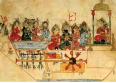
Resim 1: El-Cezerî'nin Otomatasında kayak kap konulu minyatür.