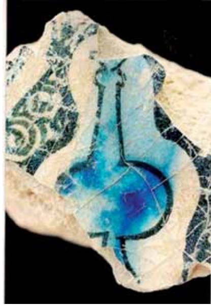
Resim 7: Kubad-Abad çinisinde şişe tasviri (kazi evi deposu, A.