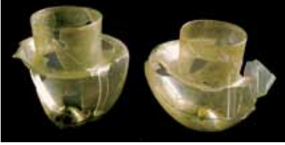
Resim 11: Kubad-Abad'dan omuzlu tipte kandil (Konya Karatay Mü.