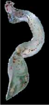
Resim 13: Kubad-Abad'dan vazo tipli kandil kulpu (kazı evi dep.)