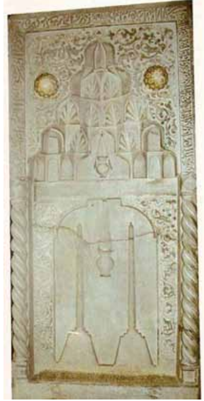
Resim 10: Konya Alevî Sultan Mescidi mihrabında kandil kabartma.

düzenlenirdi ki, Zöhre orada hizmet etmek için can atardı./ Sürahinin gözünden kan damlar, kadehin yanağı lâl gibi olurdu” (İbn Bibi I, 1996: 245-246) mısralarını kullanmaktadır. I. Keykubad, M.1221’de Alanya Kalesi’ni fethettikten sonra Alara Kalesi’ni de fethetmiş ve “Savaştan muzaffer çıkmış olan şah, bu şekilde kadehler ve çeng arasında...” (İbn Bibi I, 1996: 270) eğlence meclisleriyle vakit geçirmiştir.