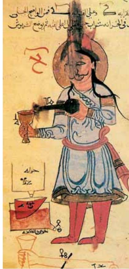
Resim 4: El-Cezerî'nin Otomatasında ayakta içki içen kişi miny.

dönemi kazısında çıkan cam tabak hakkındaki Janine Sourdell-Thomine (1969: 500-505) ve Mehmet Önder'in (1969: 1-5) makaleleri hariç tutulursa; doğrudan Kubad-Abad camlarını ele alan bir yayın da yoktur. Bunlara, R. Arık'ın son kitabındaki cam buluntulara yönelik bilgi de eklenebilir. (2000: 181-182). 2