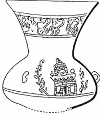
Resim 14: Yumuktepe kandili (Köroğlu'ndan).

Sourdel-Thomine'in okumasına göre 4 , kitâbede Selçuklu sultanı II. Gıyasedin Keyhusrev (M.1237-1246)'in adı, unvan ve lâkapları yer almaktadır. Tabagın üretim yerinin bir sorun teşkil ettiğini düşünen Sourdel-Thomine; özellikle kitâbedeki "kâmi'ü'l-kefere ve'l-müşrikîn muhyî'l-adl fi'l-âlemîn" ibarelerinin, adı geçen sultanın diğer kitâbelerinde görülmediğini; buna karşılık, yukarıdaki ifade biçiminin Suriye yöresi için tipik olduğunu ve Eyyûbî hükümdarlarının alışıldık unvan ve lâkapları tarzını yansıttıklarını (1969: 502) belirtir ve son olarak, bu tabağın Suriye'de üretilmiş ya da en azından Suriyeli tekniklere göre yapılmış olabileceğini 5 söyler. Kubad-Abad ve Alanya kazılarında Selçuklu devrine ait çok sayıda cam buluntuyla karşılaşılması, söz konusu dönemde Anadolu'da da üretim yapıldığını göstermektedir. Konuya bu açıdan yaklaşıldığında; Selçuklu sultanlarının saray için cam eşya sipariş ettikleri ya da, en azından saray için ülkede cam kapların üretildiği anlaşılır.