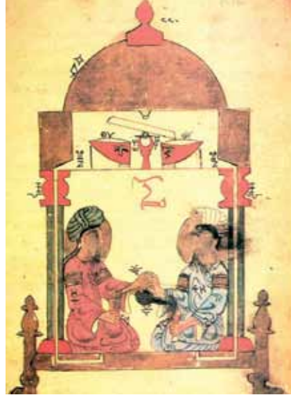
Resim 5: El-Cezerî'nin Otomatasında birbirlerine şarap ikram e.

Bunlardan en önemlisi durumundaki İbn Bibi'nin Selçuknâmesi ile onun muhtasarı ve tercümelelerinde Anadolu Selçuklu devrinde cam ve camcılıkla doğrudan ilgili bilgiye rastlanmamaktadır. Bununla birlikte tahta çıkış, düğün, zafer kazanma gibi olaylar vesilesiyle düzenlenen eğlence meclislerinde içki kadehlerinden sıklıkla söz edilmektedir.