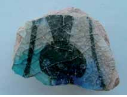
Resim 9: Kubad-Abad çinisi üzerinde kandil tasviri (kazı evi d.)