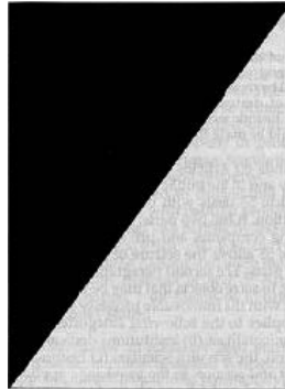
Şekil 1. 1907 Lahey Sözleşmesi Ayırt Edici Bayrağı