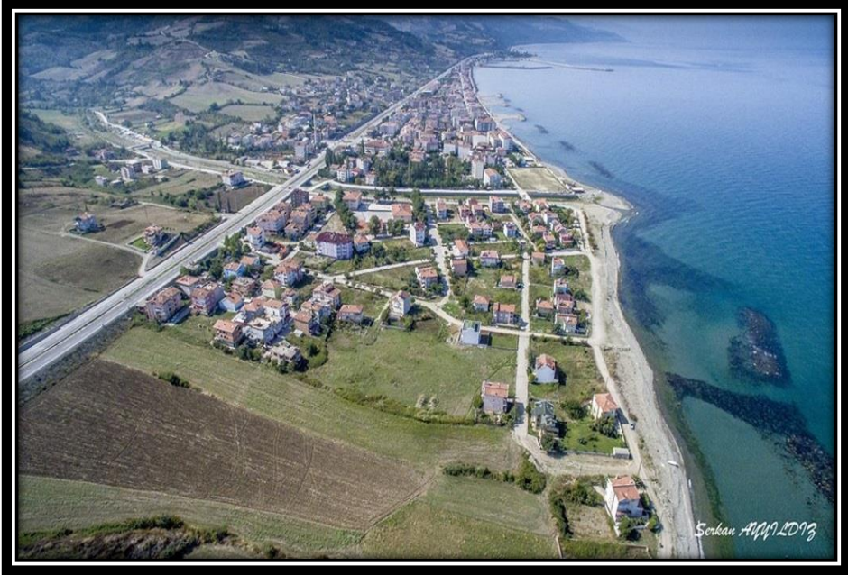
Şekil 2: Deniz Kıyısında Kurulan Yakakent Yerleşmesinden Genel Bir Görünüş

İlçenin kuruluş adı Kominos'tur. Rumca'da başsız piskopos anlamına gelen Kominos, Baş Piskoposun bağımsız bir şekilde kilise kuran kişilere verilen isimdir. Muhtemelen o dönemde burada yaşayan bir piskoposun bağımsız bir şekilde kilise açmasıyla kendisine verilen bu isim, aynı zamanda yerleşim yerinin de bu isimle anılmasına sebep olmuştur. Bölgede yaşayan insanların ağızlarında zamanla değişen Kominos ismi, Gumenos ve Gümenos isimlerine dönüşmüş ve son olarak da Gümenez ismini almıştır. Nihayet 1963 yılına yer adlarının yabancı kelimelerden arındırılması amacıyla ilçeye kıyı şehri anlamına gelen Yakakent adı verilmiştir. Bu adın verilmesinde ilçenin bulunduğu coğrafi konumun dikkate alınması da coğrafyanın yer adlarının konulmasında ne denli önem arz ettiğini bir kere daha ortaya koymaktadır.