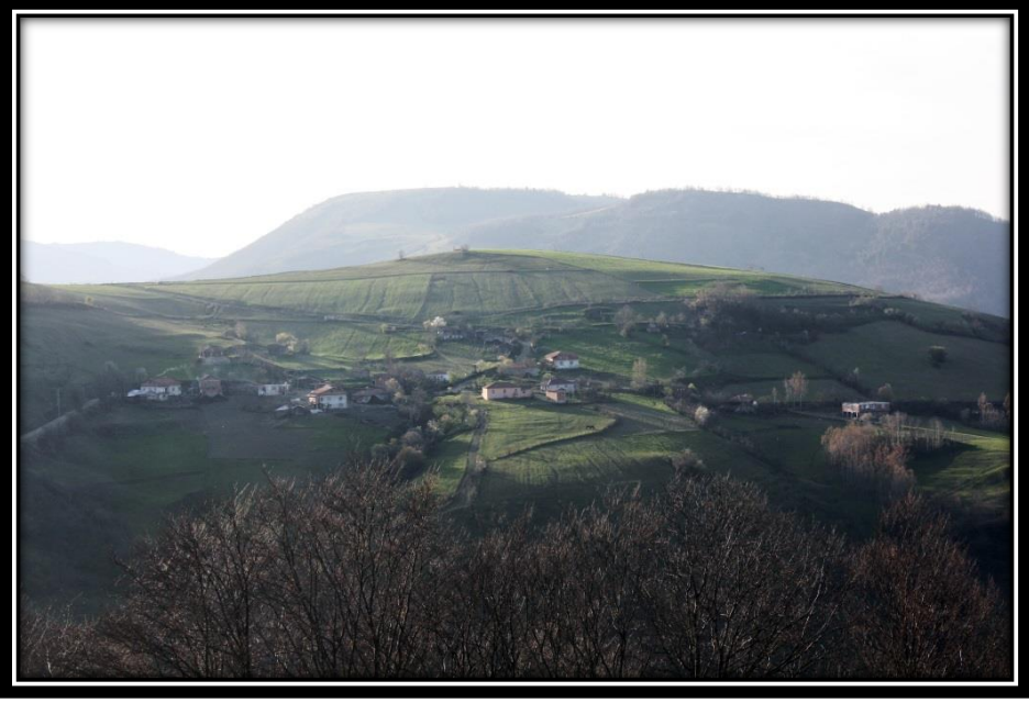
Şekil 5: Yer Şekilleri İle İlgili Yer Adları Arasında Sınıflandırılan Yassıdağ Mahallesi