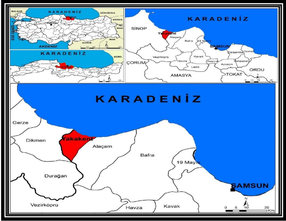
Şekil 1: Yakakent İlçesi'nin Lokasyon Haritası

Araştırma sahasının yüzü şekilleri, iklim özellikleri, toprak kalitesi ve beşeri özellikleri dikkate alındığında ekonomik faaliyetlerin buna göre şekillendiği görülmektedir. Sahanın yaklaşık % 90'lık bir kısmı altıncı ve yedinci sınıf tarım arazilerinden oluşmaktadır. Sahada birinci ve ikinci sınıf arazi varlığı yok denecek kadar azdır. İlçenin kuzey doğu kesiminde deniz kıyısında Bafra Delta Ovası'nın batı kenarını oluşturan çok dar bir alan olarak karşımıza çıkmaktadır. Yine Bafra Ovası kenarında bulunan kesimde dar bir alanda üçüncü ve dördüncü sınıf arazi görülmektedir. Çok dar bir alanda görülen bu araziler dışında ilçenin hemen tamamı vasıfsız ve verimsiz altıncı ve yedinci sınıf arazilerden oluşmaktadır. Bu durum tarımsal faaliyetlerin az olmasına ve geri planda kalmasına sebep olmaktadır. Sahada tarımsal faaliyetler ve üretim, sadece yöre halkının kendi ihtiyaçlarını karşılamaya yönelik olarak yapılmaktadır. Ayrıca ilçe yüzölçümünün yaklaşık yarısı ormanlık alanlarla kaplıdır (Tablo 1).