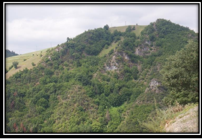
Şekil 4: Yer Şekilleri İle İlgili Yer Adları Arasında Sınıflandırılan Kayalı Mahallesi

Sahadaki ilgi çekici adlardan bir kısmı da Oğuz boyları ile ilgili olan adlardır. Fatih Sultan Mehmet zamanında Karadeniz Bölgesi'ne yerleştirilen Çepniler, burada bulunan bir köye adını vermişler ve aynı zamanda kendi kültürlerini halen bu bölgede yaşatmaya devam etmektedirler. Yirmi dört Oğuz Boyunun yirmi birincisi olan Çepni, “nerede düşman görse savaşan” anlamına gelmektedir. Oğuzların Üçok koluna mensup olan Çepnilerin simgesi ise doğan kuşunun en yırtıcı türlerinden olan Sungur kuşudur. Yine Bozokların Avşar kolunun üç obasından biri olan Gündüz Oğulları 15. Asırdan sonra Batı Anadolu'ya iskân ettirilmişler ve bir kısmı da sahadaki Gündüzlü adı verilen köyde yerleşmişlerdir. Bir parantez de Kalaç/Halaç ismine açmakta fayda görülmektedir. Yukarıda Kalaç adı, rüzgâr adı olarak konulan yer adlarına örnek gösterilmiş olsa da; bu yere tarihte Akhunlar'ın bakiyeleri olarak görülen Kalaç/Halaç Boyundan (Gömeç, 2009: 11.) dolayı bu adın verildiği düşünülmektedir. Zira Kalaç olarak adlandırılan yerin Gündüzlü Mahallesi'nin bir sokağı durumunda olması ve Gündüzlü Mahallesi'nin de yine yukarıda değinildiği üzere Bozokların Avşar kolundan olması, bu tezi güçlendirmektedir. Yine sahada kullanılan Oğuz, Türkmen ve Yörük adları da Türk boylarını yansıtan diğer adlardır.