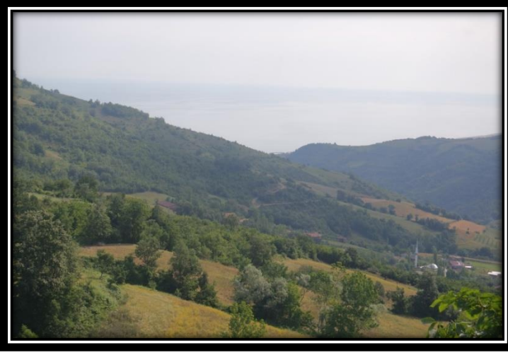
Şekil 6: Bitki Adları Arasında Sınıflandırılan Gürgenlik Mahallesi

tarafından kabul görmüş kişilerin isimleri, o yere verilmiştir. Sahada da bu tarzda adı verilen birçok yerleşim yeri veya mevki bulunmaktadır. Fındıkbekir, Karacababa, Köseosman Tepesi, Uzunkız, Sarıhüseyin, Ömer, Kilitçi, Yusufaga, İbişoğlu, Çobanoğlu ve Hatip adları kişi adları olarak verilen isimler olarak belirlenmiştir. Sahadaki ekonomik faaliyetlerin de Bağlıca, Yağcı, Köseli, Mutaflı, Karaaba, Yünlüce köylerine adını verdiği görülmektedir. Sahada Çepni, Gündüzlü, Oğuz, Türkmen ve Yörük adları, Oğuz Boyları ile ilgili verilen adlara örnek olarak gösterilebilmektedir. Sahada geçici yerleşmeler bulunmaktadır. Bu yerleşmelerle ilgili olarak ad çok fazla bulunmasa da iki tane Kışla Köyü, sahada geçici yerleşmelerle ilgili verilen adlar başlığı altında belirlenmiştir. Mistik ve efsanevi adlar da sahada kendine isim bulabilmektedir. Evliya Tepesi, Çığlık ve Kominos adları da bu alanda sahada verilen yer adlarındandır. Kültür ve tarih ile ilgili olarak da Lazlar, Deli, Zincirli ve Sarısoy adları belirlenmiştir.