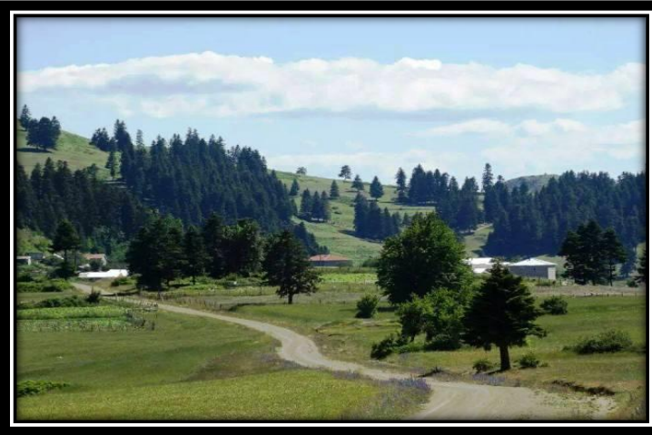
Şekil 7: Kişi Adları İçerisinde Sınıflandırılan Uzunkız Yaylası