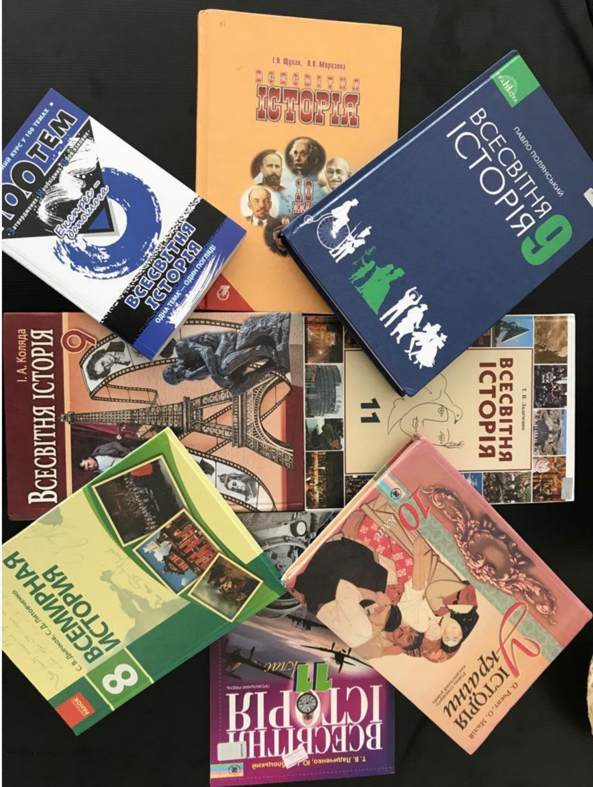
Ek-1: Araştırmada kullanılan bazı ders kitapları