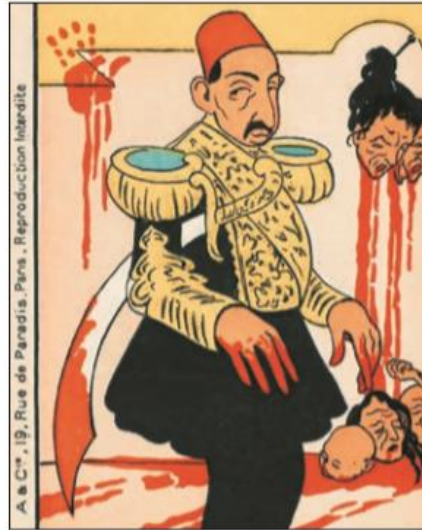
Зулом. Карикатура на правління Абдул-Гаміда II

Şekil 5. Zulüm. Abdülhamid Devrine Ait bir Karikatür (Gisem, ve Martinuk, 2017: 208)