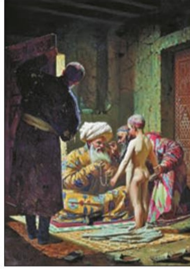
■ Продаж дитини-невільника. Художник В. Верещагін

Kitaplarda yenileşme ve reform çabalarının genel olarak başarısız olduğu kanaati hâkimken, Tanzimat ve Islahat fermanları için övgüler yer almaktadır. Bilhassa gayrı Müslimlere getirilen yeni haklar anlatılmakta, nüfusun yüzde kırkını oluşturan gayrı Müslimlerin, diğerleriyle eşitlendiği; Sultan Abdülaziz'in bu yenilikleri Müslümanlar lehine değiştirmek istediği ancak Yeni Osmanlılar'ın buna karşı çıktığı belirtilmektedir (Şulak, 2017: 156; Gisem ve Martinuk, 2017: 207).