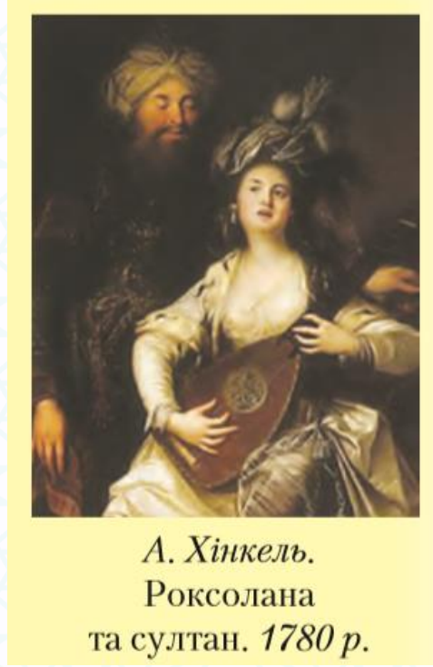
Şekil 3. Roksalana (Hürrem Sultan) Ressam A. Hinkel-1780 (Lihtey, 2016: 137)

Osmanlı İmparatorluğu'nun zayıflaması ayrı bir başlıkta anlatılmakta ve şu bilgiler yer almaktadır: