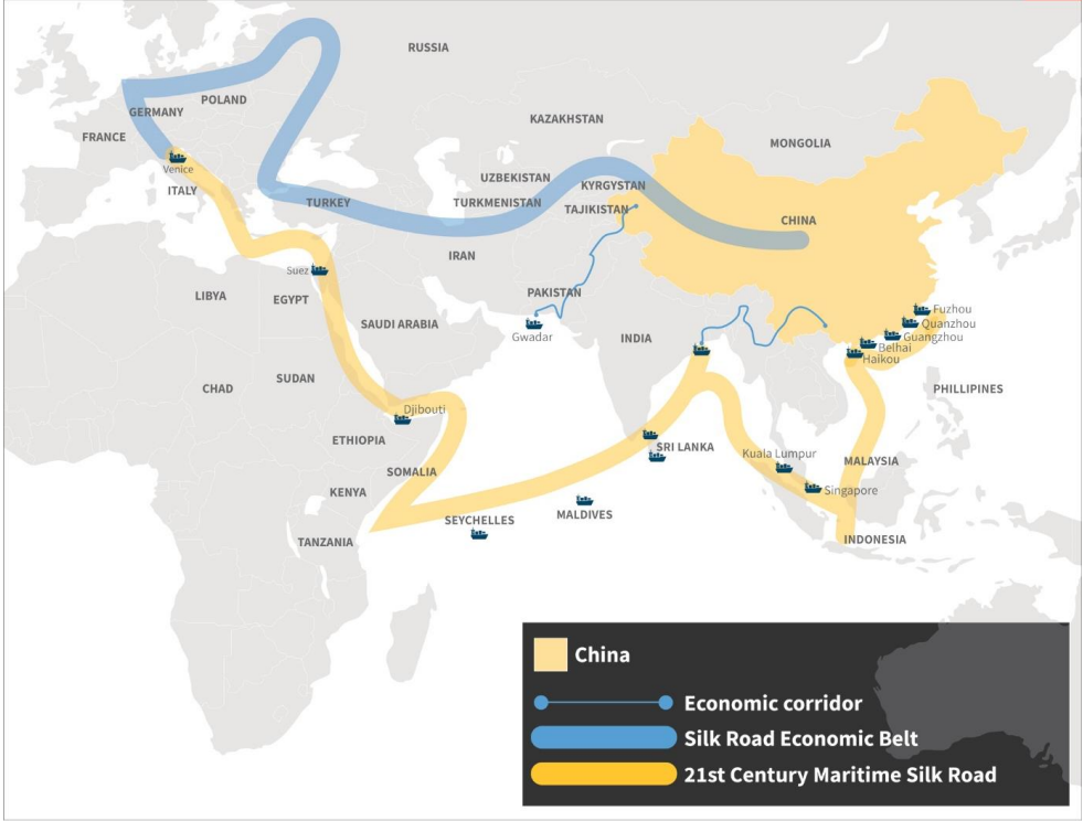
Şekil: 2 Kuşak ve Yol Güzergahları