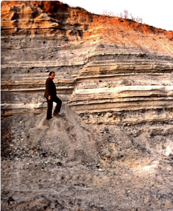
Foto 3. Bir öğrenci gezisinde Eski Acıgöl’de