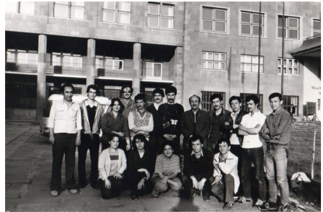
Foto 4. 1982 yılında Nevşehir çevresine yapılan bir gezi öncesi fakülte bahçesinde