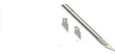
Fotoğraf 2. Kretuar Bıçağı