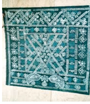
Şekil 2. Doğu ve Güneydoğu Anadolu’da geleneksel kadın giyiminde kullanılan mum batık tekniği ile boyanmış ”bervanik” önlük