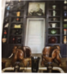
Şekil 3. Nelly Rodi ile 2017/2018 Evtexs trendleri katalogu sonbahar-kış sezonu tema: "Gizemli bahçe"