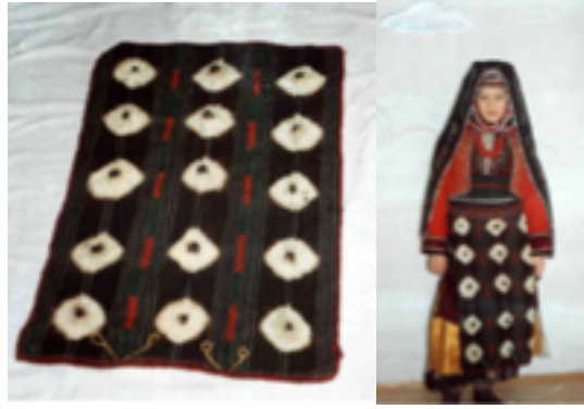
Şekil 1. Fiziksel rezerve (bağlama batik) tekniği ile boyanmış Bursa Keles yöresi önlüğü ve geleneksel kullanım şekli

“Bağlama batik” olarak bildiğimiz, kumaşın fiziksel işlemlerle sıkıştırılarak boyanın kumaşın her yerine ulaşmasının engellendiği boyama tekniğidir. Kumaş çeşitli yollarla bağlanarak, teğellenerek ya da mandal, kağıt kısıkaçı gibi malzemelerle sıkıştırılarak boyanın tüm yüzeye ulaşmasına engel olunarak desen oluşturulur. Bu teknikte boyanan tekstillerin Anadolu'da geleneksel olarak kullanımı çok yaygın değildir. Bursa Keles yöresi geleneksel kadın giyiminde kullanılan önlükler bu teknikle desenlendirilmektedir. Eğrilmiş doğal yünden bez ayağı tekniğiyle dokunan tezgâh enindeki üç parça bez üst üste beş yuvarlak oluşturulacak şekilde içine nohut konulup keçî kılıyla bağlanarak siyah renkte boyanır (şekil 1). Parçalar renkli ipliklerle desenli bir şekilde dikilerek birleştirilmektedir (Begiç, 2015).