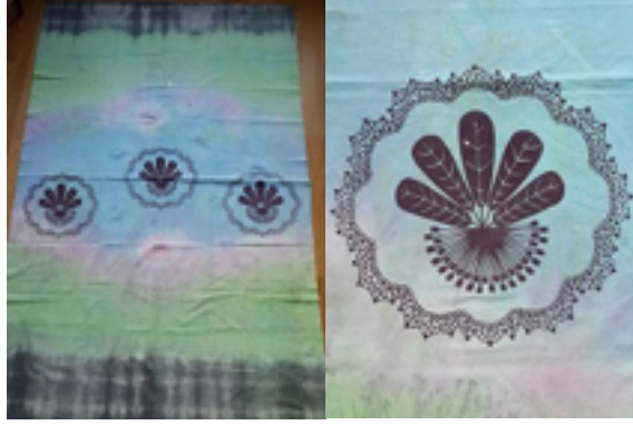
Şekil 4. Bağlama batik üzerine şablon baskı çalışması (Öğrenci, Ayçin Öneş)