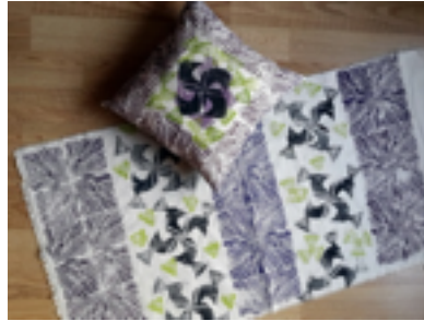
Şekil 6. Linol baskı çalışması, (Öğrenci, Ayçin Öneş)