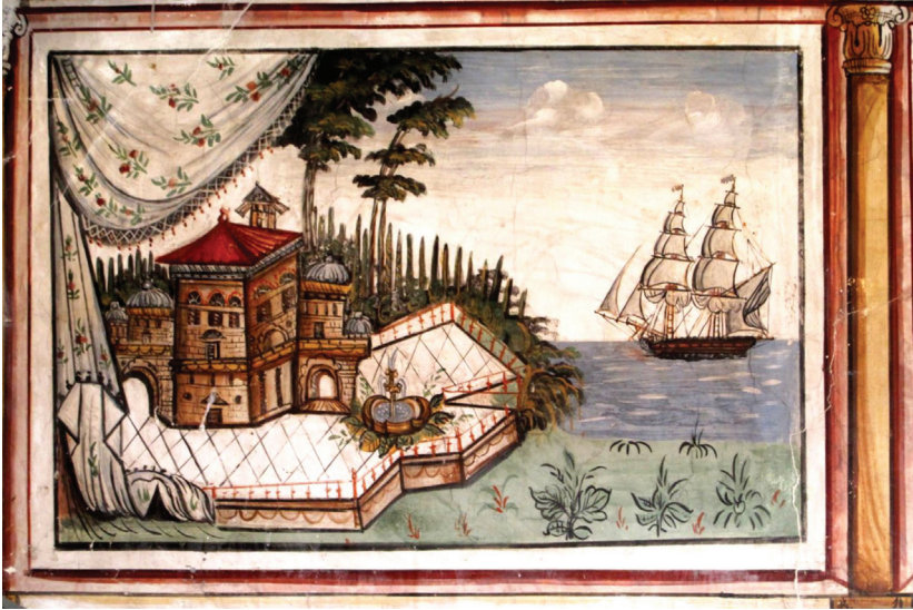
Fot. 9: Petra Vareltzidenas Evi - Mimari Tasvirli Pano