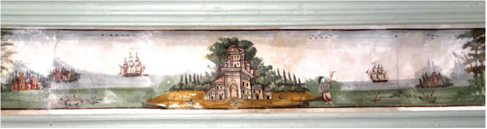
Fot. 5: Petra Vareltzidenas Evi - Mimari Tasvirli Manzara