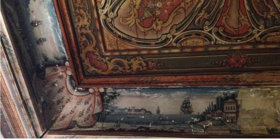
▲ Fot. 25: Molova Giannakos Evi -Mimari Tasvirli Manzara