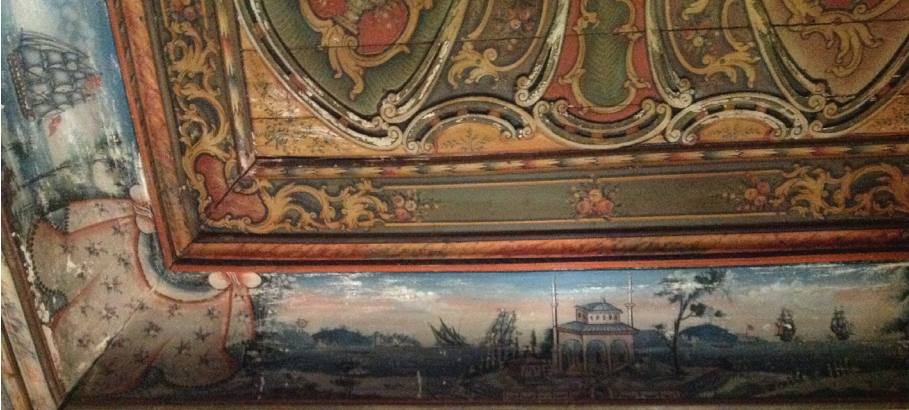
▲ Fot. 26: Molova Giannakos Evi - Mimari Tasvirli Manzara