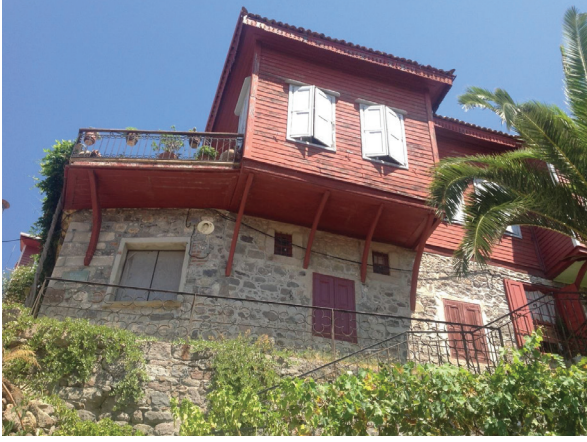
Fot. 20: Molova Giannakos Evi - Genel Görünümü

Duvarın üst kesiminde bulunan büyük bir manzara kompozisyonu çok tahrip olmakla birlikte, mevcut kalıntılardan denizle bölünmüş üç kara parçasıyla klasik bir İstanbul panoramasının resimlenmiş olduğunu gösterir. (Fot. 23) Ancak, bu resimde, Petra Vareltzidenas Evi ’ndeki İstanbul panoramasından daha tanımlı bir panorama ile karşılaşılmaktadır. Kent güneyden, Marmara Denizi’nden bakılarak resimlenmiştir. Ön planda denizin ortasında bir yelkenli ve hemen arkasında da Kız Kulesi seçilebilmektedir.