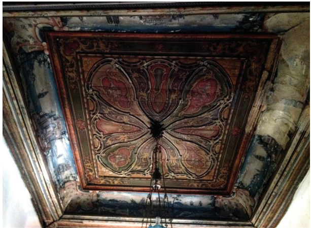
Fot. 22: Molova Giannakos Evi - Genel Görünümü