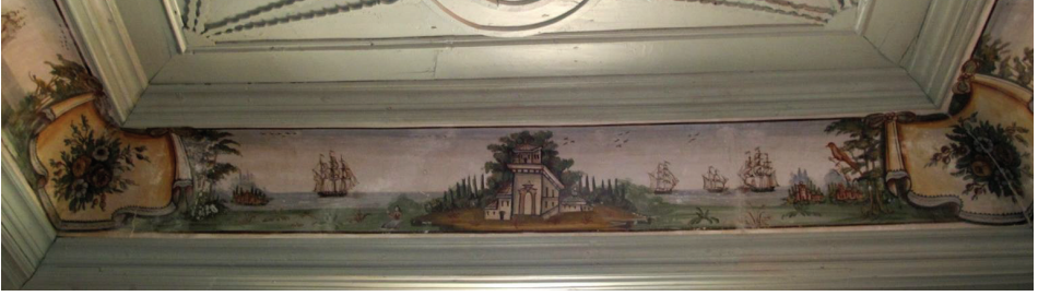
Fot. 3: Petra Vareltzidenas Evi - Mimari Tasvirli Manzara