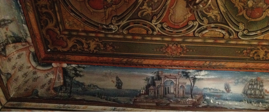
▲ Fot. 27: Molova Giannakos Evi - Mimari Tasvirli Manzara