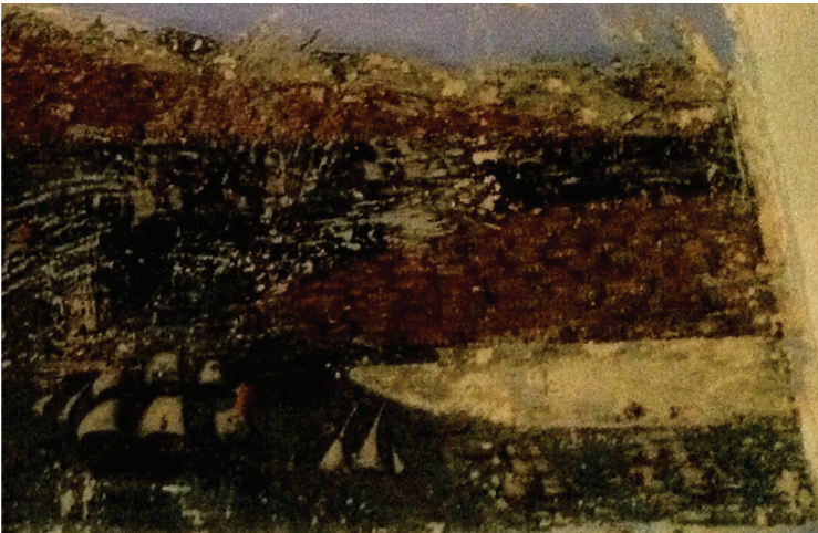
Fot. 23b: Molova Giannakos Evi - İstanbul Panoraması Ayrıntı