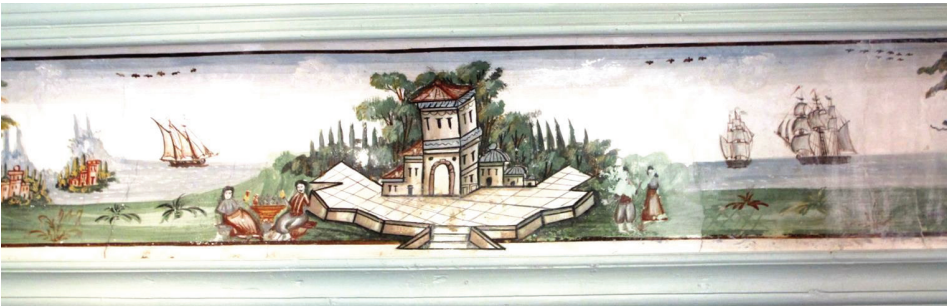
Fot. 6: Petra Vareltzidenas Evi - Mimari Tasvirli Manzara