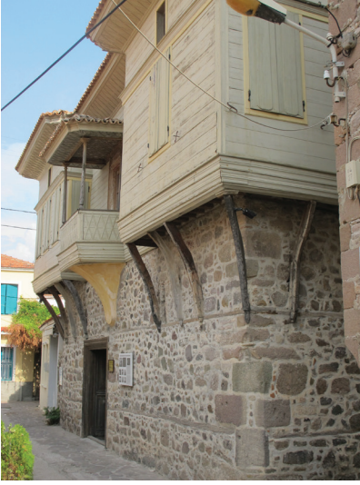
▲ Fot. 1: Petra Varelzidenas Evi, Genel Görünümü