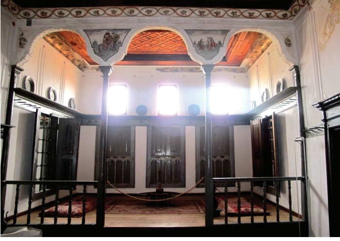
Fot. 15: Petra Vareltsidenas Evi - Genel Görünümü