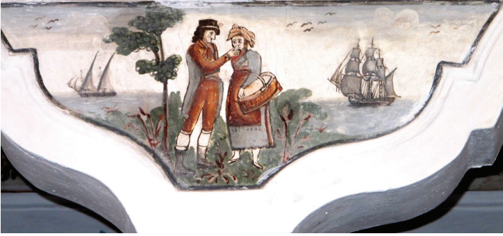
Fot. 13: Petra Varelzidenas Evi - Figürlü Manzara