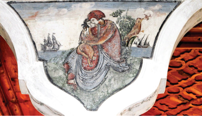
Fot. 16: Petra Vareltsidenas Evi - Figürlü Manzara