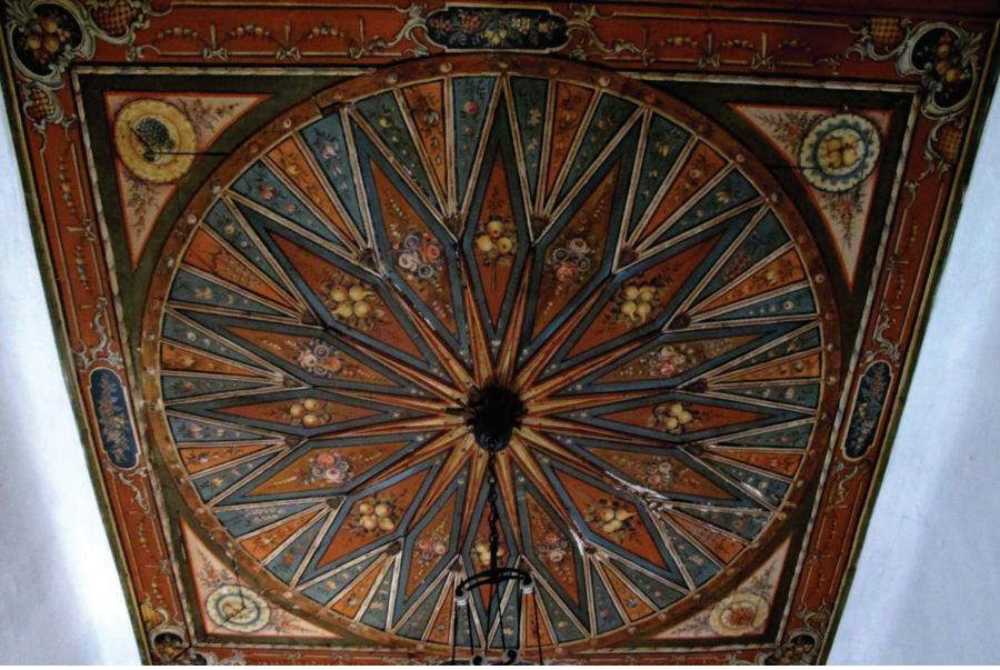
Fot. 28: Molova Giannakos Evi - Tavan Genel Görünüm