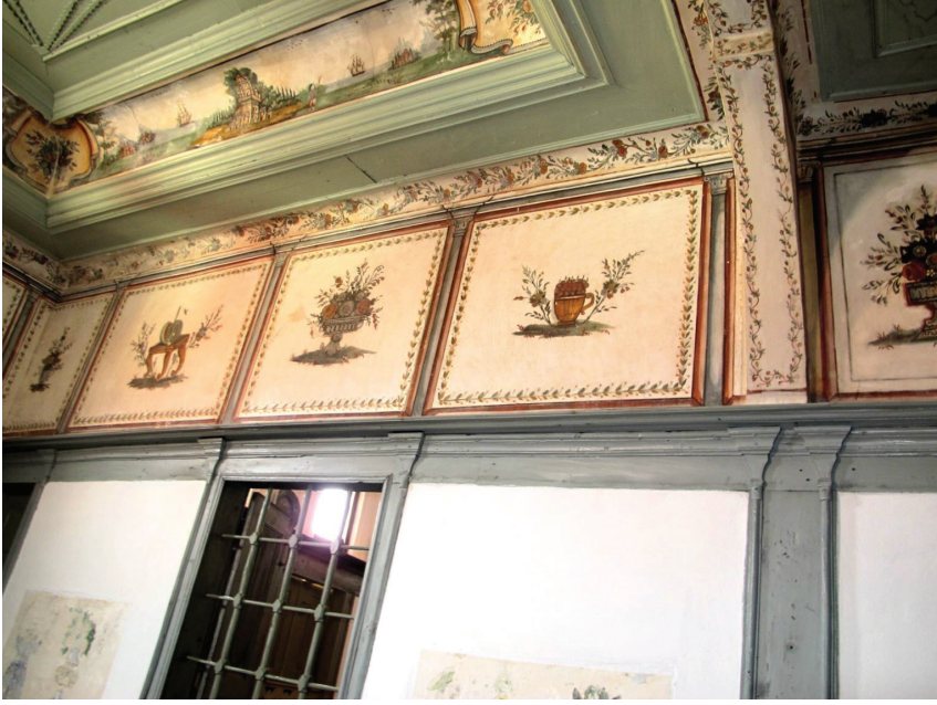
Fot. 7: Petra Vareltzidenas Evi, Genel Görünümü

Aynı odada, üstte Bursa kemeri ile ayrılmış girintili kısmında diğerlerinden daha büyük tutulmuş enine dikdörtgen formlu iki manzara panosubulunmaktadır. (Fot. 8). Sol bölümde yer alan panoda; deniz kıyısında platformlu bir bina, daha büyük olan ve sağ bölümde yer alan panoda ise hayali İstanbul panoraması resimlenmiştir.