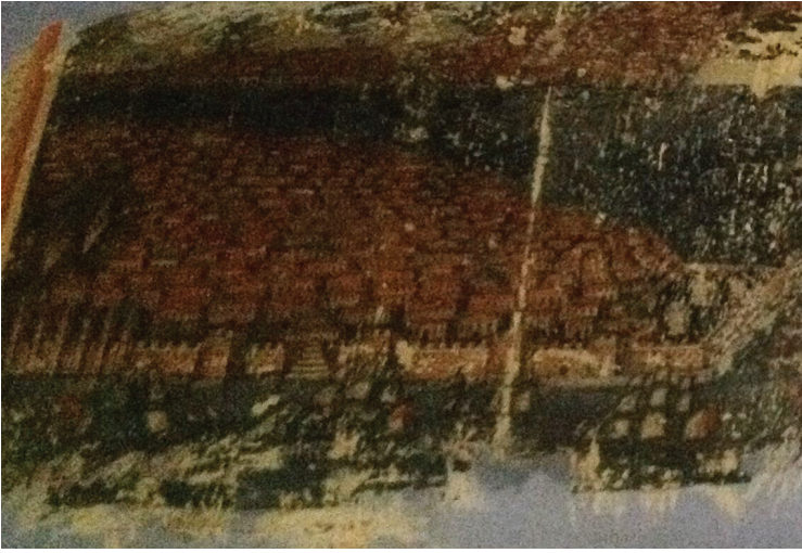
Fot. 23a: Molova Giannakos Evi - İstanbul Panoraması Ayrıntı