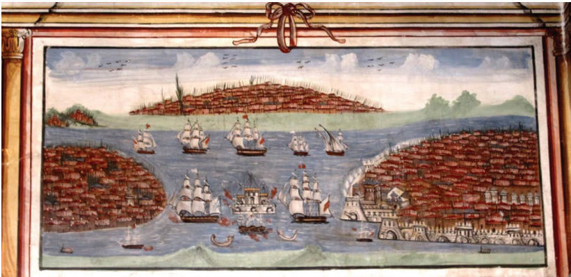
Fot. 10: Petra Vareltzidenas Evi - İstanbul Panoraması