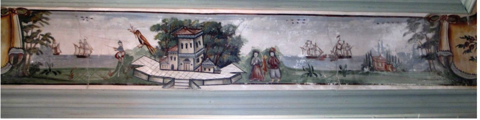
Fot. 4: Petra Vareltzidenas Evi - Mimari Tasvirli Manzara