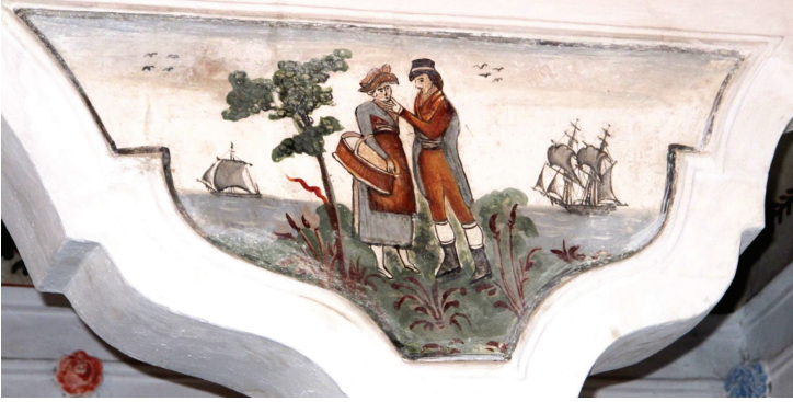
Fot. 14: Petra Varelzidenas Evi - Figürlü Manzara

gösterirler. Bu figürlü resimlerle izleyene sanki bu evde yaşayan insanların birbirlerine olan sevgi ve saygısını yansıtan iyi anılar, olaylar anlatılmak istenmiş gibidir. Kemerlerin duvarlara bağlandığı dış köşelerdeki yarım köşeliklerde birer kuş motifi vardır. (Fot. 15) Bu odada, duvarların üst kesimini perde motifleri dolanmaktadır. Kıvrımları belirtilmiş ve üstten fiyonklarla tutturulmuş perdelerden bazıları günümüzde yok olmuştur. (Fot. 15) Merkezine çiçekli birer kompozisyon yerleştirilmiş sarı renkli perdelerin eteklerinde su motifi uzanır.