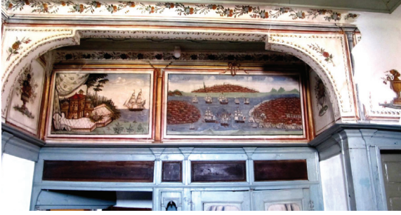
Fot. 8: Petra Vareltzidenas Evi - İki Pano