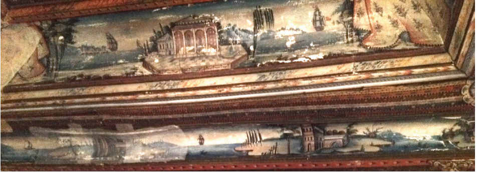
Fot. 24: Molova Giannakos Evi - Mimari Tasvirli Manzara

Kompozisyonlardan birinde ortada revaklı bir bina ile bu yapıya solundan bitişen daha küçük ikinci bir bina resimlenmiştir. (Fot. 24) İki cepheli gösterilmiş küçük bina, beşik çatılı, üçgen alınlıklıdır. Sağında küçük bir havuzu bulunan platformu çift renkli karo taşlarıyla kaplanmıştır. Solda arka planda ağaçlıklı bir alanda ne olduğu tam anlaşılamayan yapılar ve bu yapılardan oran olarak daha büyük yapılmış bir gemi gösterilmiştir. Sağda ise uçsuz bucaksız denizin ortasında kocaman bir gemi, solunda tahrip olmuş kesimde ise yine ne olduğu belirlenemeyen yapılar resimlenmiştir.