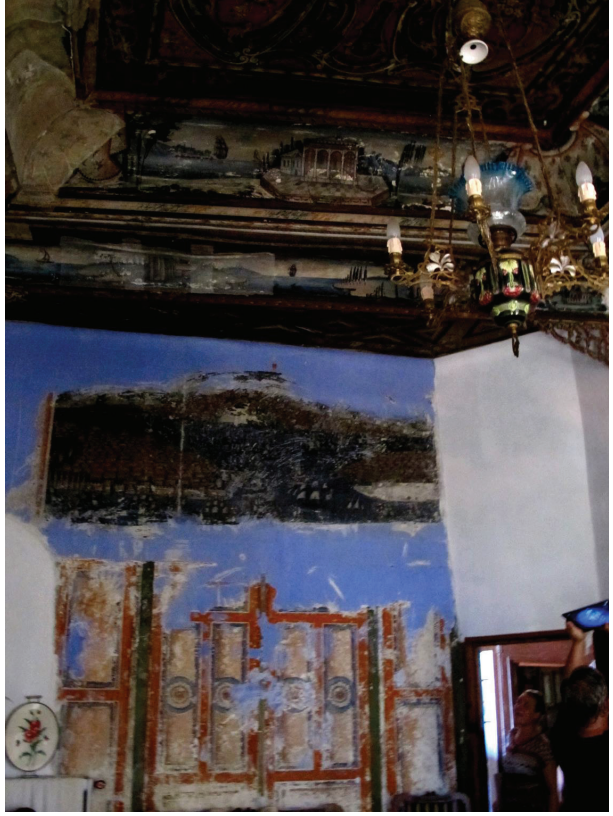
Fot. 21: Molova Giannakos Evi - Genel Görünümü

Duvarı saran kuşağın dört kenarındaki resimler, bir kıyıdan karşı tarafa bakılarak yapılmıştır. (Fot. 24-27) Alçak ufuk çizgisi ile