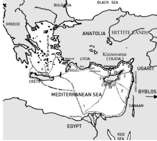
Harita 2: Bronz Çağı Sonlarında Levant'da Ticaret 7 .

ticarete bir merkez görevi görmüştür. Doğudan Batıya veya Batıdan Doğuya giden gemiler genellikle buraya uğradıktan sonra yollarına devam etmişlerdir. Bu nedenle Kıbrıs ile Mısır arasında ticaret ağı kurulmuştur (Harita 2). Mısır ile ticarete bakır önemli bir yere sahip olmuştur (Knapp 1991: 22).