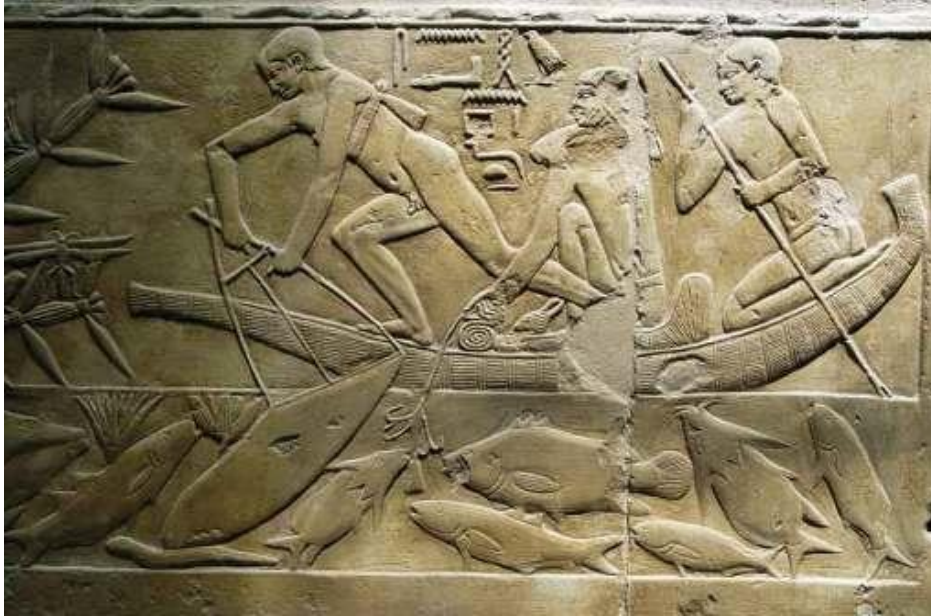
Resim 1: Antik Mısır'da Balık Avı 4 .

Levant'daki Lübnan dağları sedir ormanlarıyla kaplıydı (Günaltay 1947: 163). Mısırlılar, gemi yapımında Lübnan sedir ağacını kullanarak büyük tekneler yapmışlardır. Mısır gemilerinin varlıkları en iyi şekilde mezarlarda betimlenen gemi resimlerinden (Resim 2) gözlemlenebilir. Meket-Re mezarında çok fazla sayıda gemi resmi duvarlara kazınmıştır. Meket-Re balık tutarken burada resmedilmiştir (Bass 1972: 30) . Duvar resimlerinde ölü taşıyan tekneler de resmedilmiştir. Bu teknelerde tören için getirilen hediyeler ve ölü yakınları taşınmaktaydı (Casson 2002: 9). Mısırdaki cenaze teknelerinden daha büyük yük gemilerinin kullanıldığı da görülmektedir (Casson 2002: 13). Bu gemiler ile Gize'deki piramitlerin inşaatı sırasında kullanılan kireçtaşları taş ocaklarından buraya taşınmıştır.