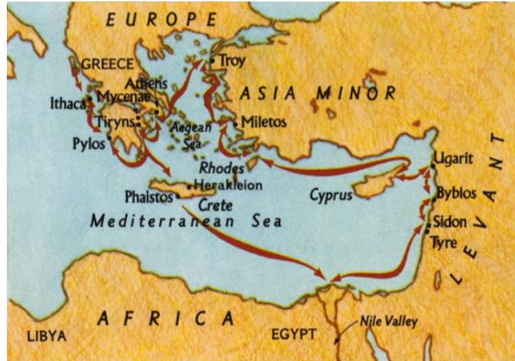
Harita 3: Levant'da Liman Kentleri 8 .

Önceleri küçük tekne ve botlarla yapılan seferlerde, teknelerin küçük olması kıyıya yanaşılmasında sorun teşkil etmemekteyken, Tunç ve Demir çağlarında yapılan gemiler kıyıya yanaşmakta zorlandığından bölgede liman ihtiyacı doğmuştur ve liman kentleri kurulmuştur. Levant'ın önemli liman kentleri arasında; Tyre, Gazze, Sidon, Byblos ve Simirra (Harita 3) kentleri yer almıştır (Tunçdilek 1962: 262). Ugarit, bu liman kentlerinin en eskilerinden biri olmuş (Tok 2001: 92) ve kent Tunç Çağında altın çağını yaşamıştır. Birçok uygarlığın odak noktası olan bu liman kenti, Mısır, Hitit ve Mezopotamya uygarlıkları için yoğun bir ticaret merkezi haline gelmiştir. Ugarit kenti, aynı zamanda tüccarların ürünlerini sattıkları bir pazar alanı olarak nitelenebilecek bir alana sahip olmuştur. Yani farklı bölgelerden gelen tüccarlar bu kentte buluşup ürünlerini pazarlama imkanına sahip olmuşlardır. Ugarit, diğer yandan kültür merkezi konumunda sahip olmuştur. Kente farklı uygarlıklardan tüccarların gelmesi burada kültürel bir etkileşimin yaşanmasına zemin hazırlamıştır. (Hamza 2006: 20-21).