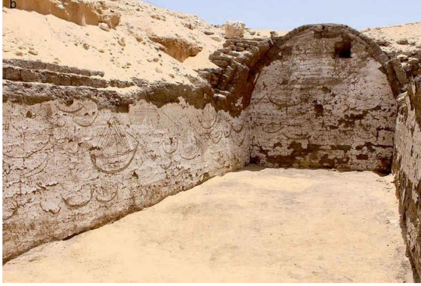
Resim 2: Mısır Firavunu III. Senusret'in (M.Ö. 1878 – M.Ö. 1839) Mezarının Yanına Çizilmiş Tekne ve Gemi Resimleri 5 .

Antik dönem yazarları Mısır'da teknelerin kullanımı hakkında önemli bilgiler vermişlerdir. Herodotos Mısır'da kullanılan tekneler için şu açıklamalarda bulunmaktadır: