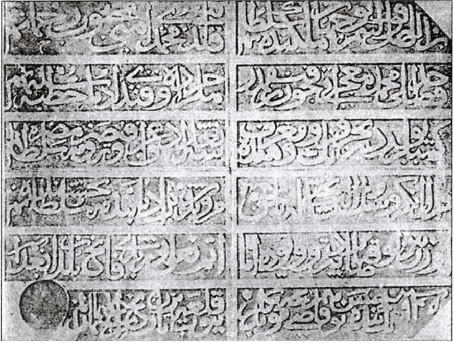
F.18. Bender Kalesi'nin h.935-m.1538 tarihli kitabesi (TDİ. Ans. C.5, s. 431'den)