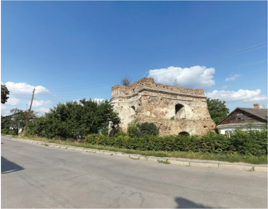
F.5.Tatar Pınarı Kalesi