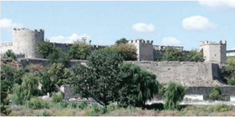
F.11. Bender Kalesi: üstte içkale ve iki kademeli surlar, altta surların dıştan görünüşü.