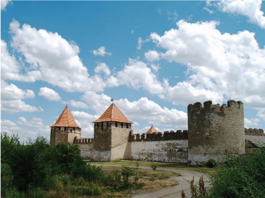
F.13.Bender Kalesi burçları