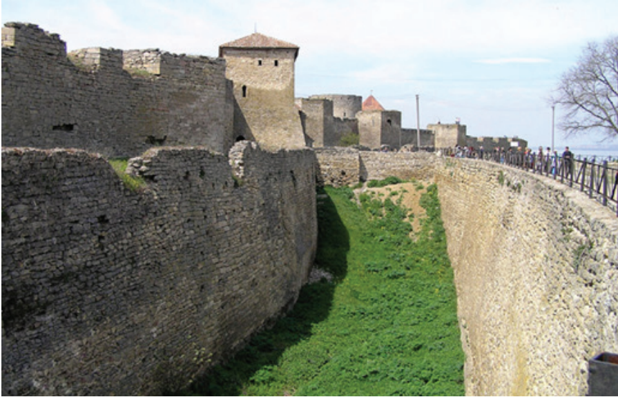
F.9. Akkerman surları ve kale hendeđi