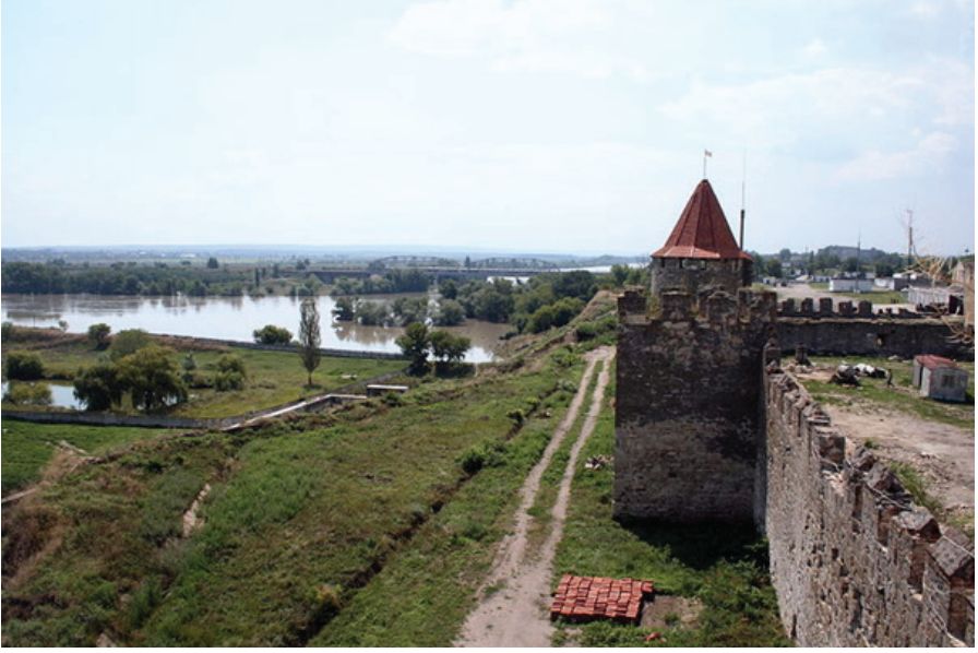
F.14.Bender Kalesi Turla Nehri ilişkisi.