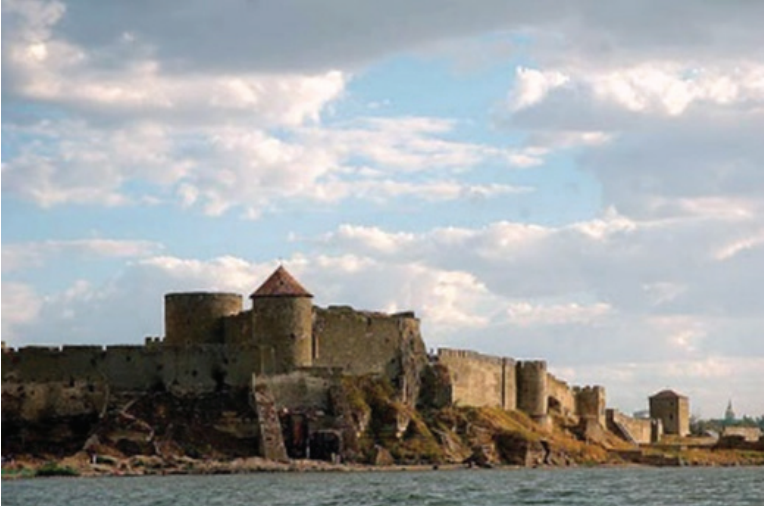
F.10. Akkerman Kalesi