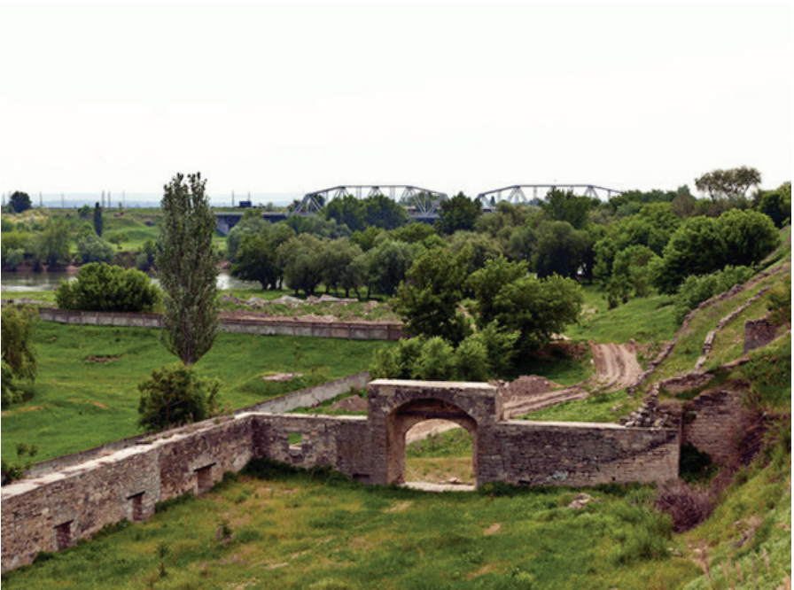
F.15. Bender Kalesi varoşlar arasındaki kapı.