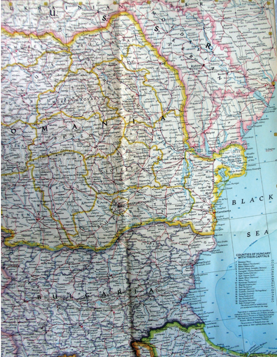
H.1.Evliya Çelebi'nin Silistre'den Yaş'a kadar seyahat ettiği yerler ve yolların haritadaki yerleri