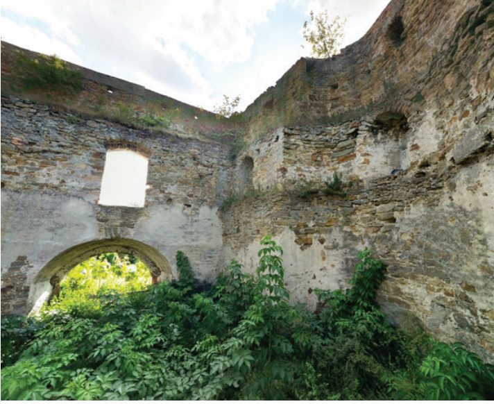
F.6.Tatar Pınarı Kulesi'nde iç mekan dokusu