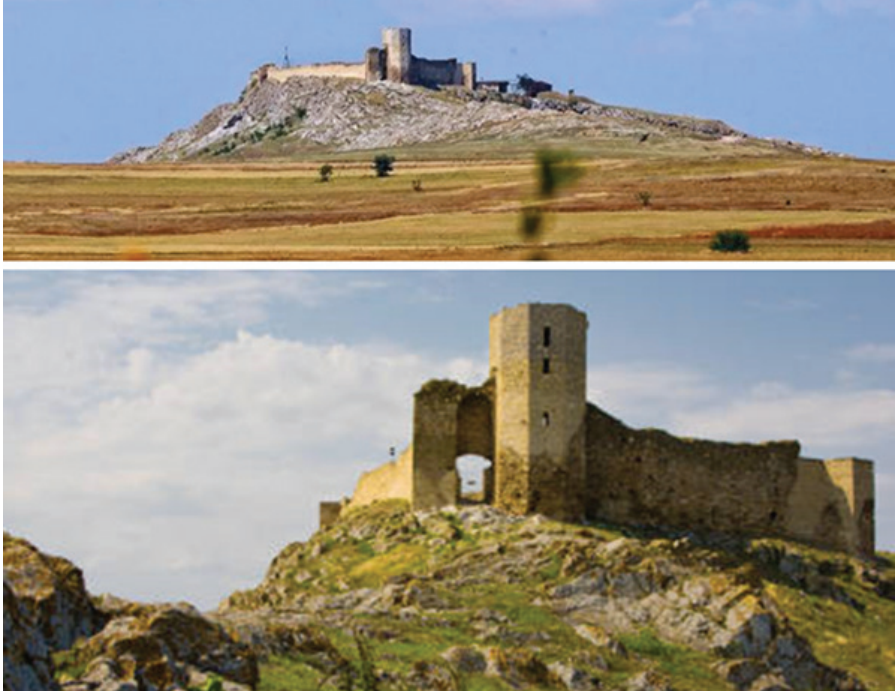
F.3.Tolcu iç kalesi (Enisala) ve varoşu.