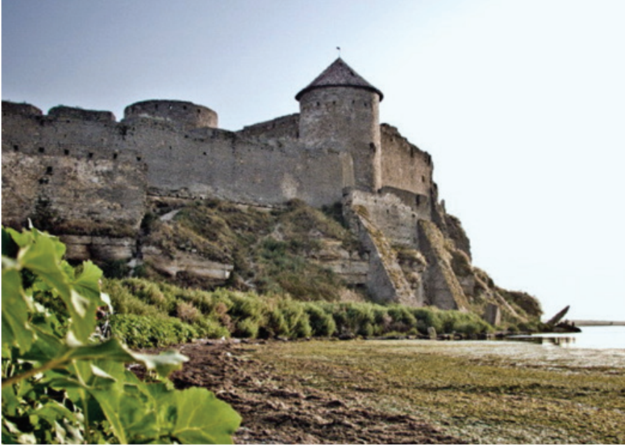
F.8. Akkerman Kalesi (Belgrad Dinyester)