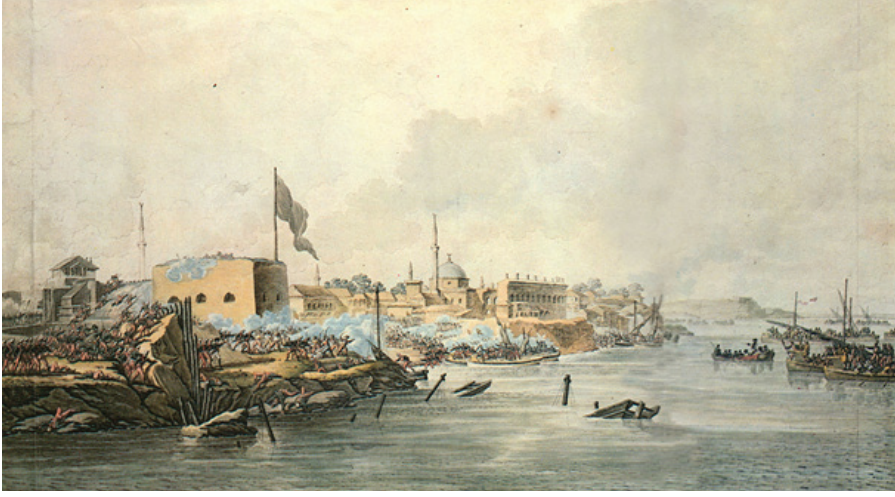
R.4.İsmail Kale şehrinin 1790 yılındaki kuşatmayı gösteren resim.