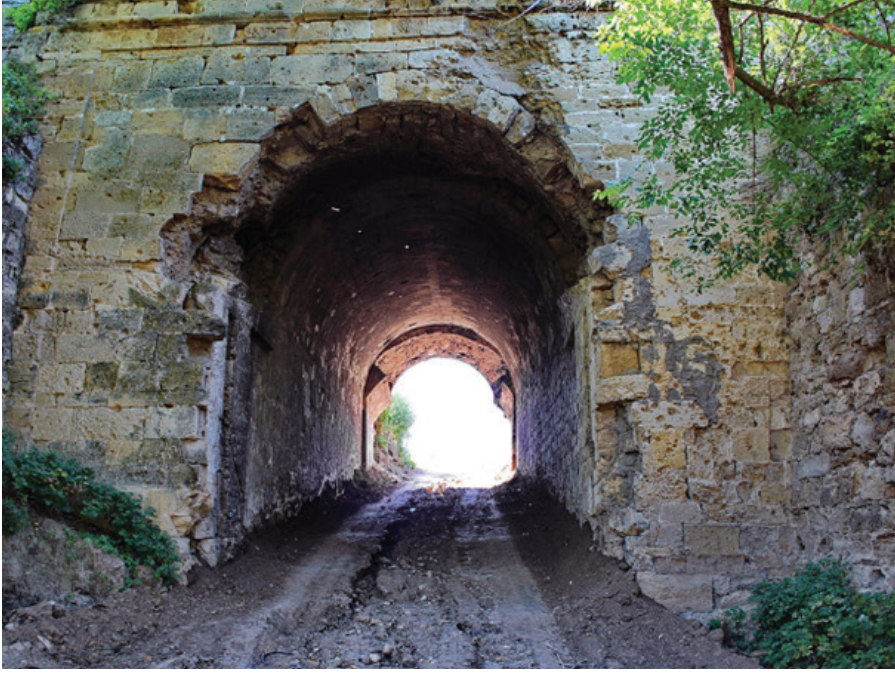
F.16. Bender Kalesi iç kalenin girişi.