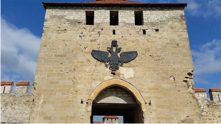
F.17. Bender içkale kapısı.