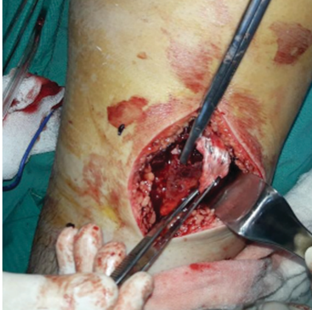
Resim 4. Sağlam olan paratenon: makasın ucu ile gösterilmiştir.