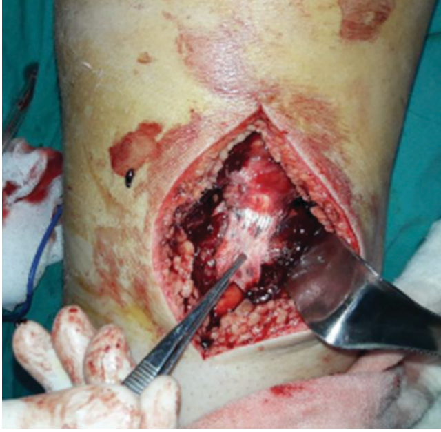
Resim 3. Paratenondan ayrılan patellar tendon