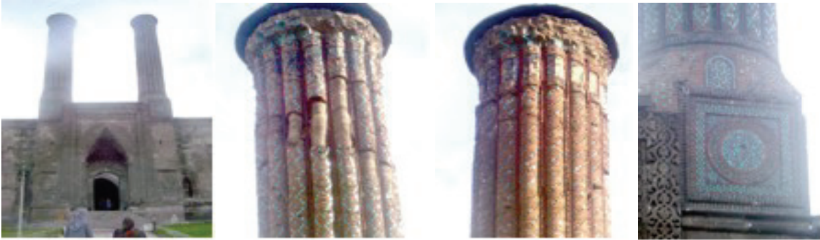
Şekil1. Çifte minareler medresesi / Erzurum

Bir örnek verecek olursak; Erzurum'un simgesi olan Çifte Minareler Medresesi (Şekil 1) ciddi biçimde doğanın tahribatına uğramıştır. Kar ve yağmur sularının olumsuz etkilediği tarihi mekanın özellikle minarelerinde meydana gelen hasarlar endişe doğuracak seviyededir. Minarelerin altında yer alan ve mavi çinilerle tezyin edilmiş bölümlerde bozulma ve sökülmeler sürmektedir. Minarenin çinili bölümündeki doğal tahribat, minarenin özelliğini yitirmesine yol açacak boyuttadır. Ayrıca minarelerin üzerindeki sırlı süslemeler de gerekli onarımlar yapılmadığı için kopmaktadır (Erzurum Gazetesi, 2005).