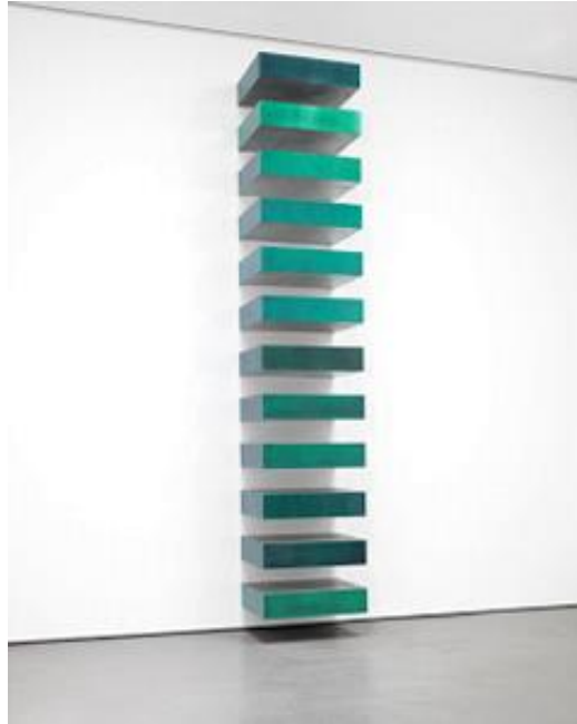
Resim 7. Donald Judd, “İsimsiz-Raf”-“Untitled- Stack”, 1966,

1960’larda en önemli minimalist sanatçılardan biri olarak öne çıkan Donald Judd, yanılsamanın her türüne ve dışavurumculuğa karşı olarak sade ve anlamsız biçimleri tercih eder. 1965 yılında Artforum Dergisi’ne yazdığı “Spesifik Nesnelere” başlıklı makalesinde illüzyon yaratmaya duyduğu antipatiden bahseder(Karahan, 2015 ).