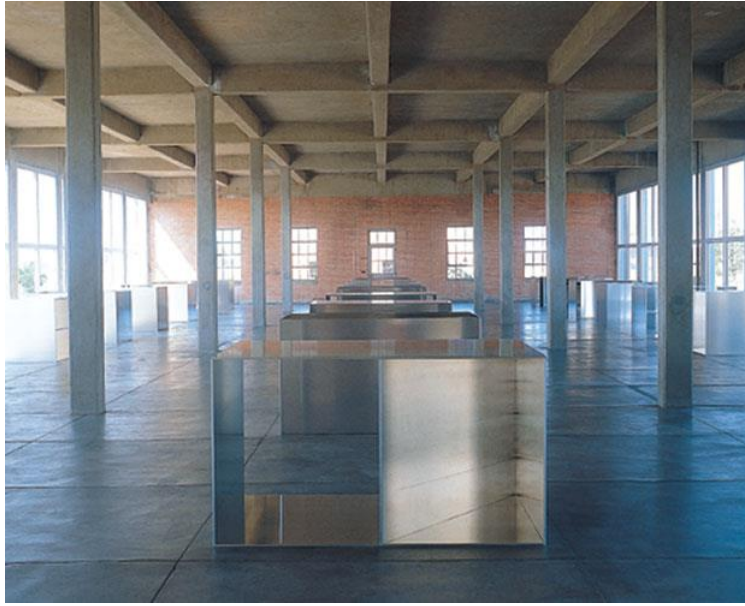
Resim 3. Donald Judd, "İsimsiz"-“Untitled”, 1982-86, Alüminyum, Chinati Foundation, Marfa Texas.

Donald Judd, sanatta düş gücü ürününe her türlü dışavurumcu (ekspresyonist) anlatıma karşı olmuş, belirli nesnelere adını verdiği yalın geometrik biçimleri kullanarak nesnel heykel anlayışını savunmuştur. Kompozisyonu, parçalar arasındaki ilişki üstüne kurma ilkesine karşı çıkmış, tümevarım ilkesini benimsemiştir. Malzeme olarak çelik ya da demir kullanmış ve bunları canlı renklerle boyamıştır. 1964'te Donald Judd, renkli "pleksiglas" ile çalışmaya başlamış ve bu malzeme sanatçıya özgü bir sembol haline gelmiştir. Genel olarak Judd'un yapıtları statiktir ve duygusal anlamlar taşımaz. Ancak iddialı boyutlarıyla izleyiciyi, "izleyici, eser ve eserin yer aldığı mekân" üçlüsü arasındaki ilişkiyi gözlemeye yöneltmektedir.