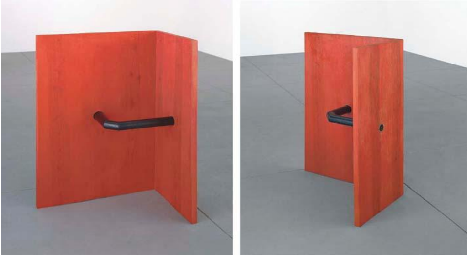
Resim 4. Donald Judd, “İsimsiz”-“Untitled”, 1962, Köşeli Siyah Bir Boru,