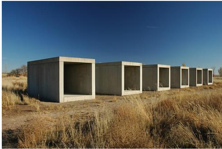
Resim 2. Donald Judd, “İsimsiz”-“Untitled”, 1984, Beton, Chinati Foundation, Marfa Texas.

Donald Judd, New York Art Students League ve Columbia Üniversitesi'nde felsefe ve sanat tarihi eğitimi görmüş, 1959-65 yılları arasında eleştirmen olarak çalışmıştır. 1950'lerde resme ilgi duyan Judd, 1960'ların başında heykelle yönelerek tek renkli rölyefler yapmış, 1963'ten itibaren dizi mantığıyla duvara monte edilen “spesifik nesne” adını verdiği ahşap üç boyutlu birimlerini gerçekleştirmiştir. Sonraki yıllarda bu birimleri endüstriyel olarak imal ettirmeye çalışan Judd, 1970'ten itibaren tümüyle mekâna özgü çalışmalara yönelmiştir. Sanatçı, 1973 yılında Texas'ın Marfa kentine yerleşerek, eski bir asker barınağını atölye ve sergi mekânı haline getirmiştir (Hoel, 2013). 1980'lerde mobilya tasarımına yönelen Judd'un 1959-75 yıllarını kapsayan ve Minimalizm akımı için önemli 36 kaynak olan “Toplu Yazıları”-“Complete Writings 1959-75” 1976'da yayımlamıştır.