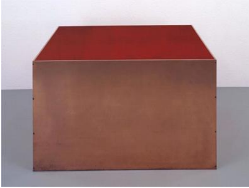
Resim 8. Donald Judd, “İsimsiz”-“Untitled”, 1972,

Judd, aslında resim eğitimi almış olmasına rağmen metal, ahşap, plastik ve reçine gibi ticari olarak kullanılabilen malzemelerle deneyler de yapmıştır. 1960'ların ortalarında eserlerini “heykel” olarak değil “obje” olarak nitelermeye başlamıştır. Tuval yüzeyi gibi iki boyutlu bir yüzeyde yaratılmaya çalışılan üç boyut yanılısamasına karşı olmuştur. Ona göre yaşadığımız ortam ve kullandığımız malzemeler zaten üç boyutludur ve bir yanılısama ile iki boyut üzerinde üç boyutu hissettirmeye çalışmak en basitinden “saçma”dır (Tizgöl, 2008). O, malzemenin doğasına müdahale edebilecek, izleyicinin saf görsel deneyimindeki dikkati dağıtacak tüm müdahalelerden kaçınmaya çalışmıştır.