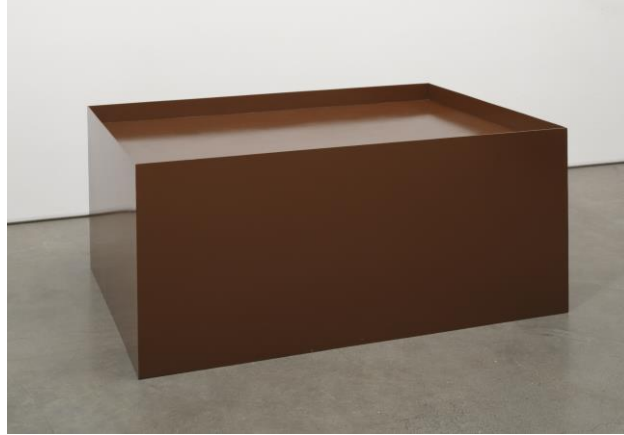
Resim 1. Donald Judd, “İsimsiz”-“Untitled”, 1968, Alüminyum, Guggenheim Museum, New York.

Donald Judd, New York Art Students League ve Columbia Üniversitesi'nde felsefe ve sanat tarihi eğitimi görmüş, 1959-65 yılları arasında eleştirmen olarak çalışmıştır. 1950'lerde resme ilgi duyan Judd, 1960'ların başında heykelle yönelerek tek renkli rölyefler yapmış, 1963'ten itibaren dizi mantığıyla duvara monte edilen “spesifik nesne” adını verdiği ahşap üç boyutlu birimlerini gerçekleştirmiştir. Sonraki yıllarda bu birimleri endüstriyel olarak imal ettirmeye çalışan Judd, 1970'ten itibaren tümüyle mekâna özgü çalışmalara yönelmiştir. Sanatçı, 1973 yılında Texas'ın Marfa kentine yerleşerek, eski bir asker barınağını atölye ve sergi mekânı haline getirmiştir (Hoel, 2013). 1980'lerde mobilya tasarımına yönelen Judd'un 1959-75 yıllarını kapsayan ve Minimalizm akımı için önemli 36 kaynak olan “Toplu Yazıları”-“Complete Writings 1959-75” 1976'da yayımlamıştır.