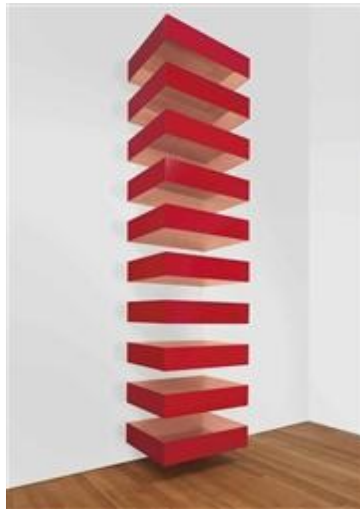
Resim 5. Donald Judd, “İsimsiz”-“Untitled”, 1989,

Yanılsamanın her türüne ve dışavurumculuğa karşı olan Judd, yalın ve anlam taşımayan biçimleri yeğlemiştir. Bugün dünyanın birçok büyük müzesinde kopyaları bulunan ve en tanınmış heykeli olan “İsimsiz”, dikey bir duvara 20 cm aralıklarla asılmış parlak kırmızı kutulardan oluşmaktadır. Üst üste monte edilmiş, tekrar edecek şekilde asılan, hiçbir özel düzeni ve birbiriyle ilişkisi olmayan bu parçaları, sonsuz bir tekrardan alınmış bir kesit gibi algılanırlar(Resim-5). Judd bu parçaların sayılarını kurallara bağlamamış, her galeride parça sayısını duvar yüksekliğine göre değiştirmiştir (Erzen, 2008).