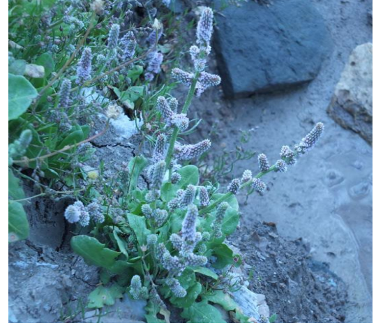
Şekil 2. P. spicata bitkisinin doğal alandaki görüntüsü