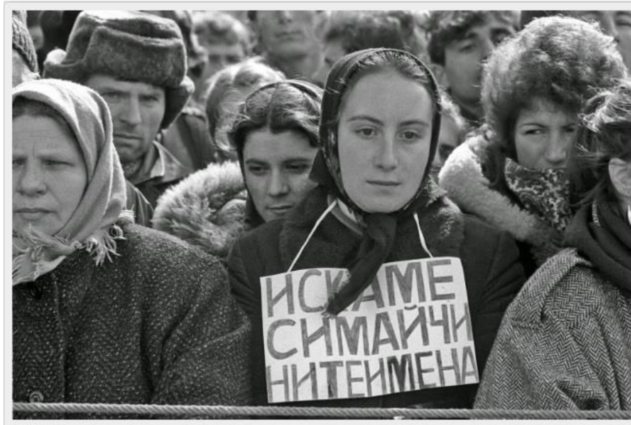
Resim 2. “Ana İsimlerimizi İstiyoruz” Pankartı Taşıyan Bir Türk Kadını

Çoğulcu siyasi hayata geçildiği seneyi izleyen yılda Türkler tarafından birçok kent merkezinde zorla değiştirilen isimlerin geri verilmesi için protestolar düzenlenmiştir. Bu taleplere olumlu cevap veren Bulgar devleti, eğer isterlerse Türklerin isimlerini geri almalarına kanuni hak vermiştir. Buna ilaveten her ne kadar Bulgaristan Halk Cumhuriyeti reddedilip Bulgaristan Cumhuriyeti kurulmuş olsa da yeni devlet eski komünist rejimin baskıları esnasında hayatlarını kaybeden, maddi ve manevi zararlara uğrayan mağdur kişi ve ailelere tazminat ödemeyi kabul etmiştir. Bulgaristan Cumhuriyeti eski rejimin zararlarını karşılamaya hazır olduğunu ifade etmekle sorumluluk halebliğine gitmiş böylece yapısal ve doğrudan şiddetin uygulandığını resmi olarak kabul ettiği anlamı çıkmaktadır. Elbette bütün bu gelişmelerin oluşmasında sadece Türklerin değil yeni siyasi ortamda çoğulcu siyasi düzenin ve uluslararası baskıların da katkısı büyük olmuştur (Jelyazkova, 1998).