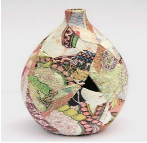
374x593(Ağatekin, 2016, s:956)