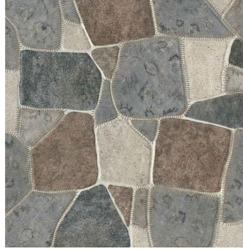
374x593(Ağatekin, 2016, s:956)