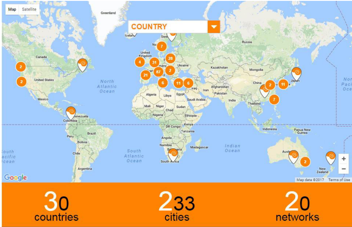
Resim 2: Dünyadaki cittaslow şehirlerinin haritası

Cittaslow ağının merkezi İtalya'dır. 2017 Mayıs ayı itibariyle ağına dahil olmuş 30 ülkeden 233 şehir bulunmaktadır.