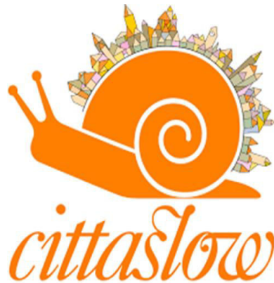
Resim 1: Cittaslow logo

Bir şehrin Sakin Şehir Ağı'na katılımı gerçekleştiğinde, o şehir, Sakin Şehir hareketinin logosunu ve Sakin Şehir markasını kullanma hakkına sahip olmaktadır. Sakin Şehirlerin logosu, sırtında şehri taşıyan salyangozdur. Salyangozun simge olarak seçilmesinin felsefi bir anlamı bulunmaktadır. “Salyangoz yavaş hareket eder. Hızlı olmak insanı akılsız ve düşüncesiz kılar. Yavaş hareket etmek bir erdemdir. Akıl ve ağırbaşlılığı ifade eder” (Yurtseven, Kaya ve Harman, 2010:24).