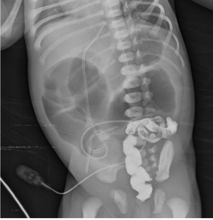
Resim 2. Olgu 2: Duodenal atrezi: Baryumlu grafide mide ve bulbusda "çift hava; Double bubble" görünümü