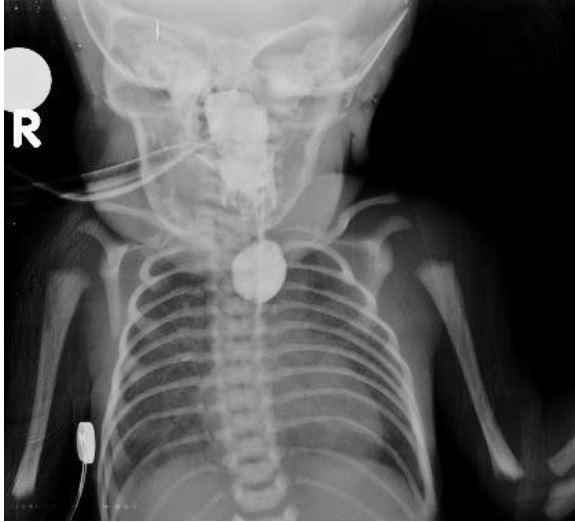
Resim 1. Olgu 1: Özofagus atrezisi; Baryumlu grafide atretik özofagus poşu içinde radyopak madde birikimi görülmektedir.