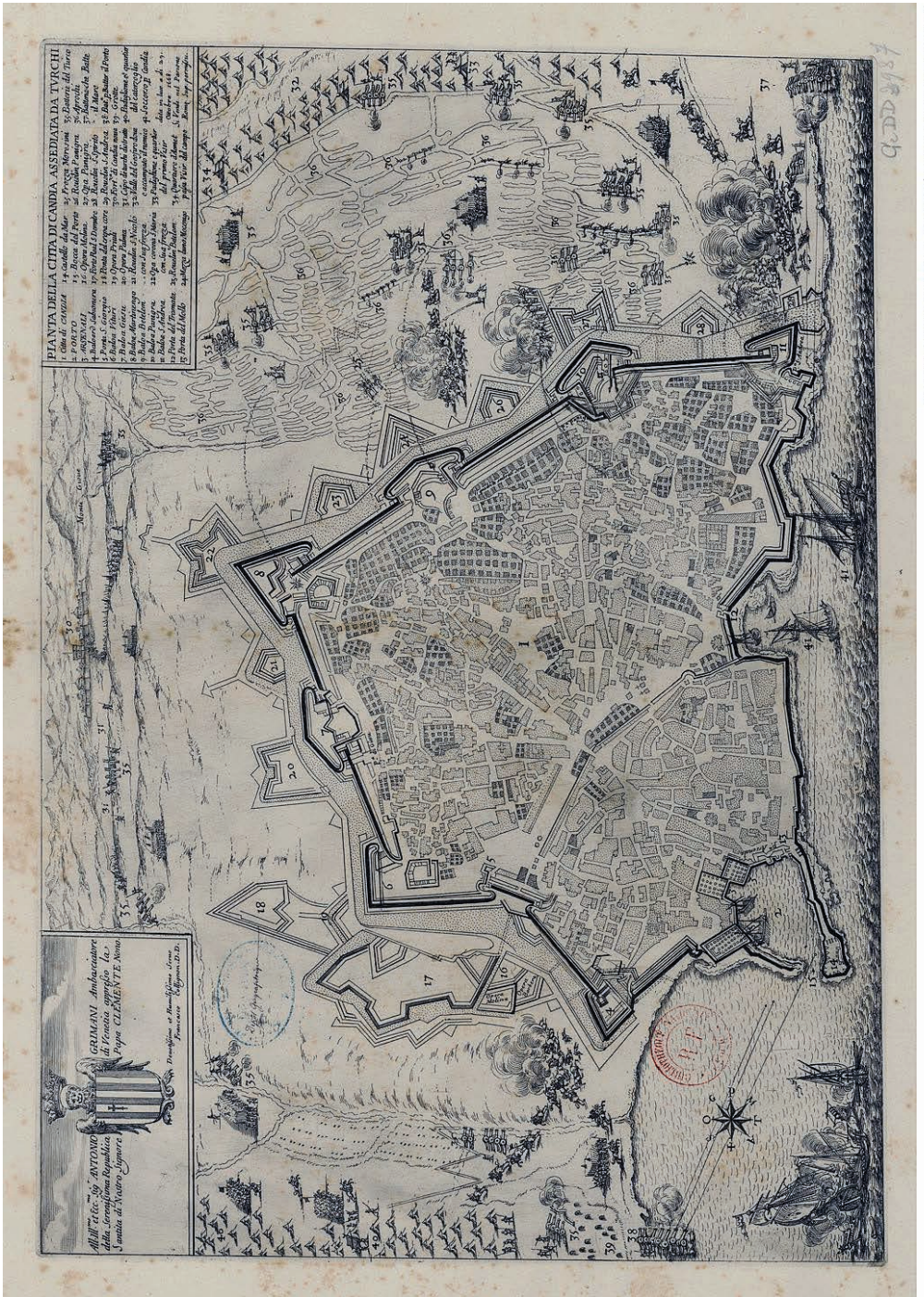
EK-2: Kandiye Kalesi ve önlerinde Osmanlı kuşatma yerleşimi.