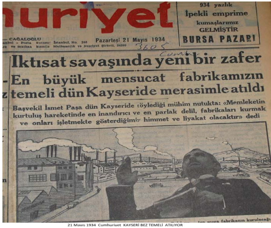
Ek 6: Kayseri Bez Fabrikası Temel Atma Tören