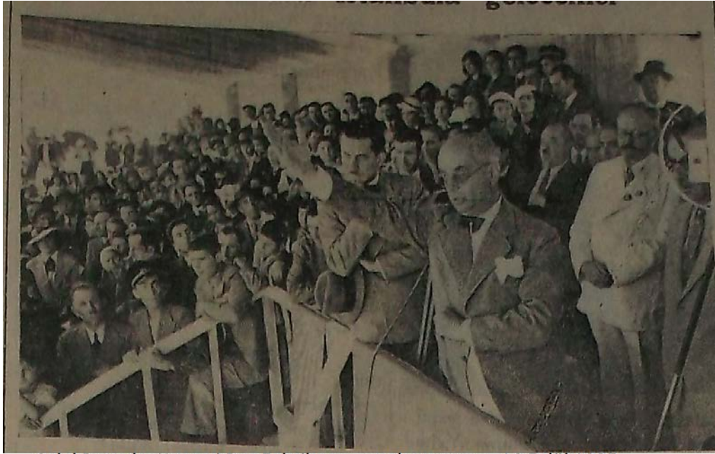
Celal Bayar'ın Kayseri Bez Fabrikasını açış konuşması 16 Eylül 1935