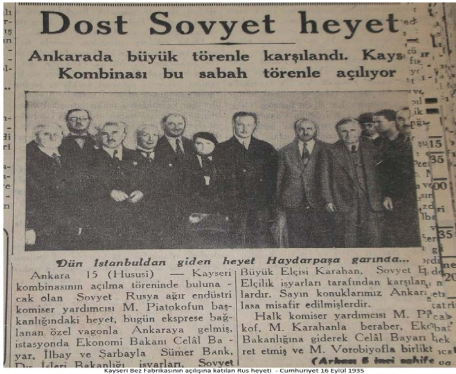
Ek 7: Kayseri Bez Fabrikasının açılışında Rus heyeti