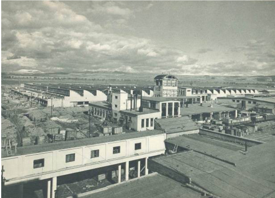
Ek 5:Kayseri Bez Fabrikası genel görünümü