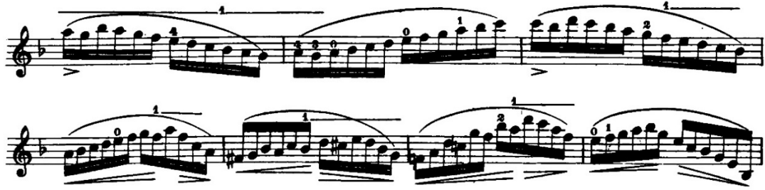
Şekil 9. H. E. Kayser 36 Violin Studies Op. 20 metodunun 16 numaralı etüdünden örnek bir kesit

Anketler aracılığıyla edinilen verilerde, sol el tekniğinin geliştirilmesi için ağırlıklı olarak H. E. Kayser 36 Violin Studies Op.20 metodunun önerildiği saptanmış olup, metodun 16 ve 18 numaralı etütlerinin öğrenci tarafından çalışılmasının uygun olduğu belirlenmiştir. Eserde keman tekniği açısından önemli olduğu öğretim elemanı görüşlerine göre belirlenmiş pasajlarla benzerlik gösteren ve esere yönelik çalışılmasının faydalı olacağı düşünülen çalışmalar aşağıdaki gibidir.