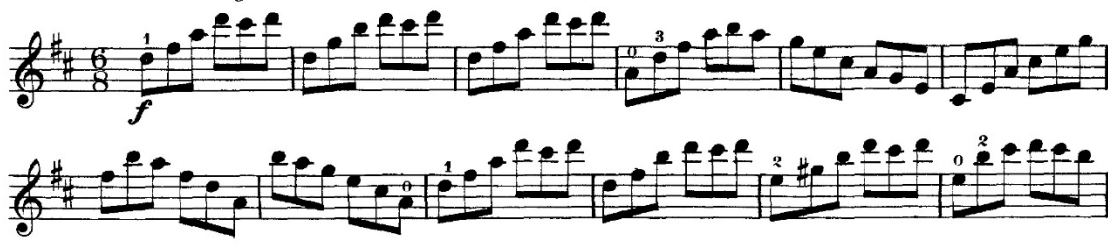
Şekil 12. F. Wohlfahrt–60 Studies for the Violin Op.45 metodunun 34 numaralı etüdünden örnek bir kesit

Anketler aracılığıyla edinilen verilerde, sol el tekniğinin geliştirilmesi için ağırlıklı olarak J. F. Mazas-Etudes Op.36 metodunun önerildiği saptanmış olup, metodun ilk kitabının 16 ve 21 numaralı etütlerinin öğrenci tarafından çalışılmasının uygun olduğu belirlenmiştir. Eserde keman tekniği açısından önemli olduğu öğretim elemanı görüşlerine göre belirlenmiş pasajlarla benzerlik gösteren ve esere yönelik çalışılmasının faydalı olacağı düşünülen çalışmalar aşağıdaki gibidir.