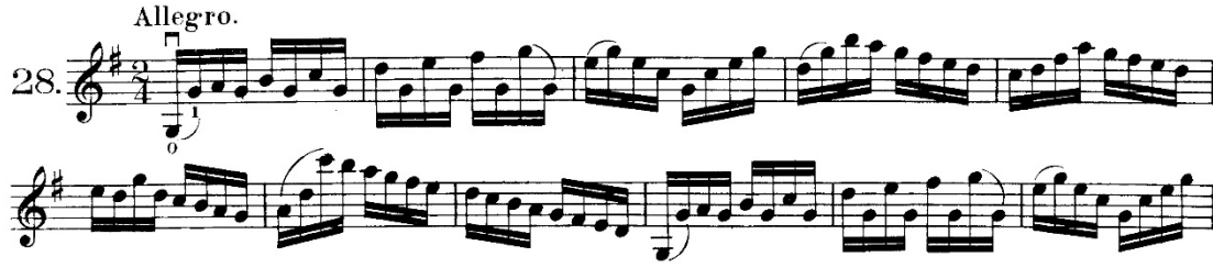
Şekil 16. Hans Sitt–100 Violin Etudes Op.32 metodunun 28 numaralı etüdünden örnek bir kesit

Anketler aracılığıyla edinilen verilerde sağ el tekniğinin geliştirilmesine yönelik ağırlıklı olarak R. Kreutzer–40 Etudes metodunun önerildiği saptanmış olup, 3 numaralı etüdün yay çeşitlemelerinin öğrenci tarafından çalışılmasının uygun olduğu belirlenmiştir. Eserde keman tekniği açısından önemli olduğu öğretim elemanı görüşlerine göre belirlenmiş pasajlarla benzerlik gösteren ve esere yönelik çalışılmasının faydalı olacağı düşünülen çalışmalar aşağıdaki gibidir.