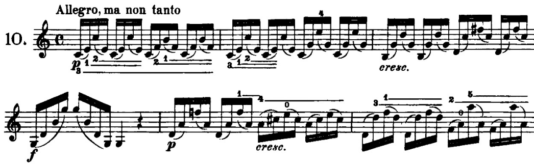
Şekil 18. R. H. E. Kayser 36 Violin Studies Op.20 metodunun 10 numaralı etüdünden örnek bir kesit

Anketler aracılığıyla edinilen verilerde, sağ el tekniğinin geliştirilmesi için ağırlıklı olarak H. E. Kayser 36 Violin Studies Op.20 metodunun önerildiği saptanmış olup, metodun 10 numaralı etüdünün öğrenci tarafından çalışılmasının uygun olduğu belirlenmiştir. Eserde keman tekniği açısından önemli olduğu öğretim elemanı görüşlerine göre belirlenmiş pasajlarla benzerlik gösteren ve esere yönelik çalışılmasının faydalı olacağı düşünülen çalışmalar aşağıdaki gibidir.