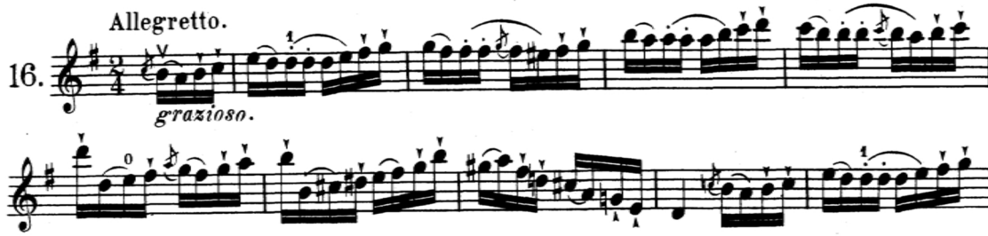
Şekil 13. J. F. Mazas–Etudes Op.36 metodunun 16 numaralı etüdünden örnek bir kesit

Anketler aracılığıyla edinilen verilerde, sol el tekniğinin geliştirilmesi için ağırlıklı olarak J. F. Mazas-Etudes Op.36 metodunun önerildiği saptanmış olup, metodun ilk kitabının 16 ve 21 numaralı etütlerinin öğrenci tarafından çalışılmasının uygun olduğu belirlenmiştir. Eserde keman tekniği açısından önemli olduğu öğretim elemanı görüşlerine göre belirlenmiş pasajlarla benzerlik gösteren ve esere yönelik çalışılmasının faydalı olacağı düşünülen çalışmalar aşağıdaki gibidir.