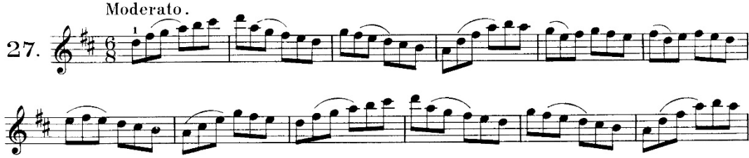
Şekil 4. Hans Sitt 100 Violin Etudes Op.32 2.Kitap, 27 numaralı etütten örnek bir kesit

Anketler aracılığıyla edinilen verilerde ağırlıklı olarak Hans Sitt'in metodunun önerildiği saptanmış olup, beş kitaptan oluşan metodun ikinci ve üçüncü kitaplarının öğrenci tarafından çalışılmasının uygun olduğu düşünülmektedir. Eserde keman tekniği açısından önemli olduğu öğretim elemanı görüşlerine göre belirlenmiş pasajlarla benzerlik gösteren ve esere yönelik çalışılmasının faydalı olacağı düşünülen çalışmalar aşağıdaki gibidir.