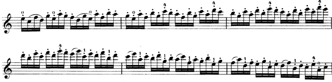
Şekil 8. R. Kreutzer 40 Etudes metodunun 3 numaralı etüdünden örnek bir kesit

Anketler aracılığıyla edinilen verilerde, sol el tekniğinin geliştirilmesi için ağırlıklı olarak H. E. Kayser 36 Violin Studies Op.20 metodunun önerildiği saptanmış olup, metodun 16 ve 18 numaralı etütlerinin öğrenci tarafından çalışılmasının uygun olduğu belirlenmiştir. Eserde keman tekniği açısından önemli olduğu öğretim elemanı görüşlerine göre belirlenmiş pasajlarla benzerlik gösteren ve esere yönelik çalışılmasının faydalı olacağı düşünülen çalışmalar aşağıdaki gibidir.