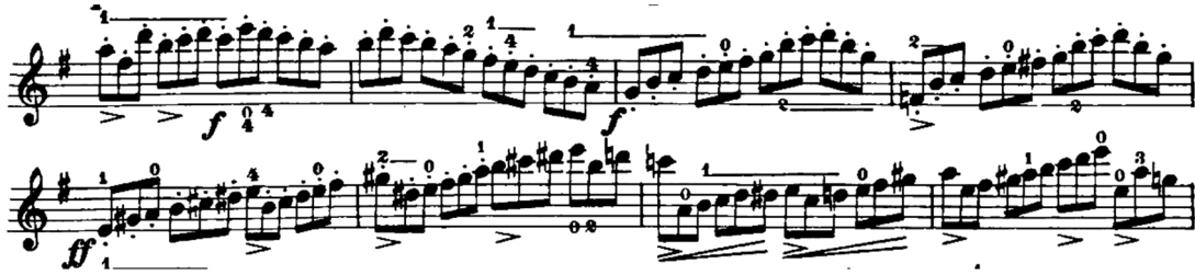
Şekil 10. H. E. Kayser 36 Violin Studies Op. 20 metodunun 18 numaralı etüdünden örnek bir kesit

Anketler aracılığıyla edinilen verilerde, sol el tekniğinin geliştirilmesi için ağırlıklı olarak Wohlfahrt–60 Studies for the Violin Op.45 metodunun önerildiği saptanmış olup, metodun 33 ve 34 numaralı etütlerinin öğrenci tarafından çalışılmasının uygun olduğu belirlenmiştir. Eserde keman tekniği açısından önemli olduğu öğretim elemanı görüşlerine göre belirlenmiş pasajlarla benzerlik gösteren ve esere yönelik çalışılmasının faydalı olacağı düşünülen çalışmalar aşağıdaki gibidir.