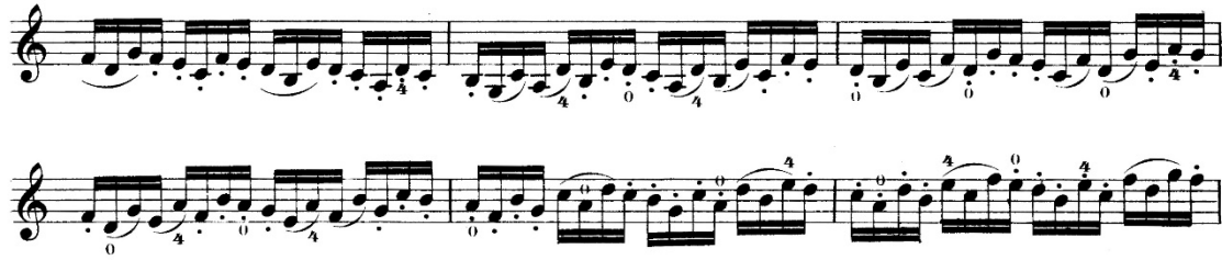
Şekil 17. R. Kreutzer–40 Etudes metodunun 3 numaralı etüdünden örnek bir kesit

Anketler aracılığıyla edinilen verilerde sağ el tekniğinin geliştirilmesine yönelik ağırlıklı olarak R. Kreutzer–40 Etudes metodunun önerildiği saptanmış olup, 3 numaralı etüdün yay çeşitlemelerinin öğrenci tarafından çalışılmasının uygun olduğu belirlenmiştir. Eserde keman tekniği açısından önemli olduğu öğretim elemanı görüşlerine göre belirlenmiş pasajlarla benzerlik gösteren ve esere yönelik çalışılmasının faydalı olacağı düşünülen çalışmalar aşağıdaki gibidir.