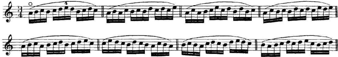
Şekil 1. O. Sevcik School of Violin Technique Op.1, 1. Kitap, 1 numaralı egzersizinden örnek bir kesit

O. Sevcik'in School of Violin Technique adlı 4 kitaptan oluşan Op.1 metodu içerisinde, çalışmanın konusu olan esere yönelik birinci kitabının kullanılmasının zorluk derecesi ve işgüçsellik açısından doğru olacağı düşünülmektedir. Sözü geçen metotta amaçlanan, öğrencinin sol el tekniğinin birçok tonda yazılmış farklı parmak varyasyonlarıyla keman üzerinde ustalığının geliştirilmesidir. Eserde keman tekniği açısından önemli olduğu öğretim elemanı görüşlerine göre belirlenmiş pasajlarla benzerlik gösteren ve esere yönelik çalışılmasının faydalı olacağı düşünülen çalışmalar aşağıdaki gibidir.