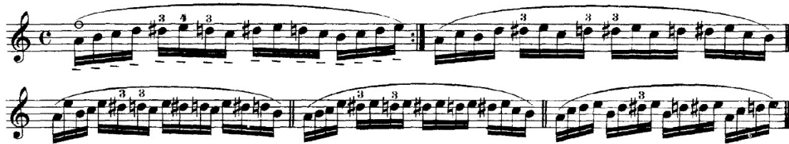
Şekil 2. O. Sevcik School of Violin Technique Op.1, 1. Kitap, 8 numaralı egzersizinden örnek bir kesit