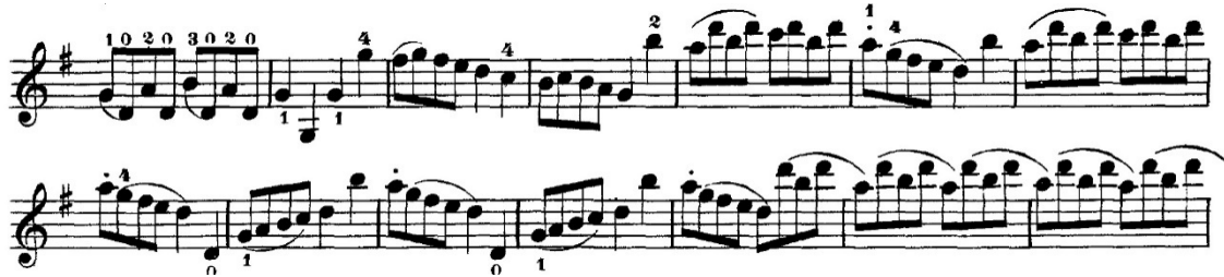
Şekil 11. F. Wohlfahrt–60 Studies for the Violin Op.45 metodunun 33 numaralı etüdünden örnek bir kesit

Anketler aracılığıyla edinilen verilerde, sol el tekniğinin geliştirilmesi için ağırlıklı olarak Wohlfahrt–60 Studies for the Violin Op.45 metodunun önerildiği saptanmış olup, metodun 33 ve 34 numaralı etütlerinin öğrenci tarafından çalışılmasının uygun olduğu belirlenmiştir. Eserde keman tekniği açısından önemli olduğu öğretim elemanı görüşlerine göre belirlenmiş pasajlarla benzerlik gösteren ve esere yönelik çalışılmasının faydalı olacağı düşünülen çalışmalar aşağıdaki gibidir.