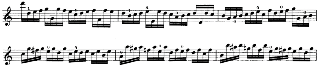
Şekil 7. R. Kreutzer 40 Etudes metodunun 2 numaralı etüdünden örnek bir kesit

Anketler aracılığıyla edinilen verilerde, sol el tekniğinin geliştirilmesi için ağırlıklı olarak R. Kreutzer'in 40 Etudes metodunun önerildiği saptanmış olup, metodun 2 ve 3 numaralı etütlerinin öğrenci tarafından çalışılmasının uygun olduğu belirlenmiştir. Eserde keman tekniği açısından önemli olduğu öğretim elemanı görüşlerine göre belirlenmiş pasajlarla benzerlik gösteren ve esere yönelik çalışılmasının faydalı olacağı düşünülen çalışmalar aşağıdaki gibidir.