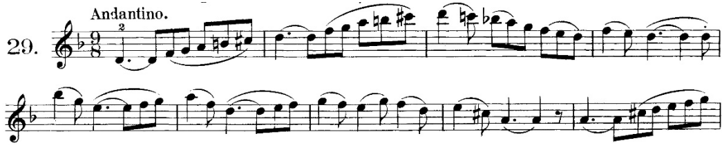
Şekil 5. Hans Sitt 100 Violin Etudes Op.32 2.Kitap, 29 numaralı etütten örnek bir kesit