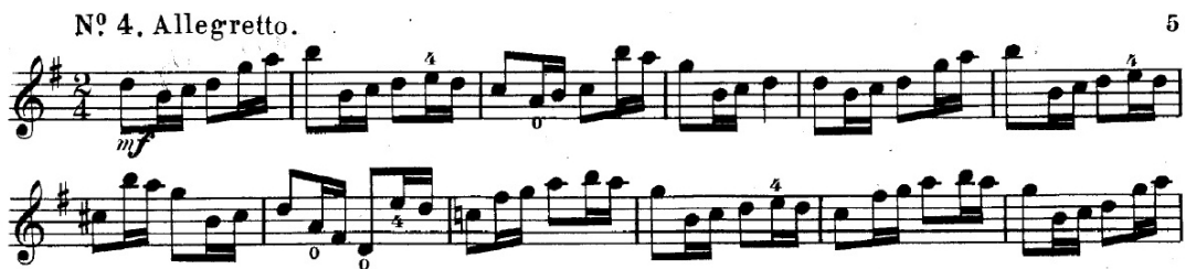
Şekil 19. F. Wohlfahrt–60 Studies for the Violin Op.45 metodunun 4 numaralı etüdünden örnek bir kesit

Anketler aracılığıyla edinilen verilerde, sağ el tekniğinin geliştirilmesi için ağırlıklı olarak Wohlfahrt–60 Studies for the Violin Op.45 metodunun önerildiği saptanmış olup, metodun 4 numaralı etüdünün öğrenci tarafından çalışılmasının uygun olduğu belirlenmiştir. Eserde keman tekniği açısından önemli olduğu öğretim elemanı görüşlerine göre belirlenmiş pasajlarla benzerlik gösteren ve esere yönelik çalışılmasının faydalı olacağı düşünülen çalışmalar aşağıdaki gibidir.