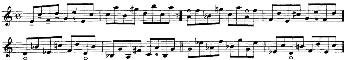
Şekil 3. O. Sevcik School of Violin Technique Op.1 1. Kitap, 14 numaralı egzersizinden örnek bir kesit