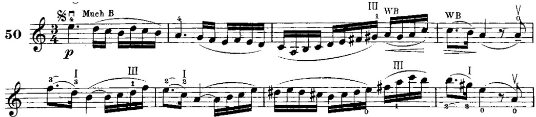
Şekil 6. Hans Sitt 100 Violin Etudes Op.32 3.Kitap, 50 numaralı etütten örnek bir kesit

Anketler aracılığıyla edinilen verilerde, sol el tekniğinin geliştirilmesi için ağırlıklı olarak R. Kreutzer'in 40 Etudes metodunun önerildiği saptanmış olup, metodun 2 ve 3 numaralı etütlerinin öğrenci tarafından çalışılmasının uygun olduğu belirlenmiştir. Eserde keman tekniği açısından önemli olduğu öğretim elemanı görüşlerine göre belirlenmiş pasajlarla benzerlik gösteren ve esere yönelik çalışılmasının faydalı olacağı düşünülen çalışmalar aşağıdaki gibidir.