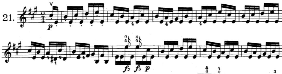
Şekil 14. J. F. Mazas–Etudes Op.36 metodunun 21 numaralı etüdünden örnek bir kesit

Ömer Can–Keman Eğitimi II metodundaki etütler incelendiğinde, metodun yazarı tarafından üretildiği etütler ve diğer metotlardan alıntı yapılarak oluşturulmuş bir metot olduğu görülmektedir. Sözü geçen alıntılanmış metotların, keman eğitiminde ve araştırmanın konusu olan eserde kullanımı, elde edilen anket sonuçlarına göre saptanmış ve Ömer Can–Keman Eğitimi II metodunun ayrıca bir inceleme gerektirmediği düşünülmüştür.