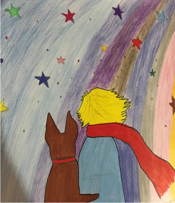
Küçük Prens Kitap Çizimi

“Küçük Prens” adlı çizimde tüm renklerin aktif kullanımı ve başkarakter olan Küçük Prens ile birlikte tilkinin çizimi öğrencinin hangi kahramanlara öncelik tanıdığını göstermektedir. Küçük Prens’in boyun şalı ve yıldızlar ayrıntılarına öncelik tanınmıştır. Kitabın geçtiği uzay boşluğu ve galaksiler konusuna da dikkat çeken yıldız çizimleri öğrencinin kitaba dair önemli gördüğü hususları resim içerisine aktardığını göstermektedir.