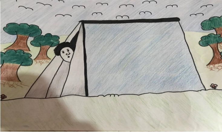
Deyimler ve Öyküleri Kitap Çizimi

“Deyimler ve Öyküleri”, “Mevlana’dan Seçme Öyküler” adlı bölümlerden oluşan kitaplarda ilgilerini çeken ve resmetmeye en uygun gördükleri kısımlara yönelmeleri öğrencilerin eserlerde etkilendikleri temalar hakkında fikir vermektedir. Temelde listeye tavsiye ettikleri kitaplar akabinde listeden seçtikleri eserler öğrencilerin yöneldikleri temalar, türler hakkında fikir vermektedir.