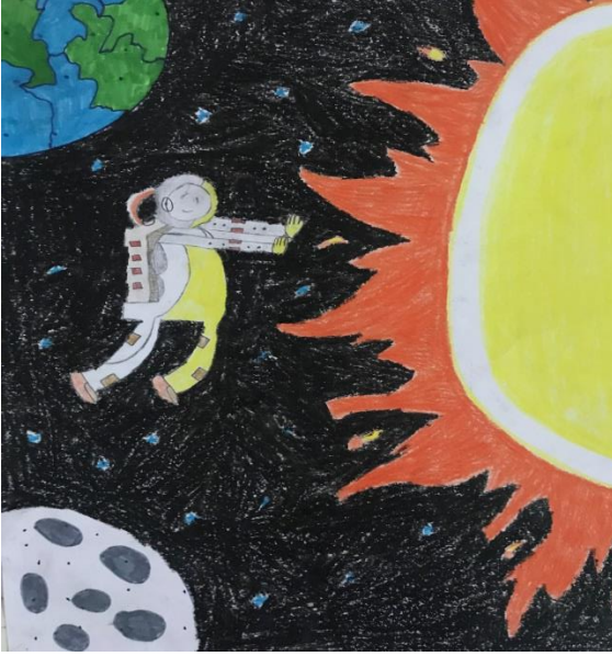
Şu Acayip Gökyüzü Kitabı: Pastel Boya

Çizimlerde kara kalem, sulu boya, pastel boya, kuru boya gibi materyallerin tercih edilmesi öğrencinin kendini ifade esnasında en doğru olacağını düşündüğü araçlara yöneldiğini göstermiştir.