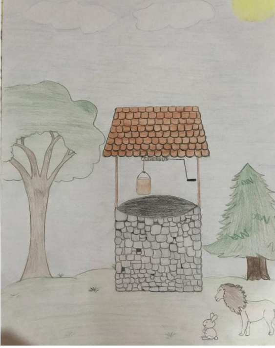
Mevlana'dan Seçme Öyküler Kitap Çizimi

“Küçük Prens” adlı çizimde tüm renklerin aktif kullanımı ve başkarakter olan Küçük Prens ile birlikte tilkinin çizimi öğrencinin hangi kahramanlara öncelik tanıdığını göstermektedir. Küçük Prens’in boyun şalı ve yıldızlar ayrıntılarına öncelik tanınmıştır. Kitabın geçtiği uzay boşluğu ve galaksiler konusuna da dikkat çeken yıldız çizimleri öğrencinin kitaba dair önemli gördüğü hususları resim içerisine aktardığını göstermektedir.