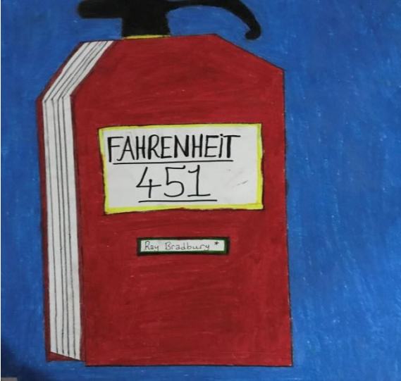
Fahrenheit 451 Kitap Çizimi

Yukarıda verilen “Siyah inci” adlı kitabın çiziminde öğrenci, kitap boyunca ata dair okuduğu bilgilerin üzerinde bıraktığı tesirin genel aktarımını sağlamıştır. Kitabın tamamını esas alarak bir karakterin görselleştirilmesi söz konusudur. “Siyah İnci” ismine binaen resimde tema siyah beyaz kurgulanmış renklere başvurulmamıştır. Hazırlanan konsept içerisine yerleştirilen at figürü kitabın ana temasına paralellik gösterecek şekilde renklendirilmiştir.