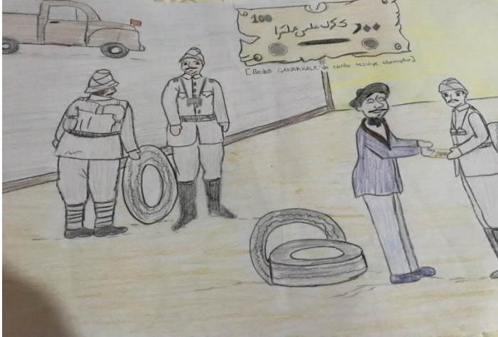
Sen Çanakkale’ nin Hangi Kahramanısın?

“Sen Çanakkale’ nin Hangi Kahramanısın?” adlı yapıtta öğrencinin son sahnede millî ve manevi duygulara eğilen bir bölüme yönelmesi arka planda bayrak, asker gibi ayrıntıları resmetmesi kişiler arasındaki farkı belirlemek amacıyla kıyafetler arasında ayrımı çizime yansıtması, olay örgüsü içerisinde oldukça önemli bir yere sahip olan belgeyi resmin dikkat çekici noktasında daha net olarak resmetmesi öğrenci hakkında fikir vermektedir.