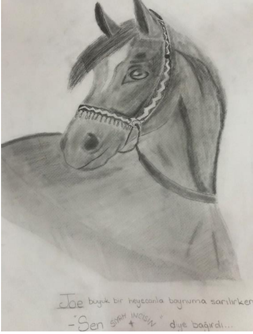
Siyah İnci Kitap Çizimi

Yukarıda verilen “Siyah inci” adlı kitabın çiziminde öğrenci, kitap boyunca ata dair okuduğu bilgilerin üzerinde bıraktığı tesirin genel aktarımını sağlamıştır. Kitabın tamamını esas alarak bir karakterin görselleştirilmesi söz konusudur. “Siyah İnci” ismine binaen resimde tema siyah beyaz kurgulanmış renklere başvurulmamıştır. Hazırlanan konsept içerisine yerleştirilen at figürü kitabın ana temasına paralellik gösterecek şekilde renklendirilmiştir.