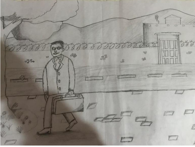
Malcolm X Kitap Seçimi

Yukarıdaki çizimde ilgili kitabın 61. sayfasındaki “Özgürlük” kısmı resmedilmiştir. Baharın gelişini anlatan kısımları resmetmek maksadıyla papatya, çiçekler ve kelebek kullanılırken; karakterin olumlu değişimini aktarmak için ceket, gözlük ve düzenli bir insan çizimi yapılmıştır. Mekânın hapisane kapısı olarak anlatımını desteklemek maksadıyla tel örgü çitleri yüksek duvar, büyükçe kapı ve gözetleme kulesi çizimi yapılmıştır.