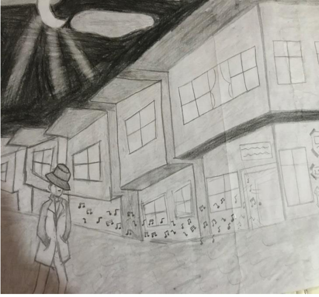
Ay Işıđı Sokađı Çizimi