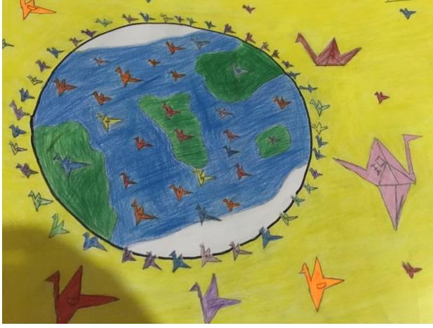
Sadako ve Kâğıttan Bin Turna Kuşu

Yukarıdaki çizimde öğrenci 75 ve 76. sayfaların “Sonsöz” bölümünün görselleştirilmesini yapmıştır. Öğrenci, iki sayfanın toplamda oluşturduğu izlenimi resme dönüştürmüştür. İlgili bölümde sınıf arkadaşlarının turna kuşlarını tamamlaması, kitabın dünyanın dört bir yanına yayılması işlenmektedir. Öğrenci dünyanın çevresini, içerisini ve dışını turna kuşları ile kaplayarak kitabın dünyaya yayılması ve öğrenciler tarafından eksik kuşların çizimini görselleştirmiştir.