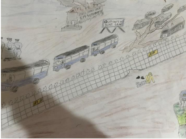
Çizgili Pijamalı Çocuk Kitap Çizimi

Yukarıdaki çizimde öğrenci 75 ve 76. sayfaların “Sonsöz” bölümünün görselleştirilmesini yapmıştır. Öğrenci, iki sayfanın toplamda oluşturduğu izlenimi resme dönüştürmüştür. İlgili bölümde sınıf arkadaşlarının turna kuşlarını tamamlaması, kitabın dünyanın dört bir yanına yayılması işlenmektedir. Öğrenci dünyanın çevresini, içerisini ve dışını turna kuşları ile kaplayarak kitabın dünyaya yayılması ve öğrenciler tarafından eksik kuşların çizimini görselleştirmiştir.