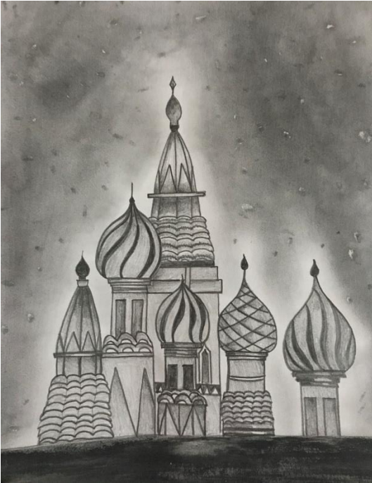
Charlotte Bronten'in Gizli Maceraları: Karakalem Çizimi

Hazırlanan çizimlerin 9'unda yazı kullanılmıştır. 4 resimde eserin ismi yazılmış, isim yazılı eserlerin 3 tanesi kapak olarak tasarlanmıştır. 1 çizimde resmin ana fikrini veren Osmanlıca ifadenin açıklaması, bir başka resimde eserin belkemiğini oluşturan soru, bir başka eserde ise metnin bir kısmı yazılmıştır. Kullanılan yazılar incelendiğinde resimlerin anlaşılabilirliğini artırmak amacıyla destekleyici unsur olarak yazıya başvurulduğunu göstermektedir. Bilhassa edebî bir eserin çiziminde tamamlayıcı