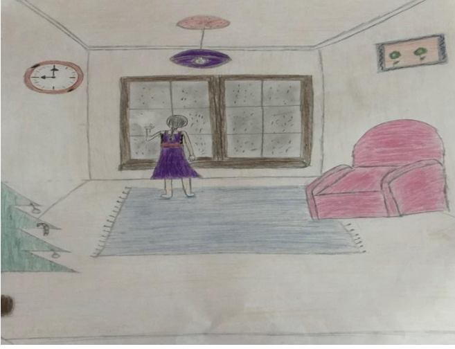
Kiraz Ağacı İle Aramızdaki Mesafe Kitabı

“Deyimler ve Öyküleri”, “Mevlana’dan Seçme Öyküler” adlı bölümlerden oluşan kitaplarda ilgilerini çeken ve resmetmeye en uygun gördükleri kısımlara yönelmeleri öğrencilerin eserlerde etkilendikleri temalar hakkında fikir vermektedir. Temelde listeye tavsiye ettikleri kitaplar akabinde listeden seçtikleri eserler öğrencilerin yöneldikleri temalar, türler hakkında fikir vermektedir.