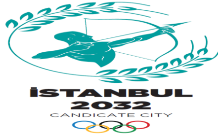
Şekil 6. Tasarlanan Üçüncü Sembol