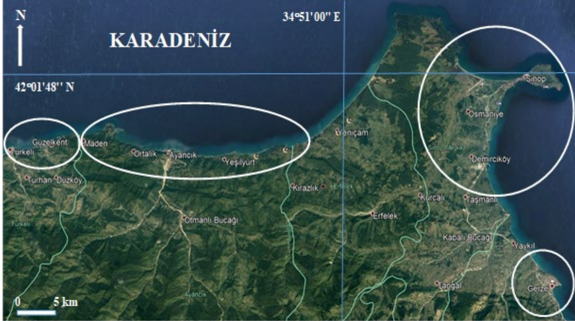
Şekil 1. Araştırma verilerinin ve bilgilerin toplandığı balıkçılık bölgeleri

ölçeklendirilip PaintShopPro 7.04™ yazılımıyla png formatında düzenlenerek FAO standartlarına göre çizilmiştir.