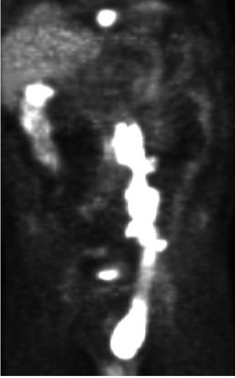
Şekil 1: F-18 Fluorodeoksiglikoz Pozitron Emisyon Tomografi (FDG PET): Yumuşak dokuda ve çıkan kolonda diffüz, boyun-mediasten-akciğer-kas grupları içerisinde ve batında lokalize olmak üzere çok sayıda hipermetabolik kitle ve sol femurda litik özellikli lezyon. Prostat bezi sol üst lateralde yerleşimli yoğun hipermetabolik odak (SUVmax: 18.4) izlendi.

Prostat lezyonuna yönelik yapılan sorgulamada üriner sisteme ait spesifik bir şikayet saptanmadı. Dijital rektal muyanede, prostat dokusu normal boyutta ve kıvamı elastik olarak değerlendirildi. Laboratuvar incelemesinde böbrek ve karaciğer disfonksiyonu düşündürecek bulgular; Kreatinin, aspartat aminotransferaz, alanin aminotransferaz, gama glutamil transferaz ve laktat dehidrojenaz yüksekliği görüldü (Kreatinin: 1.59 mg/dL, AST: 62 U/L, ALT: 38 U/L, GGT:70 U/L, LDH 780 U/L). Prostat spesifik antijen normaldi (0.86 ng/mL). Batın içerisi ve prostat dokusundaki lezyonlara yönelik yapılan değerlendirme sonucunda, kemik iliği, inguinal lenf nodu ve prostat biyopsisi yapılması planlandı. Transrektal ultrason eşliğinde, önce FDG PET’de tarif edilen lezyona yönelik ve sonrasında da standart prostat biyopsisi