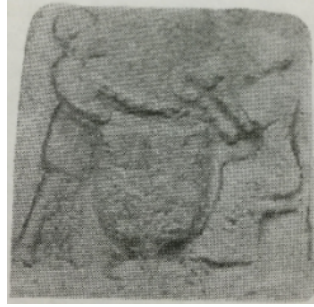
Resim 7: Kös ve Zil