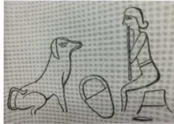
Resim 5: Bir Sümer mühründe ney, kaval benzeri çalgı (Galpin, Francis W. (1937); The Music of the Sumerians Babylonians and Assyrians, Cambridge University Press, Cambridge, s. 16-17)

“Resim 4” M.Ö. 2800 yılına tarihlenen, Ur şehrinde bulunmuş çifte kamış boru biçimli bu çalgılar Filedelphiya’da Üniversite Müzesi’nde yer almaktadır. “Resim 5”de bir Sümer mühründe ney, kaval benzeri çalgı çalan kişi görülmektedir. Louvre Müzesi’nde kaynaklarında olduğu gibi “flüt” ya da “boru” bağlam da düşünülerek ney, kaval veya dilsiz olacaktır. Resim 5’teki çalgının tutuş pozisyonu yere daha paralel tutulurken, blok flüt tarzı ve kalın bir gövdeye sahiptir. Resim 5’teki türevi olarak düşünülecek olursa neye ve Mezopotamya’da günümüzde başat nefesli