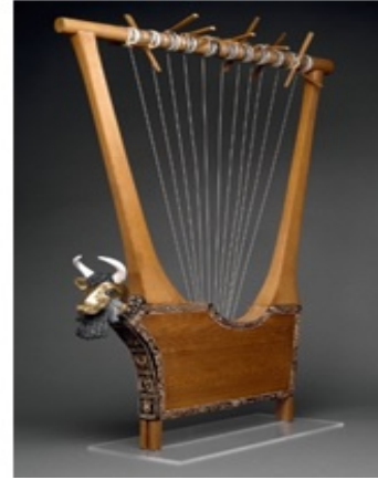
Resim 2: Kraliçenin Liri

Ur şehri kazılarında 1928-1929 sezonunda bulunan gümüş lir, M.Ö. 2600 yılına tarihlenmektedir. "Resim 1"de lirin hemen yanında ön tarafındaki detay büyük ölçekte görünmektedir. Kraliçenin liri olarak bilinen "Resim 2"de bulunan lir ise arkeolojik bulgular doğrultusunda sonradan imal edilmiştir. Bu iki eser de Londra'da The British Museum'da bulunmaktadır. "The Standard of Ur" adıyla gene The British Museum'da bulunan "Resim 3"deki içi oyuk kutunun da bir müzik aletinin parçası olduğu düşünülmektedir. İki yüzüne resmedilen sahneler Sümer'de yaşam hakkında fikir vermektedir. Bir yüzünde savaş, bir yüzünde barış zamanı resmedilmiştir. "Resim 3"de görünen barış zamanının resmedildiği yüzde, sağ üst köşede arp çalan bir müzisyen görünmektedir; hemen yanında ayakta duran diğer kişinin de şarkıcı olduğu değerlendirilmektedir. Üst sırada oturanların yönetim kademesini oluşturan üst düzey bir kurulu tasvir ettiğini ve müzik dinlediklerini söyleyebiliriz.