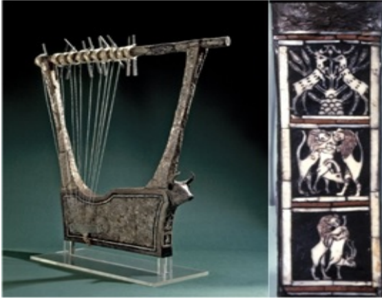
Resim 1: Gümüş Lir ve ön detayı ( https://www.britishmuseum.org/research/collection_online/collection_object_details.aspx?objectId=368337&partId=1&searchText=Silver+lyre&page=3 )

Müziğin ilk ortaya çıkışı ile ilgili kesin bilgiler bulunmamaktadır. "Müzik" sözünün kökeni antik Yunan mitolojisinde bulunan esin perileri "musalar"dan gelmektedir. Çoğu zaman her ikisi de birbirine karıştırılmış durumda karşımıza çıksa da, ya tanrılar ya yarı-tanrılar ya da insanüstü kahramanlar olarak, insanları ve tanrıları mitolojik öyküler içinde müzikle ilgili görüyoruz. Şanlıurfa Arkeoloji ve Mozaik Müzesi'nde yer alan en önemli mozaiklerden biri olan Orfeus mozağında resmedilen Orfeus da Apollon'un, musalardan biri olan Kalyope'den çocuğu olarak mitolojide geçer. Sümerlerden bahsederken yazılı tarihin de başlangıcına gitmiş oluyoruz. Yazının icadından, yaygın kullanımından önce müzik hatırlatıcı olarak kullanılıyordu. Hatırlanması istenen tarihsel olayların öyküsünün, destanların, şiirlerin, kutsal metinlerin müzik aracılığıyla daha kolay hatırlanabildiği fark edilmişti. Hayvan seslerinin taklidi de müziğin kökenleri arasında görülmektedir. Mağara duvarlarına görünüşü resmedilen hayvanların sesleri de bir şekilde taklit edilmek istenecekti. Boğaya benzetilerek yapılan Sümer lirlerinin önünde bir de boğa başı bulunuyordu. Büyük Sümer lirlerinin boğa böğürmesine benzer derin, güçlü bas tonlar çıkardığı, böylece insan eliyle boğa sesinin yansındığı düşünülmektedir (Adams, Liliana Osses; a.g.e., s. 13).