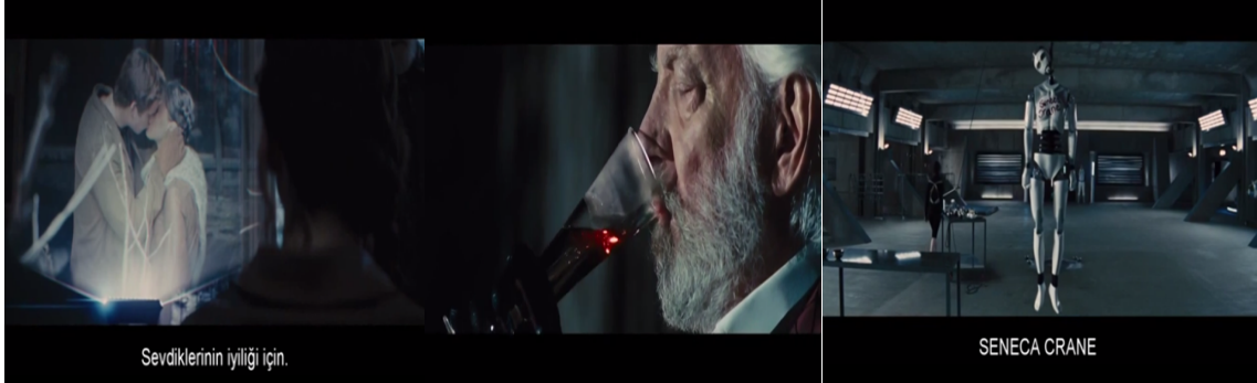
Resim 6: İpe Asılan Robot

Resim 4'de Başkan Snow, Katniss'e ve Gale ile olan görüntüsünü izletiyor ve sevdiklerinin iyiliği için ondan uzak durması gerektiği konusunda uyarıyor. Bu diyalog Katniss'e mntıkada her an izlendiği gerçeğini bir kez daha hatırlatıyor. Beşinci görselde ise, Başkan Snow'un yani iktidarın önce beyaz şarap ile dolu olan kadehinin bir yudum içince kan ile dolduğu sahne görülüyor. Snow'un kan dolan kadehi iktidarını sürdürebilmek için mntıkadaki masum halkın kanı ile beslendiğini sembolize ediyor. Seçilen diğer görselde ise, Katniss'in bir robotu boynundan ipe astığını görüyoruz. Bu eylemi ile Katniss senatoya ve Snow'a bir nevi başkaldırmış oluyor. Mntıka halkının tıpkı robotlar gibi verilen komutlar doğrultusunda hayat sürmesini isteyen başkan Snow'a, bir şeylerin değişeceği mesajı veriliyor.